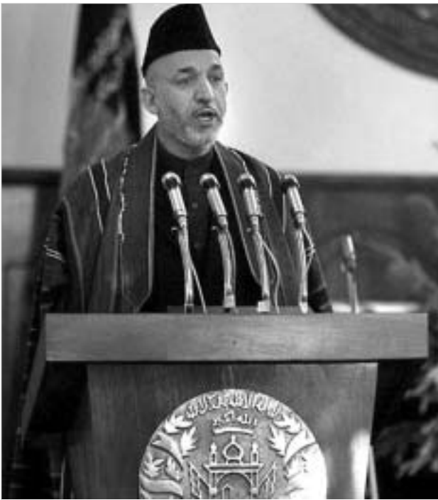
ჰამიდ კარზაი ყოფილ მოვამედის თვითონ იმორებს

ავღანური პოლიტიკის მალალი ემლონებიდან ორი ადამიანიც წავიდა, რომლებსაც, თეორიულად, პრეზიდენტი კარზაისთვის ყველაზე მწვავე კონკურენციის განევა შეეძლო. ჰამიდ კარზაი ჯერ კიდევ წინასწარ პრეზიდენტი კამპანიის დროს აცხადებდა, რომ მისი მთავრობის ახალი კაბინეტი დაკომპლექტებული იქნებოდა კვალიფიციური, პატიოსანი და ეფექტური მუშაობის უნარის მქონე ადამიანებისგან. და მართლაც, მის გუნდში დღეს ტექნიკარტე-