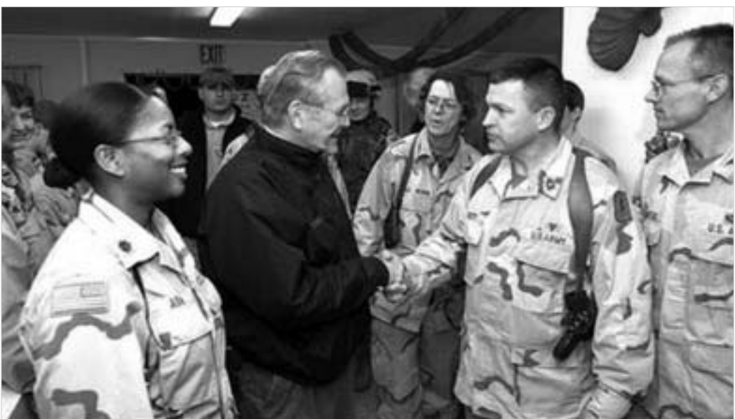
დონალდ რამსფელდი ქალაქ მონსუელთან მდებარე ამერიკულ სამხედრო ბაზაში.

აშშ-ს თავდაცვის მინისტრი დონალდ რამსფელდი მოულოდნელად ჩაფრინდა ერაყში, ქალაქ მონსუელთან მდებარე ამერიკულ სამხედრო ბაზაში. სწორედ იქ, სადაც რამდენიმე დღის წინ კამიკაძის მიერ მომხდარი აფეთქების შედეგად 22 ადამიანი დაიღუპა. ბაზაში ჩასული რამსფელდი, პირველ რიგში, ჰოსპიტალში გაემართა, სადაც აფეთქების დროს დაჭრილები არიან მოთავსებული. "მინდა მადლობა გადავუხადო ჯარისკაცებს და ბედნიერი შობა ვუსურვო," - განაცხადა აშშ-ს თავდაცვის მინისტრმა. აფეთქების შედეგად დაიღუპა 13 ამერიკელი სამხედრო, ხუთი სამოქალაქო სპეციალისტი და ოთხი ერაყელი. ამერიკელი სამხედროები ფიქრობენ, რომ ტერორისტმა-კამიკაძემ სამხედრო ბაზაში შეუმჩნევლად შეაღწია ამერიკული სამხედრო ფორმის ჩასაცმელი. ბაზა მოსულს აეროპორტის ტერიტორიაზეა განლაგებული. მისი ინფრასტრუქტურით სარგებლობენ როგორც სამხე-