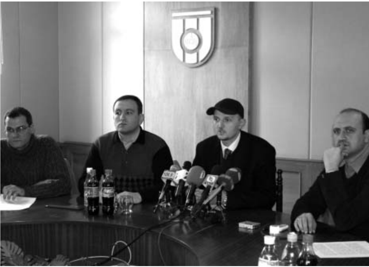
საინფორმაციო ადმინისტრაციის დირექტორი

მეექვსე დღეა, ახალი - საზოგადოებრივი სამარკო ნიშნით შეფუთული სახელმწიფო არხი ჩვენ - საზოგადოებას, ჩვენზე მზრუნველ ხელისუფლებას გვიამბობს, ხელისუფლებას კი - ჩვენზე. თუ ამ ექვსი სათერო დღის განმავლობაში ვინმეს მოლოდინი გაგიცრუვდათ, არ ღირს ასალეულებლად. ამ ტელევიზიაში ყველაფერი კიდევ ერთხელ თავიდან დაიწყება და ეს იქნება ძალიან მალე, მას შემდეგ, რაც პრეზიდენტი ხელს მოაწერს ორი დღის წინათ პარლამენტის მიერ მოწონებულ კანონს მაუწყებლობის შესახებ; მისი ამოქმედება კი ავტომატურად გულისხმობს ცვლილებებს: ახლად ჩამოყალიბებულ სამეურვეო საბჭოს შექმნა ხელახლა განსაზღვროს რეალური საზოგადოებრივი ტელევიზიის (დღეს მაუწყებელი სატელევიზიო არხი კანონის ძალით არ გარდაქმნილა საზოგადოებრივად) პრიორიტეტები, რის მიხედვითაც გადახალისდება (ან არ გადახალისდება) უკვე მოწონებული პროექტები. მოკლედ, მსჯელობა, კამათი, დებატები ნანატრი საზოგადოებრივი ტელევიზიის შესახებ ახლა იწყება, რისი სასიგნალო ნიშანიც გუშინ სახელმწიფო ტელევიზიაში საზოგადოებრივი მონიტორინგის კომისიის წევრების მიერ გამართული პრესკონფერენცია იყო.