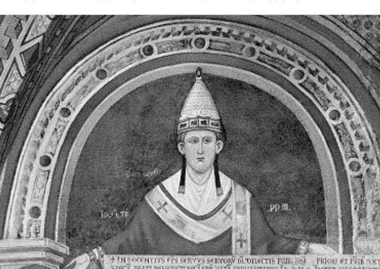
პაპი ინოკენტი III

მაგრამ ინტელექტუალები ხშირად მხოლოდ ნიდაგს ქმნიან ძალადობისათვის. საეკლესიო ხელმძღვანელობის თვალსაზრისით ეს ფილოსოფიური კამათი, თუნდაც წარმატებული, ნამდვილად არ იყო საკმარისი ნამდვილი გამარჯვებისთვის: თეოლოგურ დისკუსიაში ბოლო სიტყვა გამდიდრების წყურვილით მოცული უბირი რაინდების ხმლებს ეკუთვნოდა.