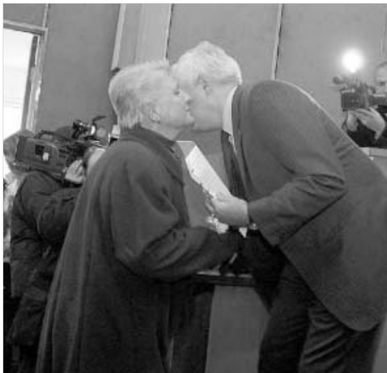
ამირან გამყრელიძე თავად აჭილდობდა

უკვე მესამედ წელიწადია, რაც საქართველოში 23 დეკემბერს ქართული მედიცინის დღეს აღნიშნავენ. ამ დღესთან დაკავშირებით, ვუშინ საქართველოს შრომის, ჯანმრთელობისა და სოციალური დაცვის მინისტრმა ამირან გამყრელიძემ ღვაწლმოსილი მედიცინის მუშაკები ოქროს საბატონო მედლებით, ორდენებითა და წითელი ვარდებით დააჯილდოვა.