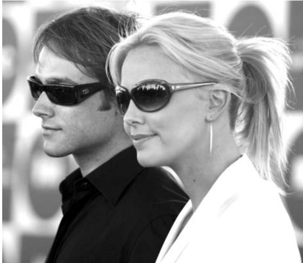
შარლიზ თერონი ბოიფრენდთან სტიუარტ ტანშენთან ერთად