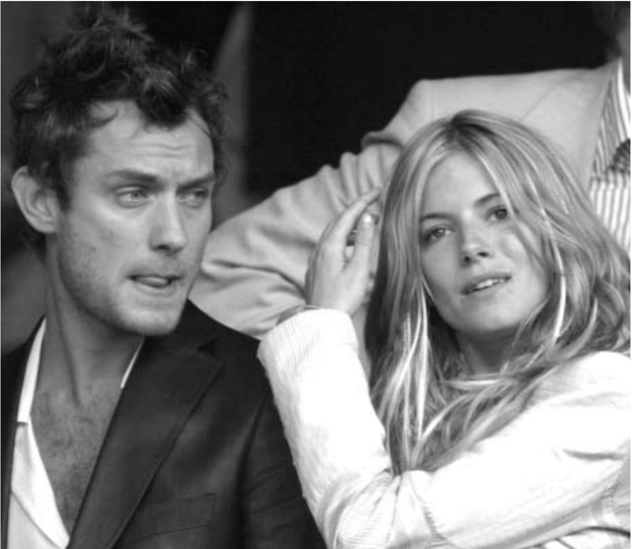
ბრედ პიტი და ჯენიფერ ანისტონი ერთად