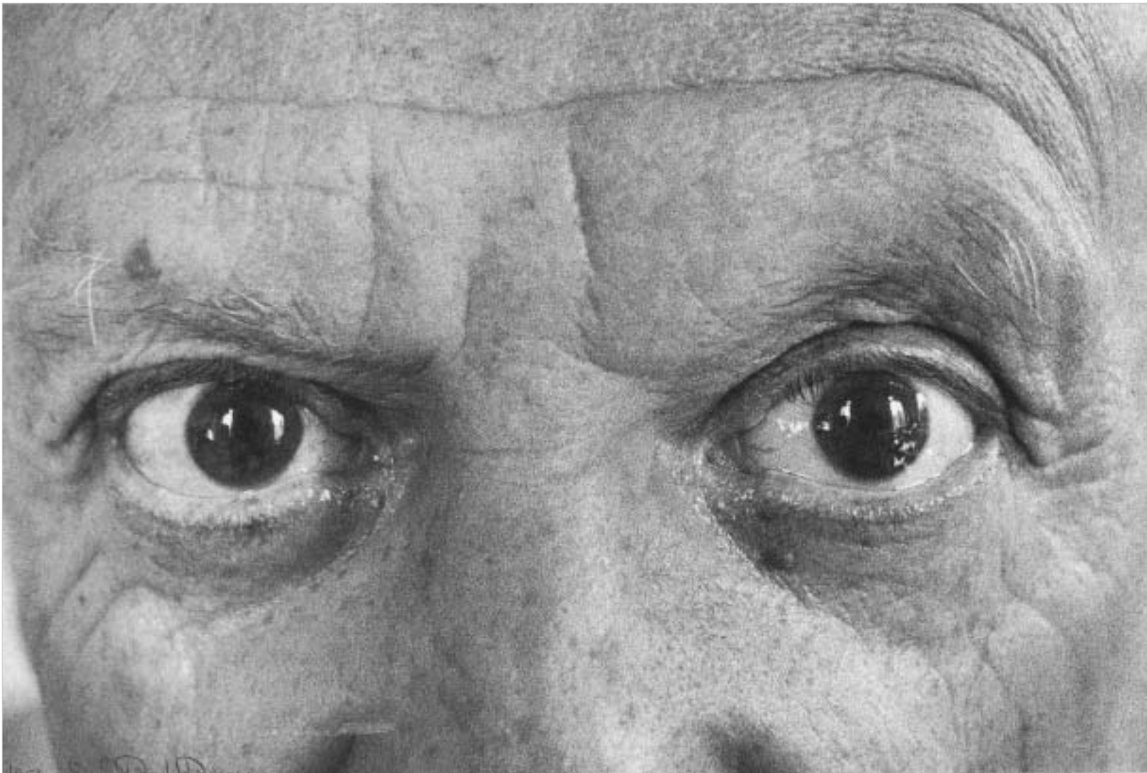
პიკასოს თვალები და ბუს მოტივზე შექმნილი ავტოპორტრეტი