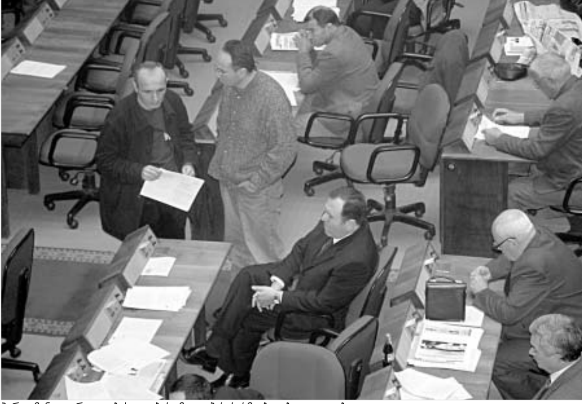
პარლამენტი ქრედიტების აღებას მტკი პასუხისმგებლობით ეკიდება.