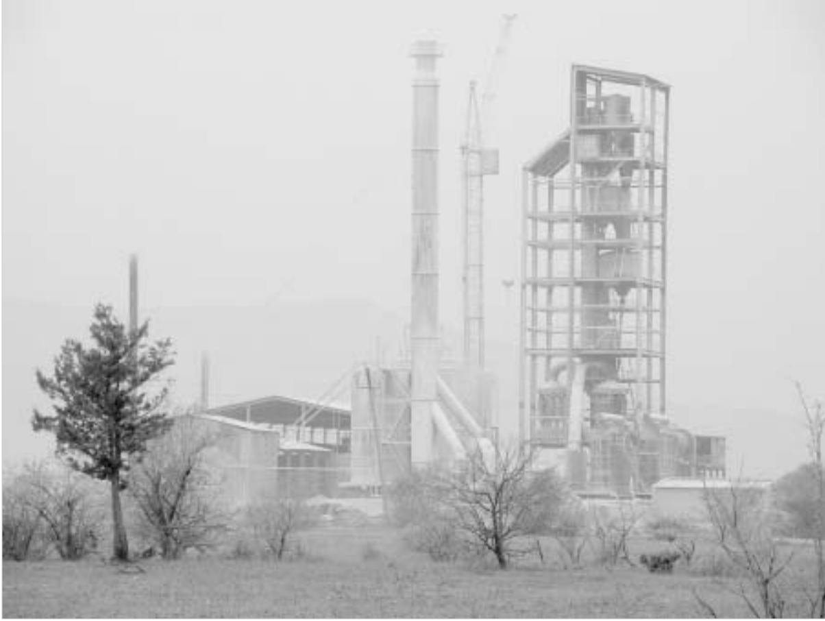
ხანდაკში "თოვლი" ზახვულშიც მოდის.

მათ ნათქვამში დარწმუნებას ექიმიც არ სჭირდება - ქვემო ხანდაკის უჩვეულოდ გადათეთრებული მინდვრებისა და ხეებისთვის თვალის გადავლებაც კმარა. მართალია, გუშინ თოვდა, მაგრამ ეს სითბურ ბუნების მოვლენას არანაირად არ უკავშირდებოდა. სამი წლის განმავლობაში უფილტვოდ, შესაბამისი ნორმების დარღვევით მომუშავე ცემენტის ქარხნიდან მთელი სოფელი ცემენტის მტვერში გახვია. "მანქანას ღამით რომ გაგაჩერებ, დღით ისეა მინა გადათეთრებული, თუ არ განბინადვებ, ვერ გაივლი. ზახვულში თეთრი ნაქვების ნახვა თუ ვინდა, აქ უნდა მოხედოთ. მინდვრებს ვეღარ ვამუშავებთ, თვალში გვეწვის მტვერისა. ესეც რომ არა, ასეთ მინაზე მოყვანილი მოსავალი არაფრად ვარგა. ვეღარც ბოსტნულს ვჭამთ და ვეღარც ხილს. შეკრებილი ვენახი გვიფუჭდება. საქონელი ვეღარ მოვინველიან-ქა, მტვირანი ბალახის გამოკვებობა ძროხის რძისა და მანონი არ დედდება," - საკუთარი გასაჭირის მოყვას ერთობა დამაინტერესებდა. ქარხნის ხელმძღვანელობა, მოსახლეობის საჩივრის საფუძველზე, სასამართლო ორჯერ დაეჯარიმა 75-80 ლარით - ეს იყო და ეს. "მაგათ 75 ლარის გადახდა