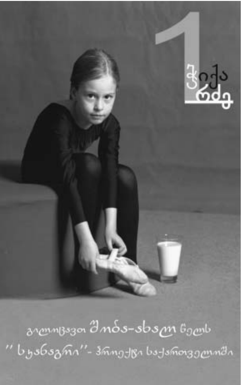
გილოცავთ შინა-ხვალს ნელს "სუანავრი"- პრეიქტს საქართველოში

ყინული. ოპტიმისტებმა მამნივე დასაკენეს, რომ იქ, სადაც წყა- ლია, სიცოცხლეც იქნება. უფრო ფრთხილ მეცნიერები კი აცხადებდნენ: მართალია, ნაკ- ელებად საფარაუდოა, სიცოცხლე წითელ ლანენტაზე ახლაც არსე- ბობდეს, მაგრამ, სავსებით შესაძ- ლებელია, რომ ადრეული სიცო- ცხლის კვალი აღმოჩენდეს. "ბიგლის" კონსტრუქტორები და პროექტის მონაწილე მეცნიე- რები აცხადებენ, რომ ხელის ჩაქ- ნევა ჯერ ადრეა და თანამგზავ- რისაგან სიგნალის მოსვლა კიდევ შესაძლებელია, თუმცა მათი ოპ- ტიმიზმი ყოველდღე კლებულობს. ბოლო იმედია, რომ "ბიგლს" "მარ- სის ოდისესი" აღმოაჩენს, ხომა- ლდი, რომელმაც 400 მილიონი კი- ლომეტრი გაიარა და თანამგზავ- რი მარსამდე მიიტანა. თუ ევროპელების ეს ინიცია- ტივა ჩაფუავდა, კითხვაზე პასუხ- ის გაცემა შეიძლება ამერიკელებმა მოახერხონ. ორი ამერიკული თანა- მგზავრი "სპირიტ" და "ოპორტუ- ნიტი" მარსზე იანვარში დაემგება.