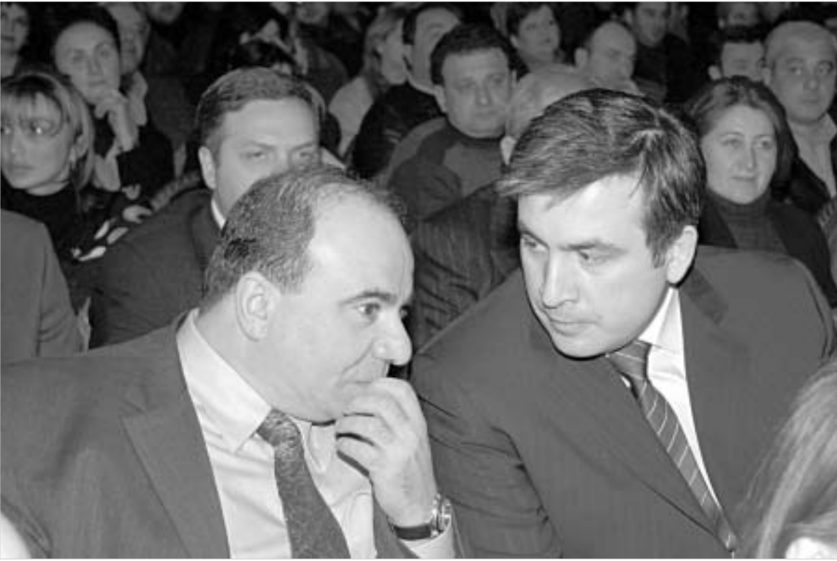
ახალი ხელისუფლება ბიზნესმენებს გამართვებულ თამაშის წესებს სთავაზობს.