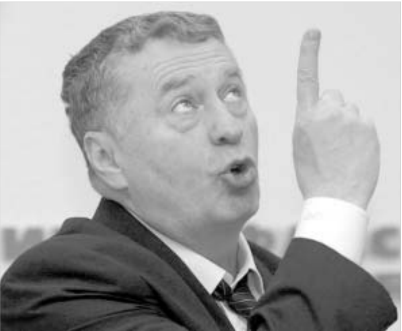
ვლადიმირ ქირინოსკი პრეზიდენტობას 2008 წელს გეგმავს.

რუსეთის ლიბერალურ-დემო- კრატიული პარტიის ლიდერი ვლადიმირ ქირინოსკი აცხადებს, რომ იგი 14 მარტს დაინშნულ რუ- სეთის საპრეზიდენტო არჩევნებ- თუმცა, უირინოსკი ამბობს, რომ იგი აუცილებლად წამოაყენებს საკუთარ კანდიდატურას 2008 წლის არჩევნებში. რუსეთის პირ- ველი ლიბერალ-დემოკრატი დღემდე ქვეყანაში გამართულ ყველა საპრეზიდენტო არჩევნებ- ში მონაწილეობდა. ნაკლებად სა- ვარაუდოა, რომ ქირინოსკის პა- რტია მხარს დაუჭერს არჩევნების ბოიკოტის ბოლო დროს გაჩენილ იდას. როგორც ცნობილია, არჩე- ვნებს ბოიკოს უცხადებს საპარ- ლამენტო არჩევნებში დამარცხე- თული "იამბოკო", რომლის ლი- დერი გრიგორი იავლისკი ასევე ყველა წინა არჩევნების კანდიდა- ტი იყო. უცნობია კომუნისტების საბოლოო პოზიცია. მართალია, მათ ხუთპროცენტია ბარერი წარმატებით გადალახეს და ახალ