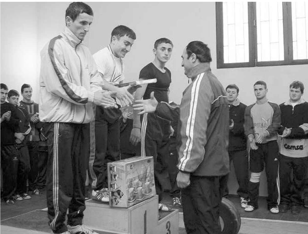
მსოფლიო ჩემპიონი გიორგი ასანიძე ახალგაზრდა პრიზორებს აკიდობს

სწორდით, სმენა! - გუშინ, ძალოსნობის დარბაზში საქართველოს ჩემპიონატი სწორედ ამ შეძახილით გაიხსნა. ჩემპიონატის მონაწილენი, შეძლებისდაგვარად, იცადენენ მწყობრს, საქართველოს დამსახურებული მწვრთნელი გურამ ფარულავა კი ძალოსნობის ფედერაციის ხელმძღვანელებს და, პირველ ყოვლისა, ფედერაციის ვიცე-პრეზიდენტს, მსოფლიო ჩემპიონ გიორგი ასანიძეს პატივს აბარებდა. პატივის თუ მოხსენების შემდეგ ჩემპიონატის მონაწილენებს მსოფლიო ჩემპიონმაც მიმართა, - გიორგი ასანიძე ყოველთვის სპორტში ვერ იქნება, ამიტომ ასპარეზი თქვენ - ახალგაზრდებმა უნდა ჩაიბაროთ, - და მათ შობა-ახალი წელი წინასწარ მიულოცა. გახსნის საზეიმო ცერემონიის შემდეგ შეჯიბრების რიგიც დადგა. ფიცარნაზე უხმეს 69 და 77 კილოგრამამდე წონით კატეგორიის ძალოსნებს და საქართველოს ჩემპიონატიც განახლდა. განახლდა იმიტომ, რომ გახსნის საზეიმო ცერემონიალს წინ უხსრებდა 56 და 62 კილოგრამამდე წონით კატეგორიებში ასპარეზობები; კიდევ იმიტომ, რომ ძალოსნობაში საქართველოს ჩემპიონატს ოთხწლიანი იძულებითი პაუზა ჰქონდა, რომლის მიზეზებიც რთული მისახვედრი არ უნდა იყოს - ეკონომიკური სიდუხჭირვე. ფედერაციის ვიცე-პრეზიდენტი გიორგი ასანიძეს თავდა. ერთ-ერთი მიზეზი ისიც