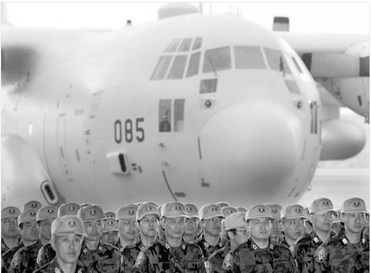
იაპონელი სამხედროები ერაყში ჩავიდნენ

იაპონიის არმიის პირველი ქვედანაყოფი 20 კაცის შემადგენ- ლობით გუშინ ერაყში ჩავიდა. ეს რაზმი დამატებითი ნაწილებითა- ვის ადგილზე პირობებს მოამზად-