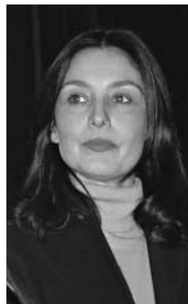
ფილმის რეჟისორი, ვანო ჩხარტიშვილი