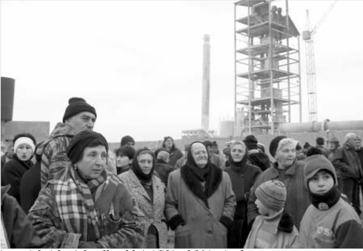
სოფელ ქვემო ხანდაკის მკვიდრი ცემენტის ქარხნის გაჩერებას ითხოვენ.