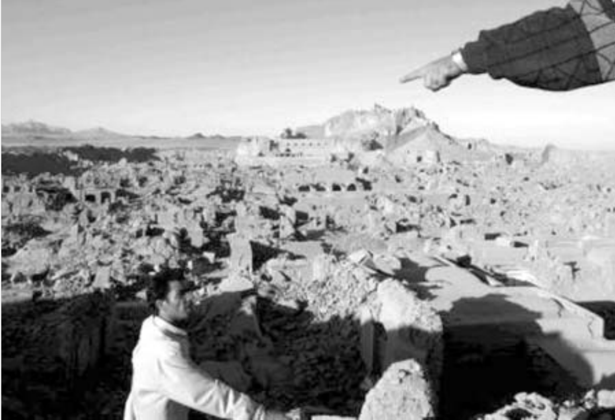
ისტორიული ქალაქი ბაში თითქმის მთლიანად დაინგრა.