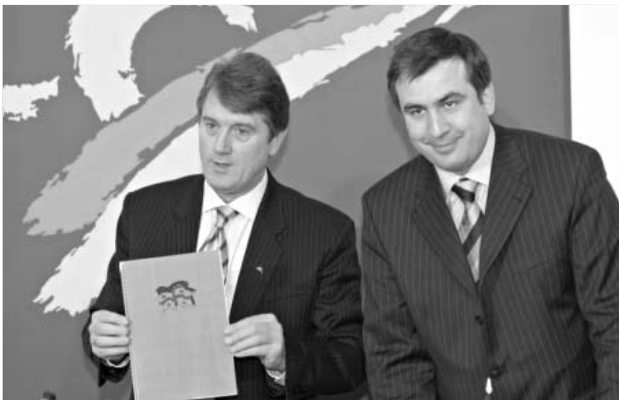
მიხეილ სააკაშვილით სავაზრა ვიქტორ იუშენკო სასამონდო გააოცა.

- თუ ხელისუფლება თავს აარიდებს სახალხო პოლემიკას, მაშინ მართალია ამის შესახებ თავის სიტყვას იტყვის ქუჩა. უკვე დღეს ადამიანებმა გაიგეს და გააცნობიერეს, რატომ მიდიოდა სამი დღისა და ღამის