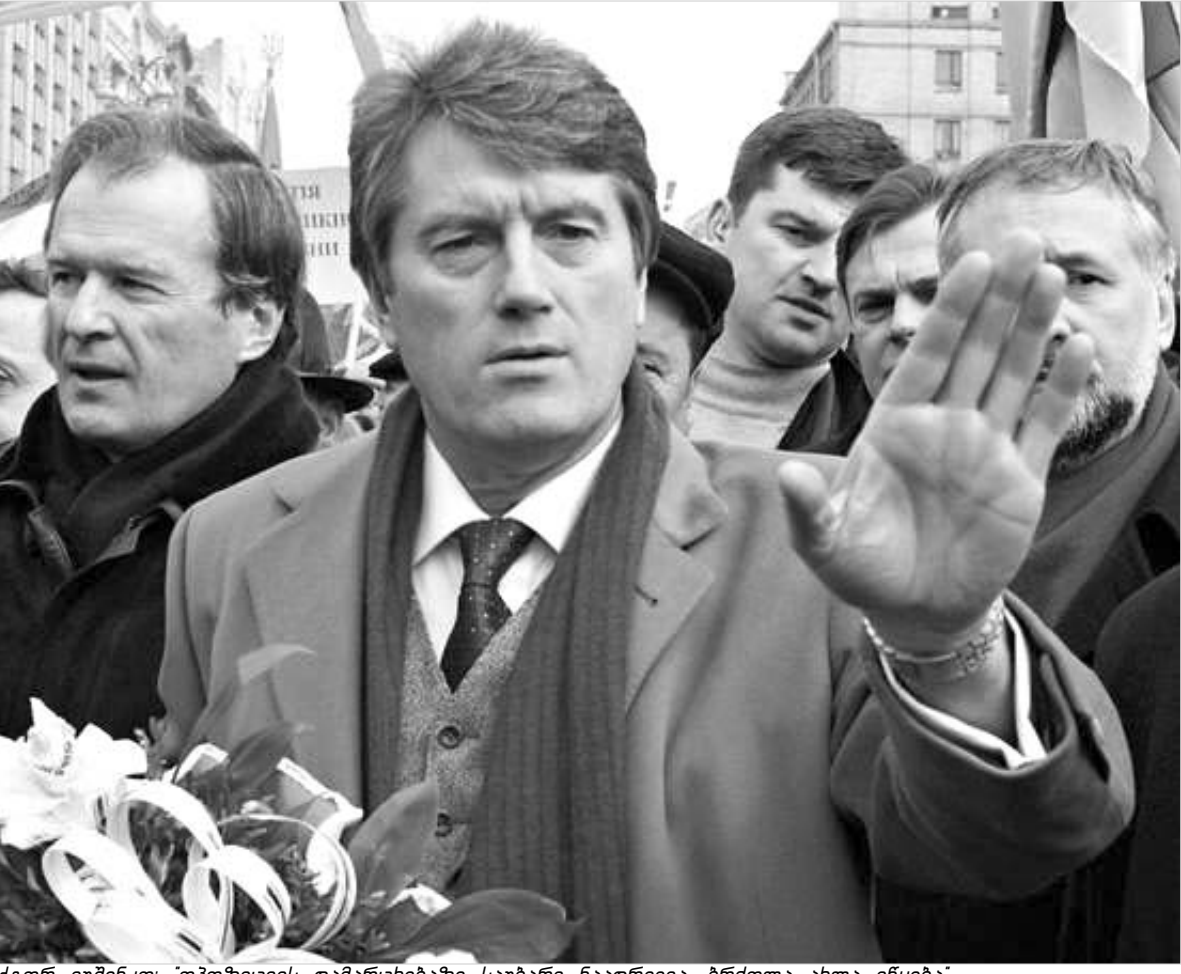
ვიტორ იუშენკო: "ოპოზიციის დამარცხებაზე საუბარი ნაადრევია. ბრძოლა ახლა იწყება".

ვასილი ჯორჯია საქმიანობაზე "24 საათში" ვასილი ჯორჯია უკრაინაში განვითარებული მოვლენები მთელი მსოფლიოს ყურადღების ცენტრში მოექცა. სიტუაცია ძალიან სწრაფად კარგად პარლამენტში სულ რამდენიმე თვის წინ არსებულ ვითარებას. გავრცელებული ინფორმაციით, ვასილი ჯორჯია "ვერზონისა რადამ" პრეზიდენტის არჩევის უფლება (2006 წლის შემდეგ) პარლამენტს გადაულოცა და ამის შედეგად უკრაინულმა ოპოზიციამ ვერ შეძლო. ვითარება უკრაინული ოპოზიციის ერთ-ერთი ლიდერთან, ბლოკ "ნაშ უკრაინას" ხელმძღვანელ ვიტორ იუშენკოსთან ინტერვიუს. ეს გახლავთ პოლიტიკოსი, რომელიც სოციოლოგიურ გამოკვლევებში ბოლო პერიოდში უცვლელად პირველ ადგილზე და პოპულარობის მაჩვენებლით თითქმის ორჯერ უსწრებს მეორე ადგილზე ვასილი ჯორჯიას - პიოტრ სიმონენკოს. ბავაროლოგია A3 ბავაროლოგია