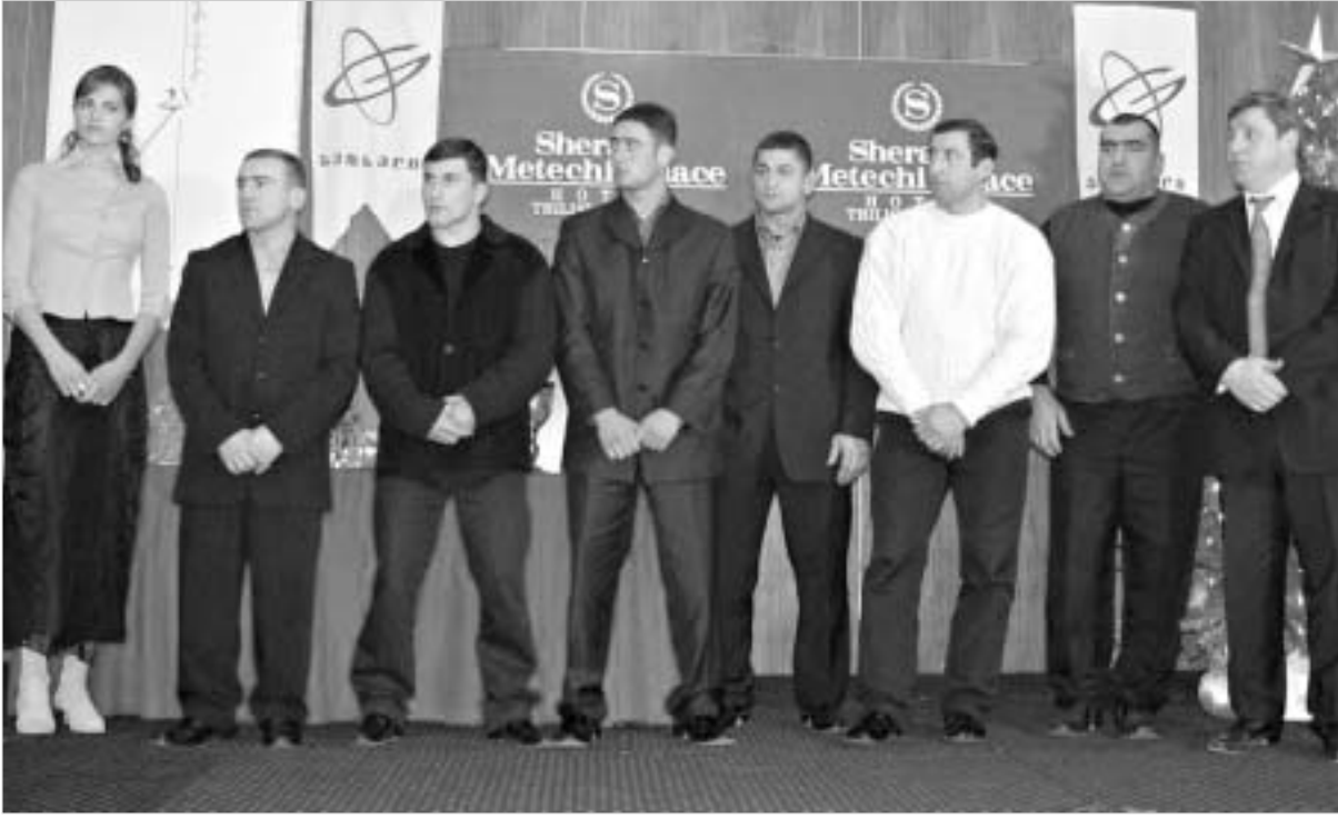
წლის საუკეთესო გუნდს მის საქართველოც უმჯობესდა გვერდს.