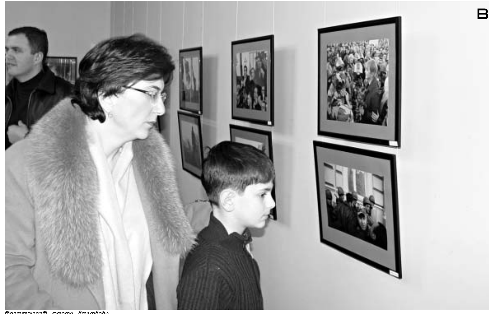
რევოლუციური დღეისა მოგონება.

ცენტრალური საარჩევნო კომისიის თავმჯდომარე ზურაბ ჭი-აბერაშვილი ბათუმში მიემგზავრება. როგორც ჩვენთვის გახდა ცნობილი, მასთან ერთად ბათუმში ჩაველენ ეუთო-ს მისიის წარმომადგენლებიც. სავარაუდოდ, თბილისიდან ჩასულებს აჭარის ავტონომიის ლიდერი ასლან აბაშიძე მიიღებს. ოფიციალური ვერსიით, ზურაბ ჭი-აბერაშვილის ბათუმში ჩასვლის მიზანს ადგილობრივი საარჩევნო ადმინისტრაციისა და ავტონომიური რესპუბლიკის ხელმძღვანელობის წარმომადგენლებთან კონსულტაციების გამართვა წარმოადგენს. ბუნებრივია, ეს შეხვედრები დახურულ კარს მიღმა გაიმართება. თუმცა, ამის მიუხედავად, ხვალ მთავარი საკითხი მაინც გაირკვევა და უკვე ოფიციალურად გამოცხადდება, გაიხსნება თუ არა აჭარის ტერიტორიაზე ოთხ იანვრის საარჩევნო უბნები. ბავაროლოგია A2 ბავაროლოგია