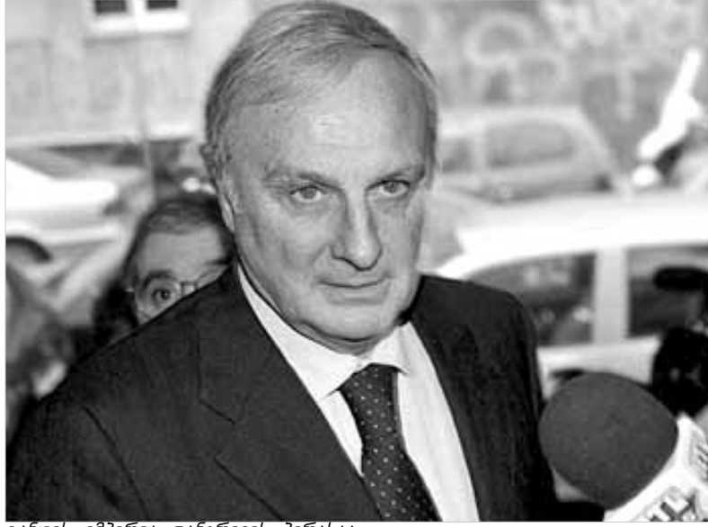
ტანცის იმპერია დანგრევის პირასაა