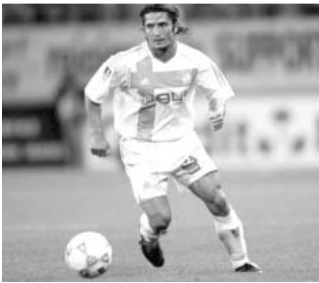
ბიქსენტ ლიზარაზუმ შეიერი იარაღი თუ კოტა გერმანიაში დაბრუნდა.

"ბაიერში" ის შეიდი წლის წინათ, ბილბაოს "ატლეტიკიდან" გადავიდა და მიუნხენურ კლუბში თამაშის პერიოდში მსოფლიოს ერთ-ერთ ყველაზე წარმატებულ ფეხბურთელად იქცა. 169 სანტიმეტრი სიმაღლის, წარმოშობით პასკი ბიქსენტ ლიზარაზუ "ბაიერთან" ერთად 1999, 2000, 2001 და 2003 წლებში ოთხჯერ გახდა გერმანიის ჩემპიონი, 1998, 2000 და 2003 წლებში სამჯერ დაუფლა გერმანიის თასს, ხოლო 2001 წელს ჯერ ჩემპიონთა ლიგის გამარჯვებული გახდა, შემდეგ კი საკონტინენტთაშორისო თასს დაუფლა. 1997 წლიდან 2004 წლამდე ზუნდსლიგაში მან 152 მატჩი ჩაატარა და შეიდი გოლი გაიტანა. "ბაიერის" შემადგენლობაში თავისი უკანასკნელი შეხვედრა ამჟამად უკვე 35 წლის ლიზარაზუმ, გასული წლის 22