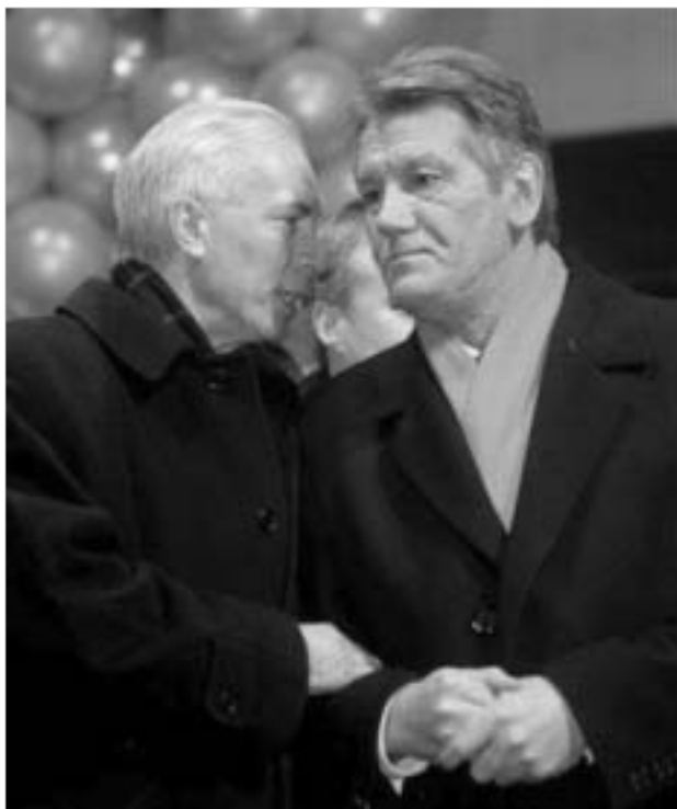
მიქილა აზაროვი და ვიქტორ იუშენკო

უკრაინის პარლამენტმა მინისტრთა კაბინეტს უნდობლობა ჯერ კიდევ დეკემბრის დასაწყისში გამოუცხადა. ბუნებრივია, ამ ფაქტს ინაუკოვიჩის მთავრობის ავტომატურად გადადგომა უნდა მოჰყოლოდა. თუმცა, საპრეზიდენტო მარათონში მონაწილე უკრაინის პრემიერ-მინისტრი დიდი ხნის განმავლობაში თანამდებობის დატოვებაზე უარს აცხადებდა და ერთი შეხედვით ისე ჩანდა, რომ არც მოქმედი პრეზიდენტი ლეონიდ კუჩმა აძალეზდა მას ამ ნაბიჯის გადადგმას. მაგრამ ვიქტორ იანუკოვიჩის გადადგომის შესახებ განცხადების გაკეთება 31 დეკემბერს მაინც მოუწია. როგორც ჩანს, კუჩმა თვის ფაქტობრივ საბოლოოდ შეაქცია ზურგი (ალბათ, გარიგების ერთ-ერთი პირობა ასეთი იყო) და მთავრობის დროებით ხელმძღვანელად პირველი ვიცე-პრემიერი აზაროვი დანიშნა.