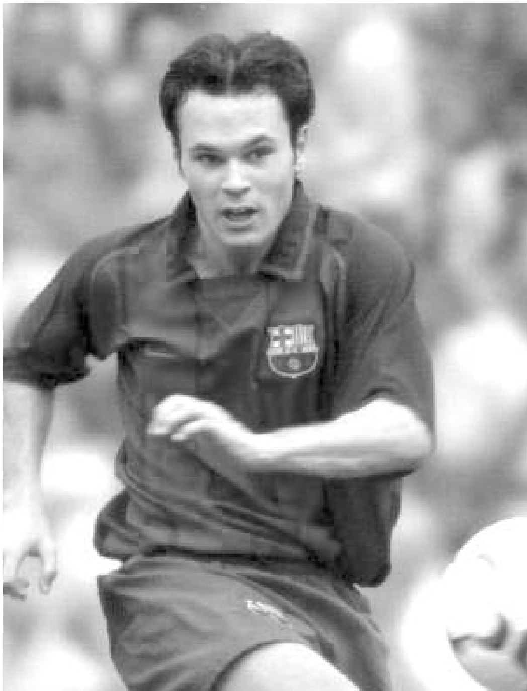
ინესტა ეროვნულ ნაკრებში გამოძახებას ელოდება.

თავად არაგონესმაც აღნიშნა, რომ უახლოეს მომავალში ეროვნული ნაკრების მარჯვენა მცველი რიკი ახალგაზრდა ფეხბურთელები მოირგებენ. "ატლეტიკოს" გარემარბი გაბი ფერნანდესი "ხეტაფეში" იჯარით ყოფნის დროს გაიხსნა. ამ-