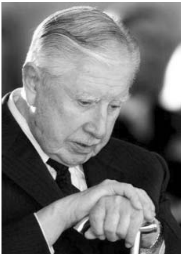
პინოჩეტის სასამართლოს წინაშე წარდგენას დიდი ხანია. ცდილობენ.

ჩილეს უზენაესმა სასამართლომ დაადგინა, რომ ქვეყნის ყოფილი პრეზიდენტი აუგუსტო პინოჩეტი საკმარისად ჯანმრთელია, რათა სასამართლოს წინაშე წარდგეს, ადამიანების მკვლელობისა და გატაცების ბრალდებით. უზენაესმა სასამართლომ მხარი დაუჭირა ქვედა ინსტანციის სასამართლოს გადაწყვეტილებას, რომელმაც არ მიიღო პინოჩეტის ადვოკატების აპელაცია იმის შესახებ, რომ 89 წლის გენერალის ფსიქიკური ჯანმრთელობა მას სასამართლოში დაცვის საშუალებას არ აძლევს. ამგვარად, ჩილეს ყოფილი სამხედრო დიქტატორის სასამართლო უფრო მოახლოვდა. თუმცა პინოჩეტის ადვოკატებს კვლავ გააჩნიათ სასამართლოს დანაშაულის შეჩერების იურიდიული შესაძლებლობა.