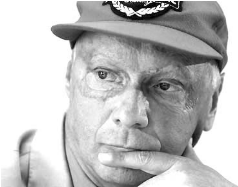
ლაუნდას 2005 წლის სეზონზე საკუთარი შეხედულება აქვს.

- "მიშლანის" მეტი მონაცემები ექნება "შერსედესისგან", BMW, BAR და "ტოიოტასგან". "პრეჯისტოუნს" კი მხო-