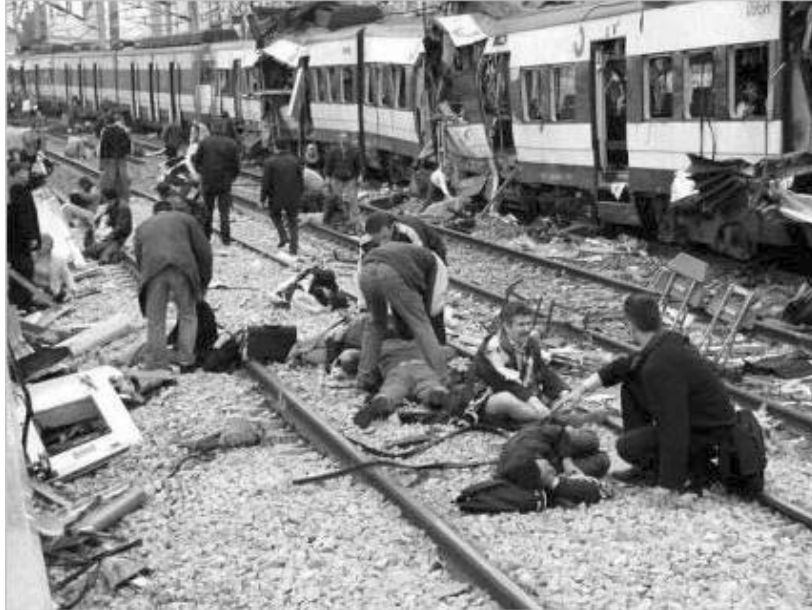
სარკინიგზო ტერაქტი ესპანეთში.