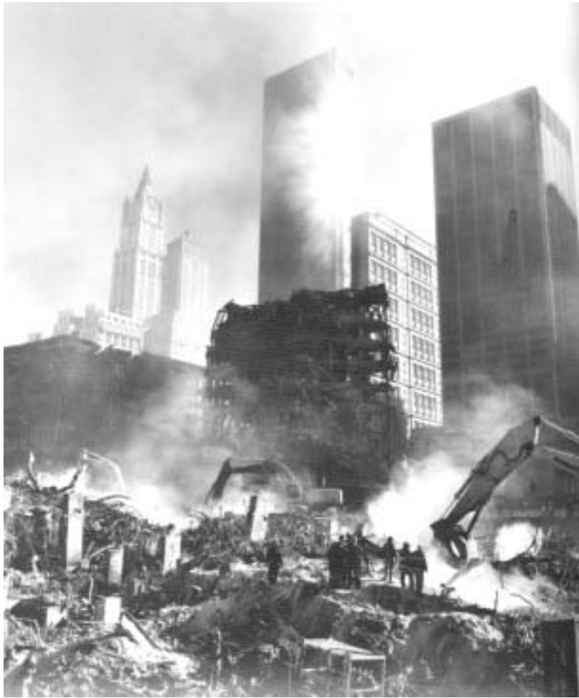
ტერაქტის შედეგის ლიკვიდაცია ნიუ იორკში.

ლი ექსკურსის ჩატარება შორს წაგვიყვანდა, ამიტომ ჩვენ შევხვებით ამ დანაშაულის ცალკეულ მომენტებს და კონკრეტულ მონაცემებს.