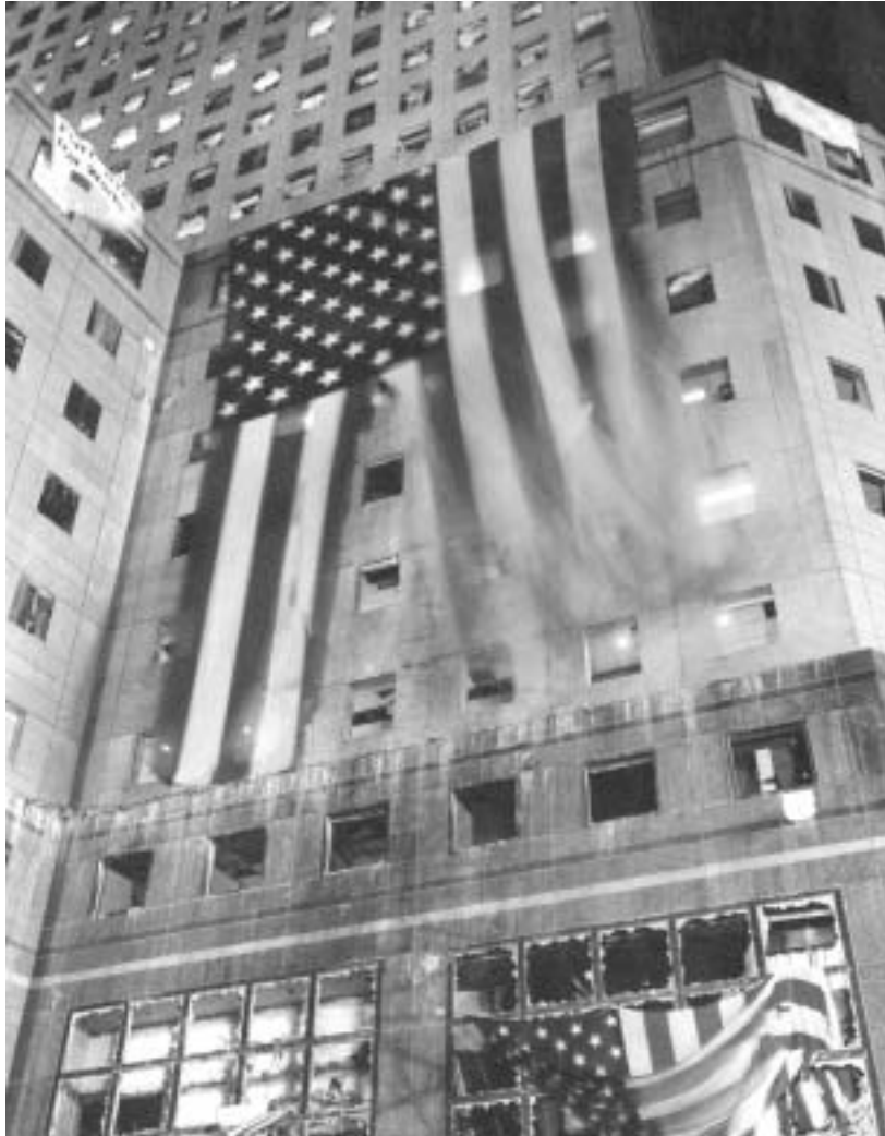
ნიუ იორკი 11. 09. 2001