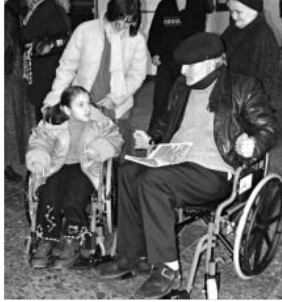
რა კარგია, ბოროტების დატროვება თვითონაც შეიძლება.