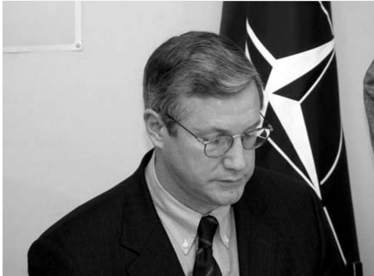
2004 წლის 14 იანვარი. ბრიუს ჯექსონის ვიზიტი თბილისში.

2004 წელი გამორჩეული იყო. როგორც ჩანს, ევროპის ცივი ომის შემდგომი ტრანსფორმაციის უკანასკნელი ეტაპი დადგა. ახალ ევროატლანტიკურ დემოკრატიებს, უკრაინასა და საქართველოს, როგორც არასდროს, მხარდაჭერა სჭირდებათ - აცხადებს თავის წერილში გარდამავალი დემოკრატიების პროექტის პრეზიდენტი, ნატო-ს გაფართოების ერთ-ერთი ინიციატორი, "მისტერ გაფართოებად" წოდებული ბრიუს ჯექსონი.