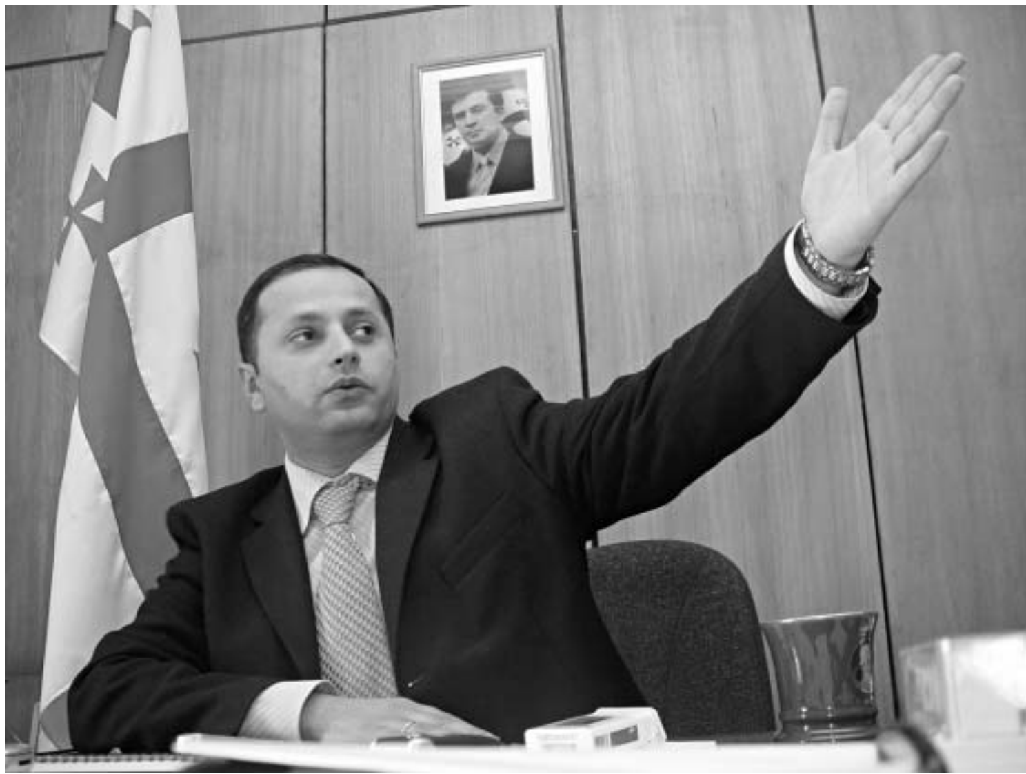
სახელსა და გვარს არ ვეზრდები. ნებისმიერ ადამიანთან ერთად ვაპირებ ნორმალს.

ისინი ჩვენი მოქალაქეები არიან და მათაც ზუსტად ის პრობლემები აწუხებთ, რაც საქართველოს წლებისმეორ სხვა რეგიონში - უმუშევრობა, სიღატაკე, სიღარიბე, მაგრამ ქვემო ქართლს მაინც სპეციფიკურ რეგიონს უწოდებენ. "სპეციფიკურია" შევარდნის დროს ნამდვილად იმას გულისხმობდა, რომ რეგიონი ყოველთვის ხელისუფლების ლაშის ერთდროთი რესურსი იყო არჩვენებში. თუკი მამალაძის ეპოქის მსგავსად ეს მთიცი დაიმსხვრევა, ეს პირდაპირ კავშირში იქნება ხელისუფლებისა და ამ რეგიონის მართლაც განსაკუთრებულად არადემოკრატიულ საარჩევნო ურთიერთობებთან.