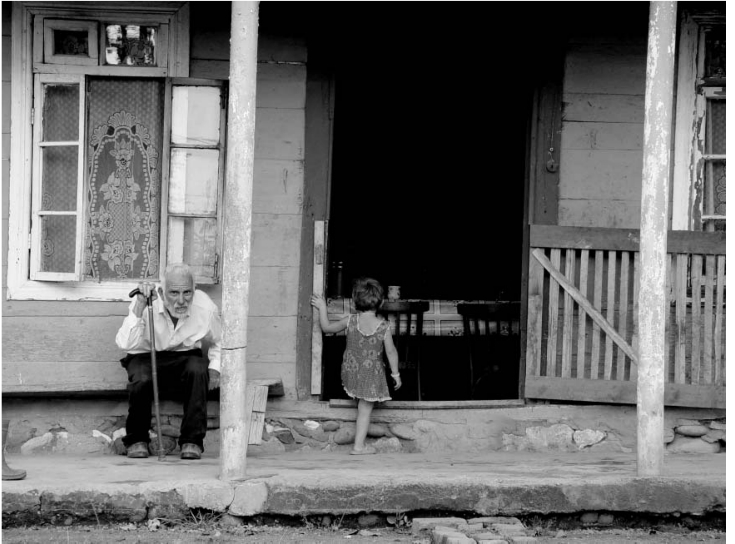
მოსათხრობი 100 წელი.