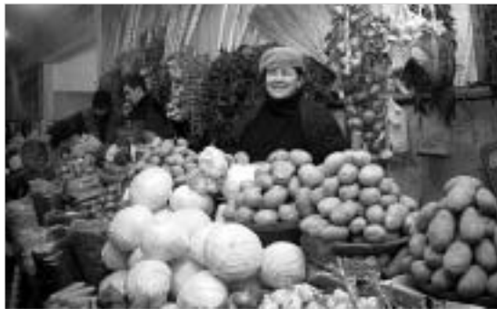
"ბაზრიდან თუ გავალთ, როგორც გავიგეთ, იქ ისეთი რემონტის გაკეთებას აპირებენ, მერე ვინღა დაგვბრუნებს?"