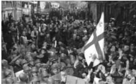
გაგრძელება. დასაწყისი იხ. №4 (864)

სამოქალაქო საზოგადოება და დემოკრატიის კონსოლიდაციის პრობლემები საქართველოში.