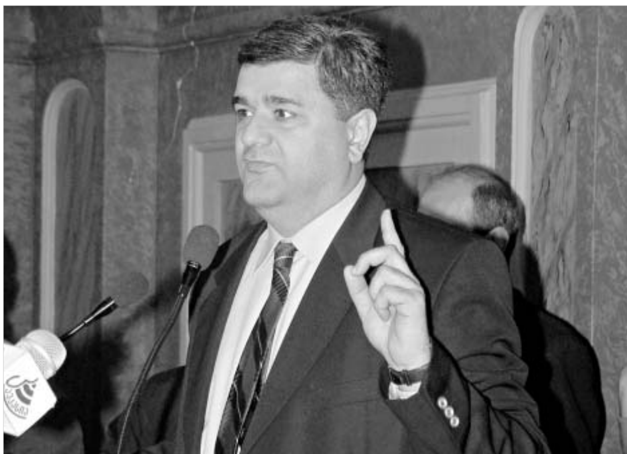
თბილისის საკრებულოს ახალი თავმჯდომარე რევოლუციური წარსულით ამაყობს.