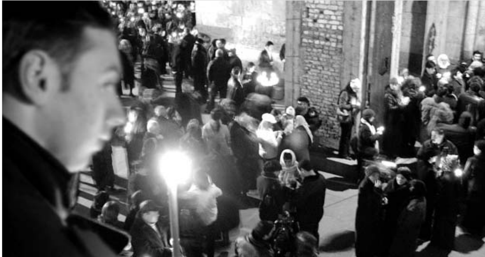
თბილისი, 7 იანვარი, 2004 წ.