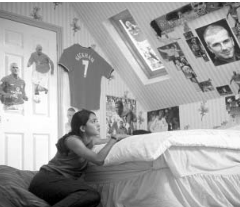
აზიელი გოგონა ფეხბურთელობაზე მუშაობს

საუკეთესო მსახიობის ნომინაციაზე კი წარდგენილი არიან ბიონს ნოულსი, შალი ბერი, კეიმა ქეზლ-პიუსი და ქუინ ლატიფა. რაც შეეხება მამაკაცებს, ამ კატეგორიაში შარშანდელი გამარჯვებული დენზელ ვაშინგტონი ლიდრობს. მის კონკურენციას უწევს კუბა გუდინგი უმცროსი (ფილმისთვის "რაიდი"), ლორენს ფიშბერნი ("მატრიცა რეგულაციები"), სემუელ ელდექსონი (SWAT) და უილ სმიტი ("ცუდი ბიჭები-2"). დაჯილდოების ცერემონიალი მარტში, ლოს ანჯელესში გაიმართება.