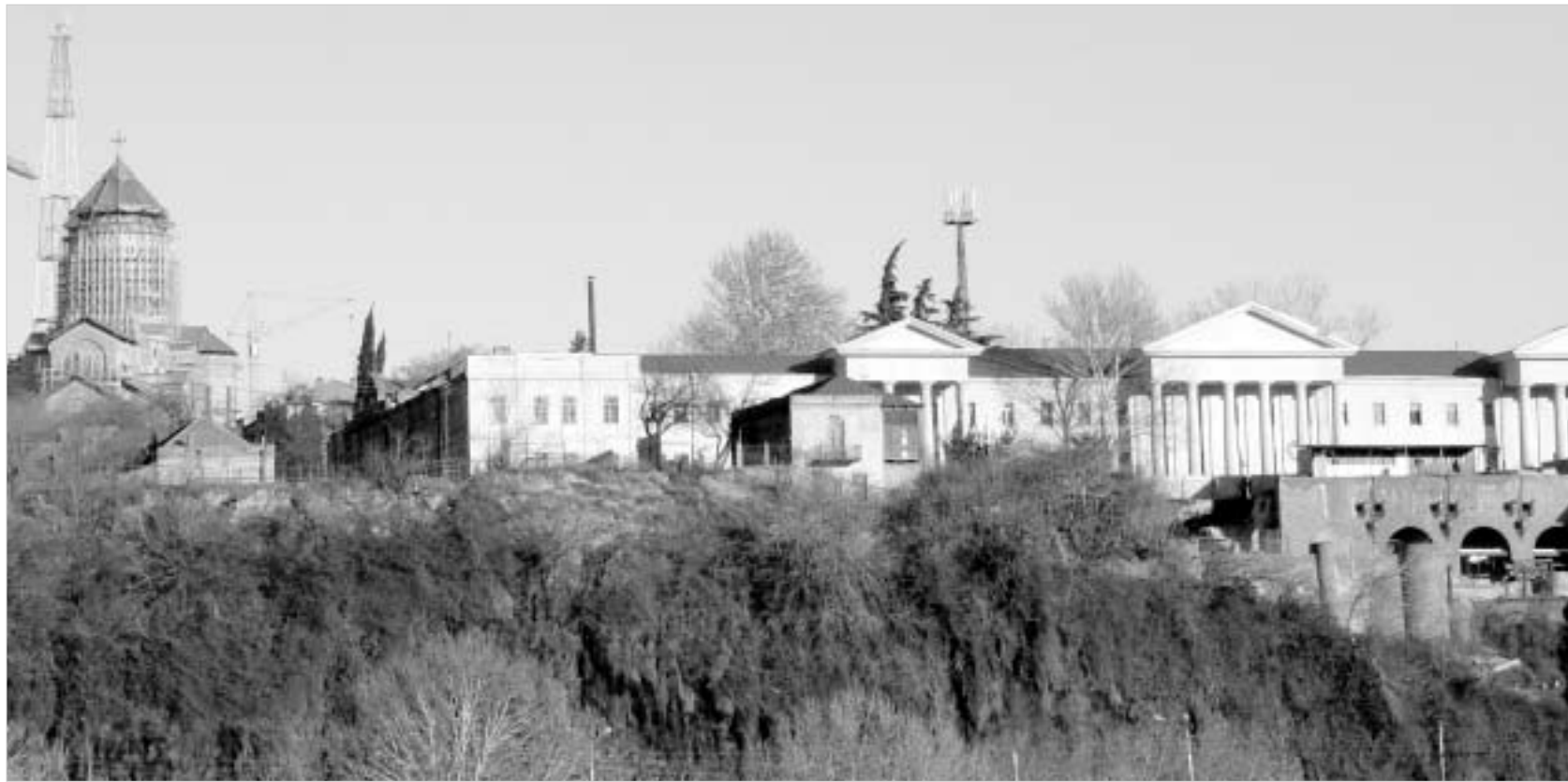
დღეს საგზაო პოლიციის შენობა ხედავ - პრეზიდენტის რეზიდენცია.