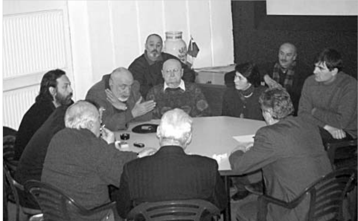
სამოქალაქო დარბაზი პროტესტს უხვადებს აჭარაში რეპრესიების დაწყებას.