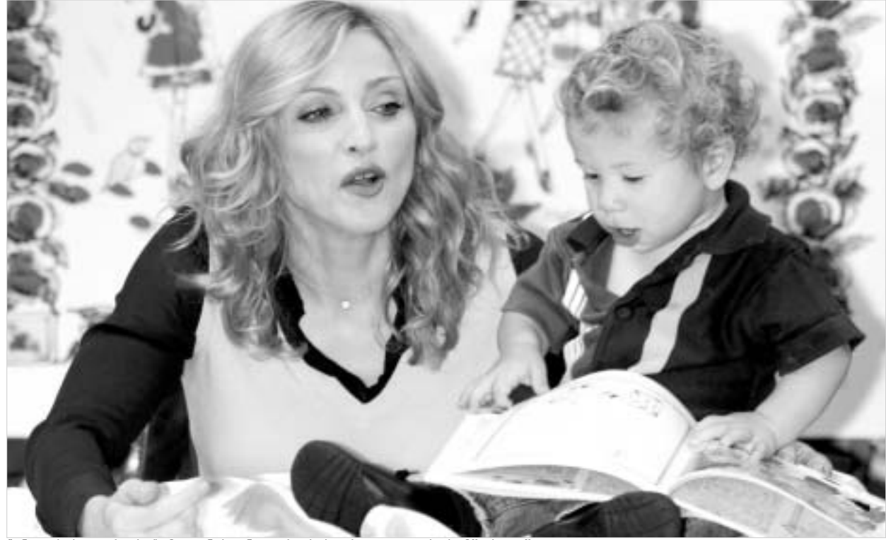
"ინგლისის ვარდები" მადონასგან ვარდების რეკონსტრუქციის სამომბლომ.