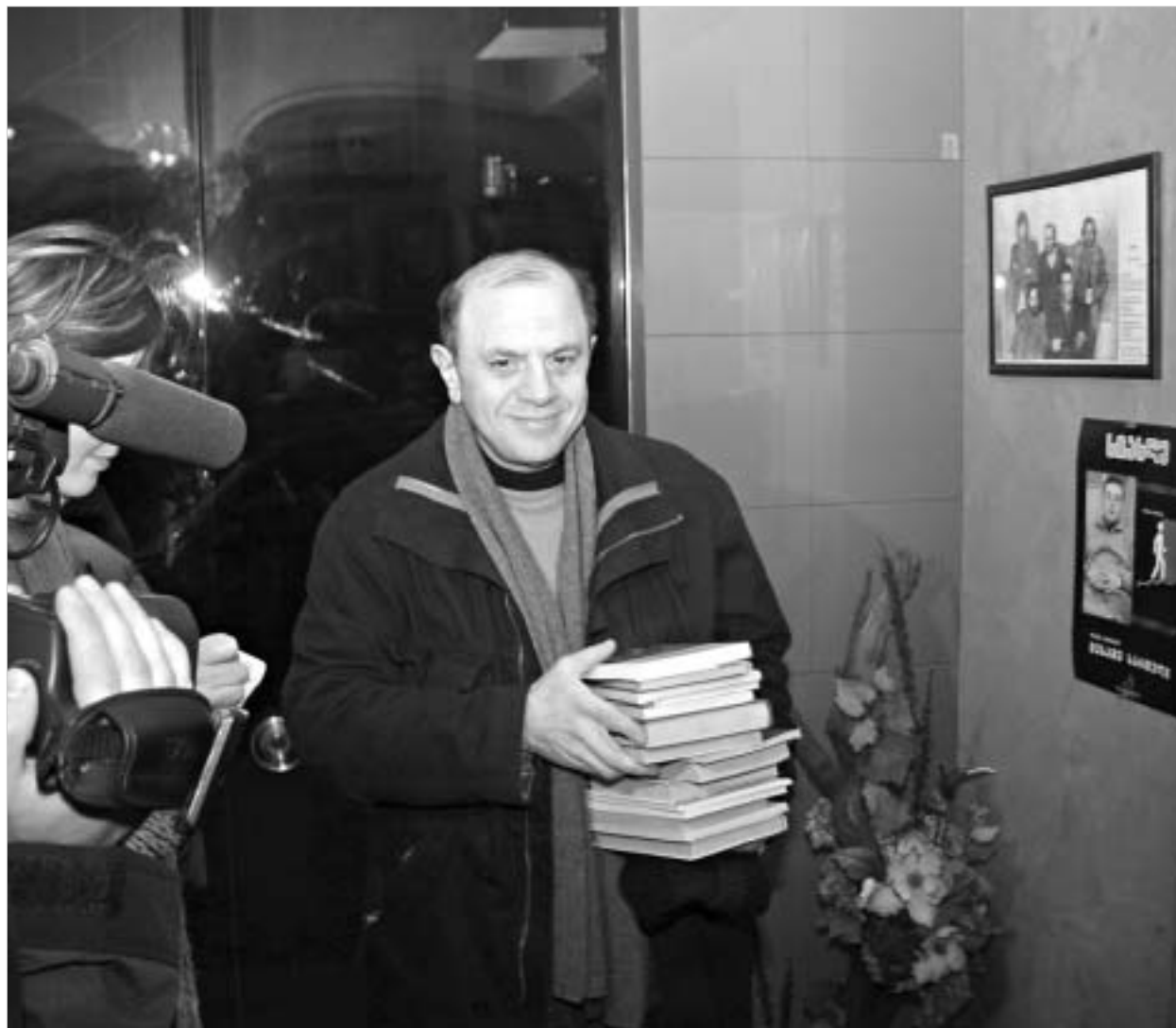
საქართველოს მთავარმა ბიბლიოთეკარმა იცის, თუ რას კითხულობენ პატიმრები.

"პატიმრებს უყვართ იურიდიული ლიტერატურა, დეტექტივები, კლასიკა, განსაკუთრებით - პოეზია. დიდი ინტერესია შემეცნებითი, გამოყენებითი ხასიათის