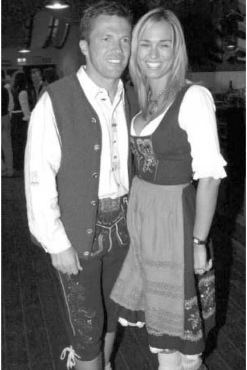
ლოთარ მათეუსი ცხოვრებით ტკბება