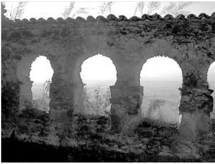
მიდორის ქართული არქივიდან