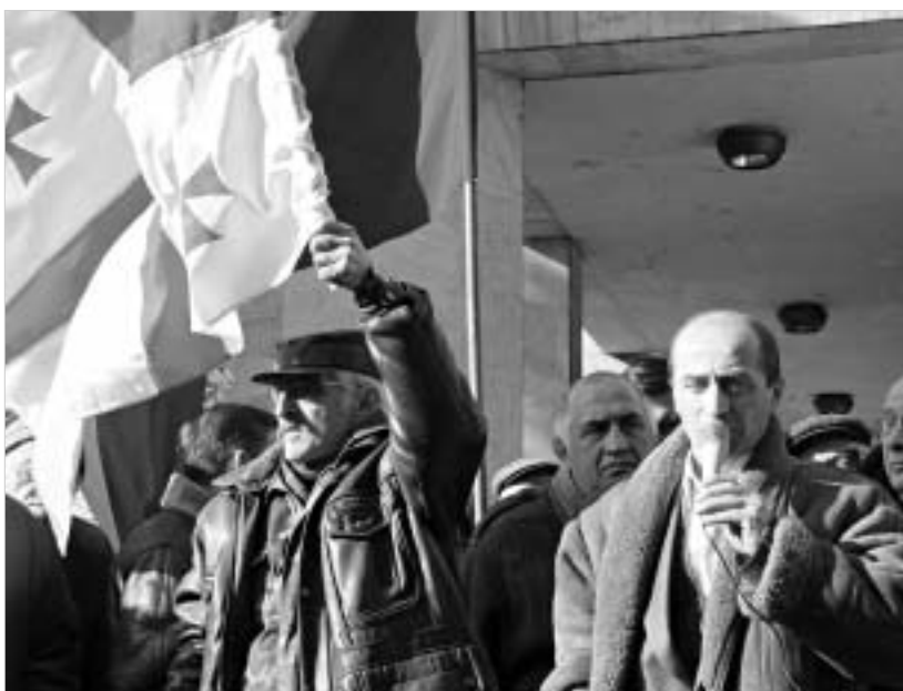
"მიმოზების რევოლუცია" იმელის შენობასთან იწყება.

გუშინ "იმელის" შენობის წინ დევნილთა საპროტესტო აქცია გაიმართა. მისი ორგანიზატორია აფხაზეთის საზოგადოებრივ-პოლიტიკური ორგანიზაციების პოლიტიკური საბჭო. აქციის მონაწილეები ითხოვენ აფხაზეთის უმაღლესი საბჭოს თავმჯდომარის თამაზ ნადარეიშვილის უპირობო გადადგომას, ავტონომიური რესპუბლიკის უმაღლესი საბჭოს არჩევნების ჩატარებას და საქართველოს პარლამენტში წარმოდგენილი აფხაზეთის დეპუტატებისთვის უფლებამოსილების გაგრძელებაზე უარის თქმას.