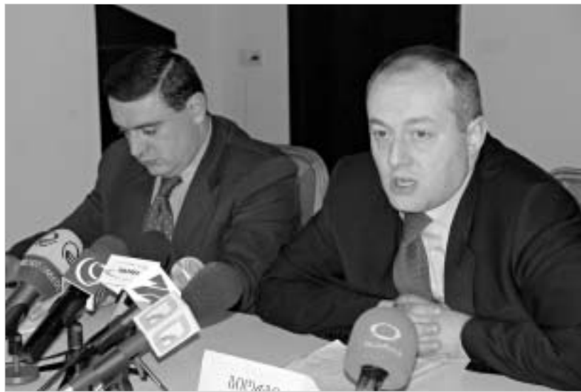
ჩვენს ფოტოებზე პრეზიდენტის სტირდება პარლამენტის კონტროლი.

„ამ ხელისუფლებამ, თავის დროზე, „შოქალაქთა კავშირი“ მუსიკის პანავით მოიყვანა ქვეყნის სათავეში, დღეს კი უნდა, ვარდების სინდრომით“ დამკვიდრდეს“, - ეროვნულ-დემოკრატიული პარტია აცხადებს, რომ ხელისუფლება თავს გავსევენ ნაუცბათე არჩევნებს. ედვ-ს წარმომადგენელთა აზრით, საპარლამენტო არჩევნების ჩატარების ოპტიმალური ვადა მაისის შუა რიცხვებია.