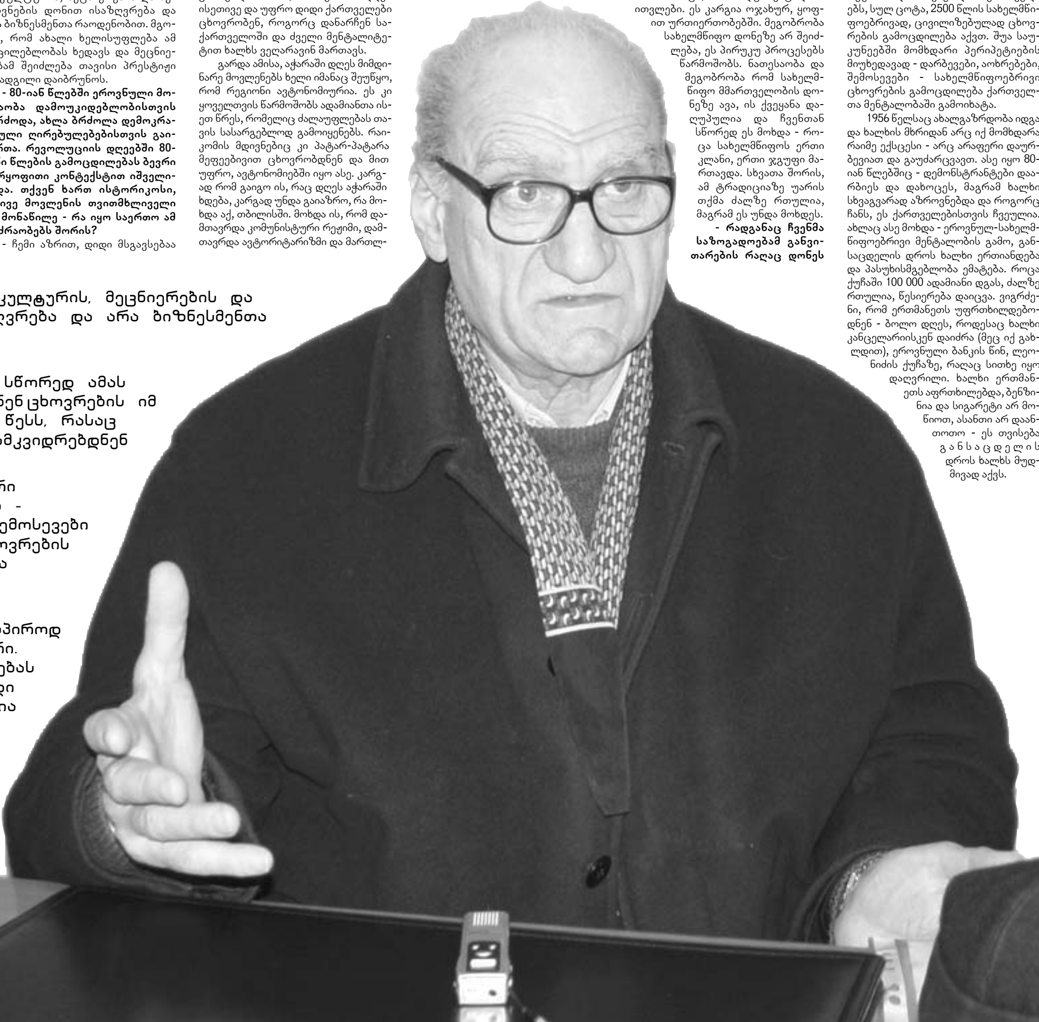
აკადემიკოსი დათუნა მუსხელიშვილი

1956 წელსაც ახალგაზრდობა იდგა და ხალხის მხრიდან არც იქ მომხდარა რამიმ ექსცესს - არც არაფერი დაურღვევია და გაუძარცვია. ასე იყო 80-იან წლებშიც - დემონსტრანტები დაარბიეს და დახოცეს, მაგრამ ხალხი სხვაგვარად აზროვნებდა და როგორც ჩანს, ეს ქართველებისთვის ჩვეულია. ახლაც ასე მოხდა - ეროვნულ-სახელმწიფოებრივი მენტალიტეტის გამო, განსაკუთრებით ხალხი ერთიანდებდა და პასუხისმგებლობა ემატება. როცა ქუჩაში 100 000 ადამიანი დგას, ძალზე რთულია, წესიერება დაიცვა. ვერძენი, რომ ერთმანეთს უფრთხილდებოდნენ - ბოლო დღეს, როდესაც ხალხი კანცელარისკენ დაიძრა (მეც იქ გახლდით), ეროვნული ბანკის წინ, ლეონიდის ქუჩაზე, რაღაც სითხე იყო დაღვრილი. ხალხი ერთმანეთს აფრთხილდებდა, ბუნებრივად სივარული არ მონიოთ, ასანთი არ დაანთოთ - ეს თვისება განსაკუთრებით დროს ხალხს მუდმივად აქვს.