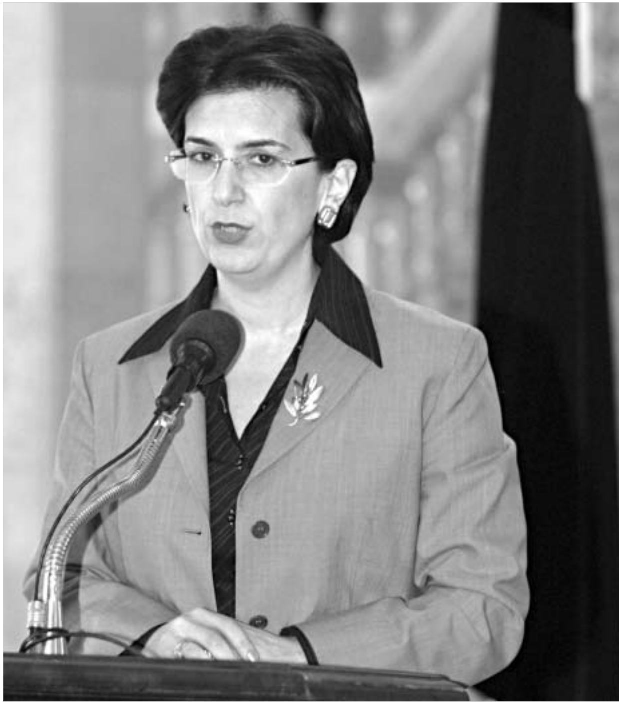
ნინო ბურჯანაძე საპარლამენტო არჩევნების თარიღს ასახელებს.