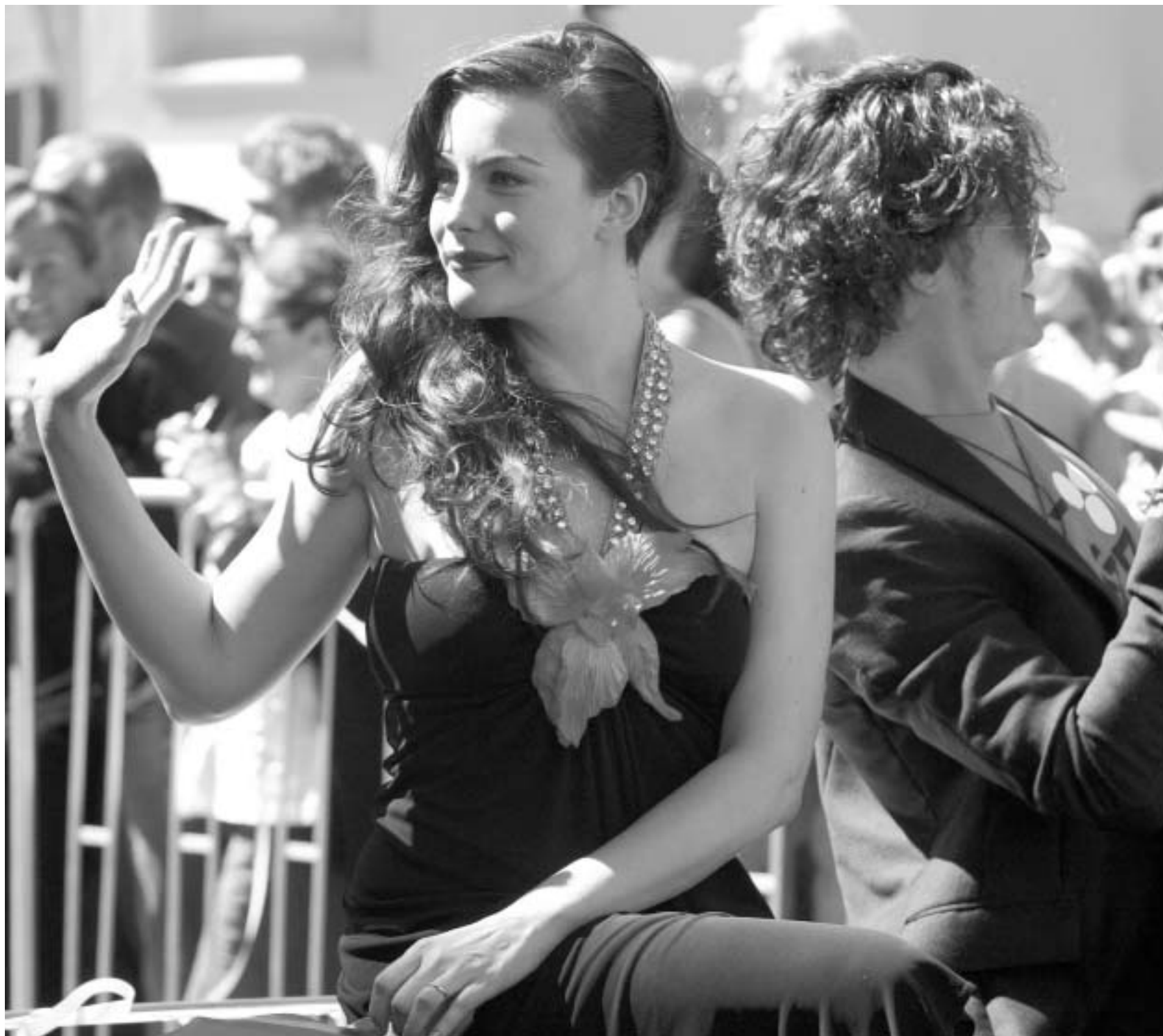
ლივ ტაილერი ფილმის მსოფლიო პრემიერაზე ახალ ზელანდიაში

ამხელა ინტერესი ლონდონის მეცნიერების მუზეუმისკენ, ალბათ, არასდროს ყოფილა მიყრდნობილი. იქ "ბექდების მბრძანებლის" გრანდიოზული გამოფენა მიმდინარეობს, რომელიც შაბათ-კვირას დაიხურება, მაგრამ სტუმრების ცნობისმოყვარეობის სრულად და-