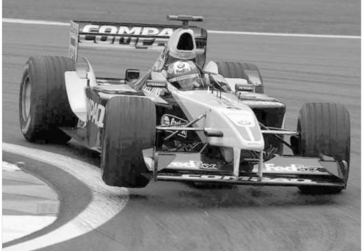
უილიამსის ახალი ბოლიდი საუკეთესოა

რა მოხდება, თუ FW26 მაინც უფრო სწრაფი იქნა, ვიდრე კონკურენტები? "გასულ წლებში 'ფერარი' იყო ყველაზე სწრაფი მანქანა, მაგრამ ამა თუ იმ გრან-პრიზე სხვებიც ხომ ახერხებდნენ გამარჯვებას? ასევე იქნება ახლაც, შესაძლოა, FW26, მართლაც, ყველაზე სწრაფი აღმოჩნდეს, მაგრამ კონკურენტები ამას როგორღაც დააბალანსებენ", - სეცე შტუტის ნააზრევია. საკვარაუდოდ, ახალი FW26, მართლაც, უსწრაფესი იქნება. ისეთი რევოლუციური ცვლილება, როგორც მას აქვს, უდრესად მნიშვნელოვანია. სწორედ ამგვარი წერილობითი იდეებიან უპირატესობას. უცნაუ-