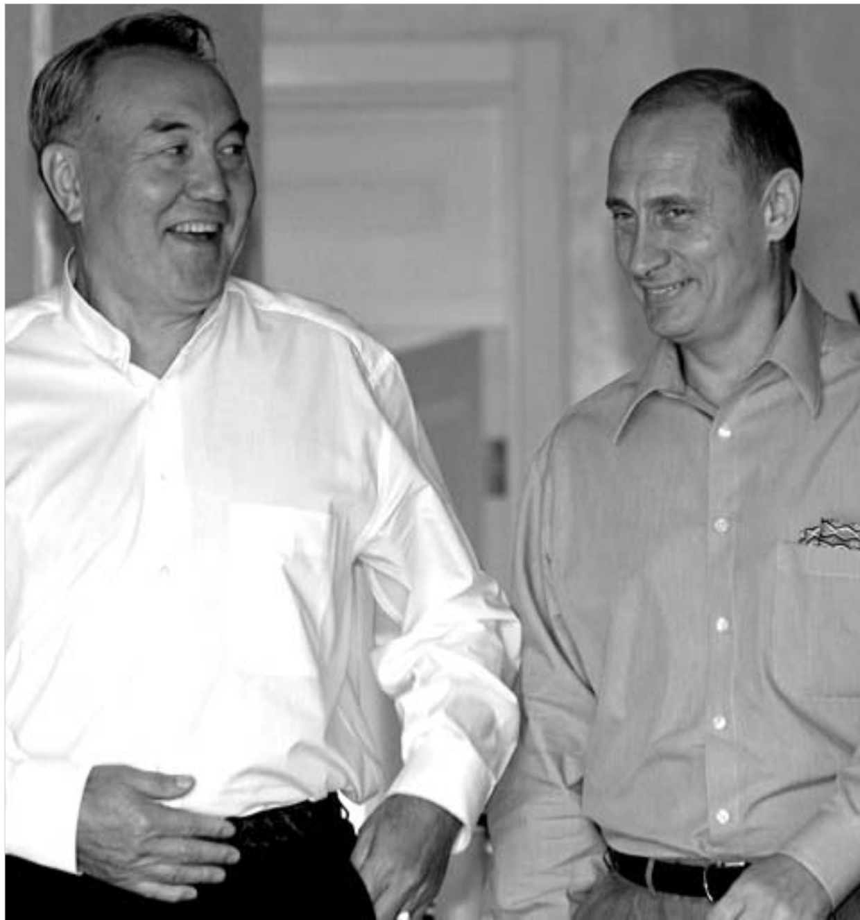
ნურსულთან ნაზარბაევი და ვლადიმერ პუტინი.

კრემლი ასევე ვერ ფარავს თავის გაღიზიანებას ყაზახეთის მიერ აშშ-სთან, დიდ ბრიტანეთთან, ესპანეთთან და თურქეთთან დაწყებული სამხედრო თანამშრომლობის გამო, რაც კასპიის ზღვაზე თანამდებროვე სამხედრო-საზღვაო ბაზის მშენებლობას ითვალისწინებს. ამ მიზნის მისაღწევად 2003 წელს ნატო-ს ქვეყნებმა ყაზახეთს 35 მილიონი ამერიკული