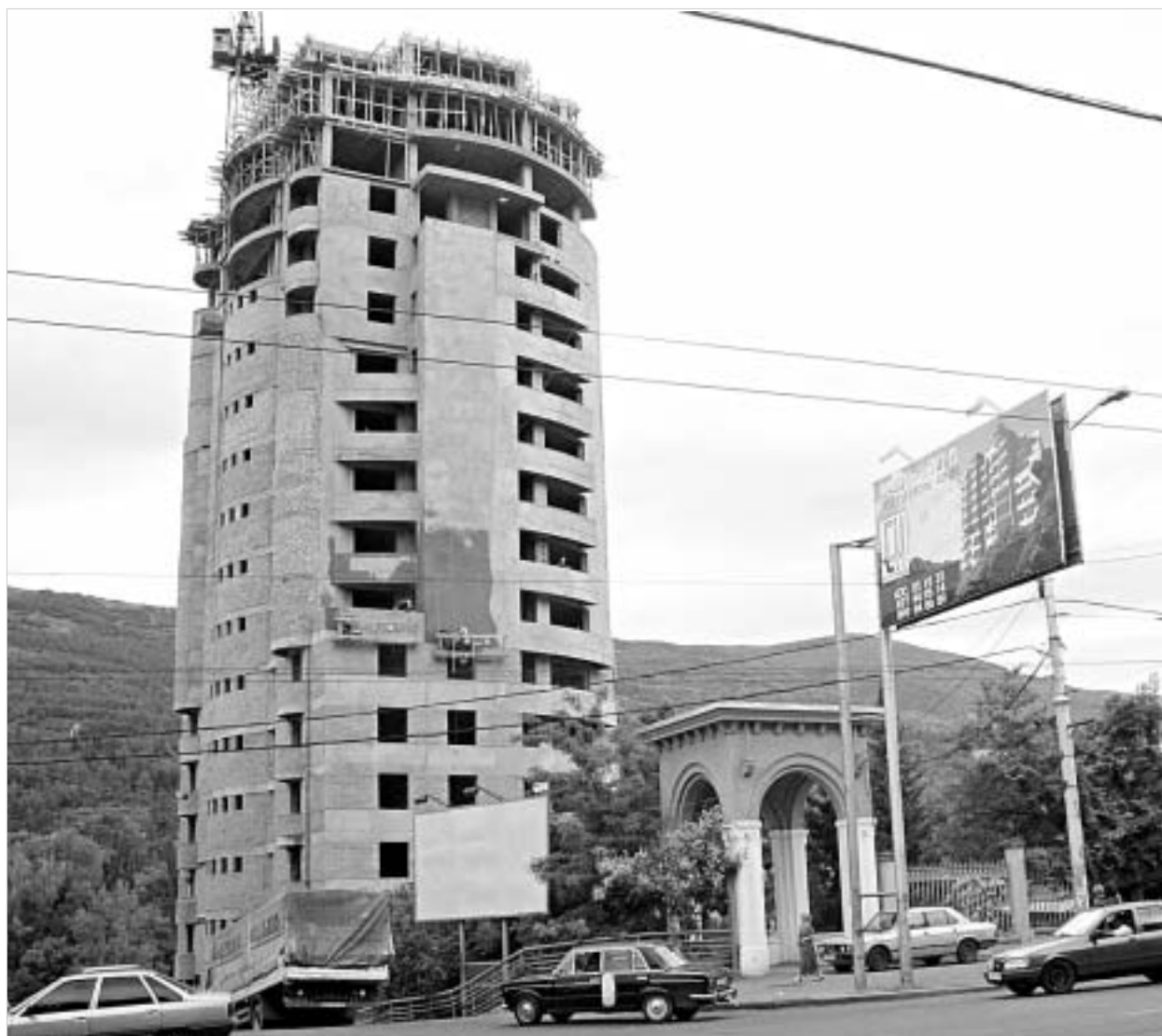
კანონიერი უზნაობა ვაკის პარკში.

"პატიმრი მთა პირველი იყო, ვინც უკანონო მშენებლობების წინააღმდეგ ხმა აიმაღლა. იმედი გვაქვს, რომ ახალი პრეზიდენტი თავის დაწყებულ საქმეს კვლავ გააგრძელებს და ქალაქში შექმნილ ქაოსს ბოლოს მოუღებს", - აცხადებდნენ გუშინ აჭარის წარმომადგენლობაში შეკრებილი არქიტექტორები და "არქიტექტურულ-სამშენებლო საქმიანობაზე სახელმწიფო ზედამხედველობის შესახებ" კანონში შესატან ცვლილებებზე საუბრობდნენ.