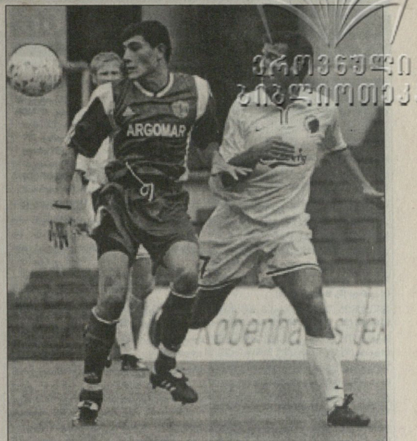
ტორპედოელი ახალკაცი და კოპენჰაგენელი იენსენი