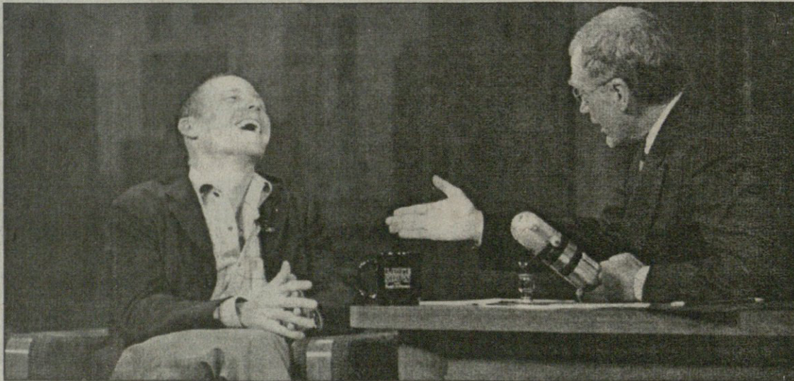
ნიუ იორკიდან

„ტურ დე შრანსის“ ზედიზედ მესამედ მომგები ამერიკელი ველისბედისტი ლენს არმსტრონგი უკვე სამშობლოშია და ამერიკის ერთ-ერთ ყველაზე პოპულარულ ტელეუბოუში პყვება თავისი გამარჯვების ამბავს. ეს გადაცემა სი-ბი-ესის არხზე გადის და „დევიდ ლიტერმანის ღამის შოუ ჰყვია“. შო, მარცხნივ თავად არმსტრონგია, მარჯვნივ კი ლიტერმანი.