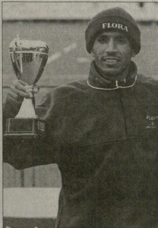
ბოსტონის და ლონდონის მარათონის გამარჯვებულები ლი ბონგ-იუ და აბდელკადერ ელ მუაზიზი დღეს ედმონტონის მსოფლიოს ჩემპიონატს მარათონით დაიწყებენ