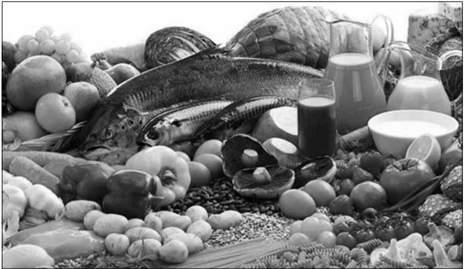
ხელისუფლება გენომოდიფიცირებული ცოცხალი ორგანიზმების შესახებ კანონის მიღებას აჭიანურებს!

მსოფლიო ქვეყნების მეცნიერები დღემდე დავობენ, უქმნის თუ არა საფრთხეს გენომოდიფიცირებული პროდუქტის მიღება ადამიანის ჯანმრთელობას. ამგვარი პროდუქტი ბაზარზე 13 წლის წინ გამოჩნდა, მაგრამ დღემდე ძნელია განისაზღვროს, ხანგრძლივი პერიოდის განმავლობაში, როგორია მათი მოქმედება ადამიანის ორგანიზმზე. ცხოველებზე ჩატარებული ექსპერიმენტების შედეგი კი ასეთია: მომატებული ალერგიული ფონი, იმუნიტეტის რღვევა, გამრავლების ფუნქციის დაკარგვა, ახალშობილთა სიკვდილიანობა, ინსულინის დონის პრობლემები. ამ შედეგებზე დაყრდნობით, AAEM American Academy of Environmental Medicine ურჩევს ექიმებს, არ გამოიყენონ გენომოდიფიცირებული ორგანიზმები (გმო). აკადემიამ გამოაქვეყნა დოკუმენტი, სადაც ამტკიცებს, რომ გენომოდიფიცირებული პროდუქტი მავნეა ჯანმრთელობისთვის და მოუწოდებს მოსახლეობას, თავი შეიკავოს მათი მოხმარებისგან. მსოფლიოში ფართოდ გავრცელებული გენომოდიფიცირებული პროდუქტია: სოიო, სიმინდი, რაფსი, პომიდორი, კარტოფილი, შაქრის ლერწამი... კანონი გენომოდიფიცირებული ცოცხალი ორგანიზმების შესახებ პარლამენტს საშემოდგომო სესიაზე უნდა განეხილა. შედეგად, გენომოდიფიცირებული თესლისა თუ ნერგების საქართველოში შემოტანა აიკრძალებოდა და პროდუქტების მარკირება სავალდებულო გახდებოდა. მწვანეთა პარტიის ლიდერი ბიორბი ბაჩჩილაძე აცხადებს, რომ გმო-ს შესახებ კანონის მიღება მოსახლეობის ჯანმრთელობისა და ქართული სოფლის მეურნეობის ენდემური ჯიშების გადასარჩენად აუცილებელია.