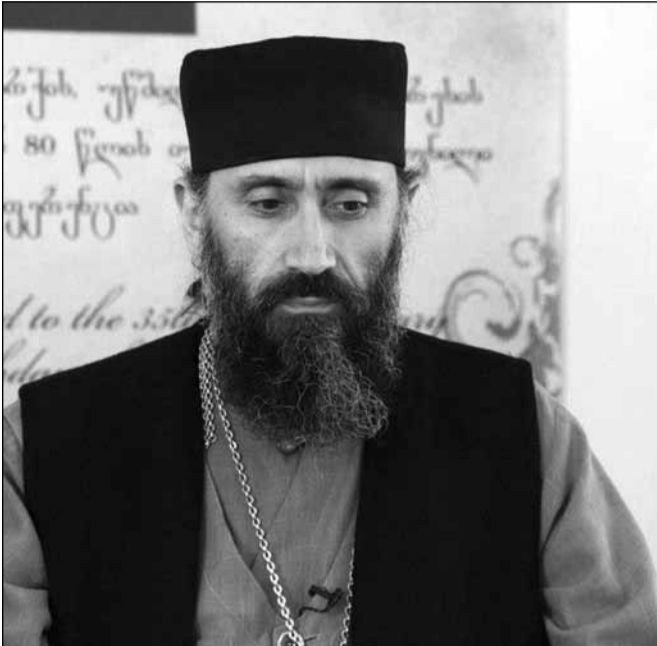
სიერი აღმოჩენილიყო. დღეს სწორედ ამის შედეგებს ვიმკით.

მაშინ ღირსეული ადამიანი მღვდელი ვერ გახდებოდა ან 50 შემთხვევიდან, შესაძლოა, 2-3 სასულიერო პირი კეთილსინდისიანი იქნებოდა.