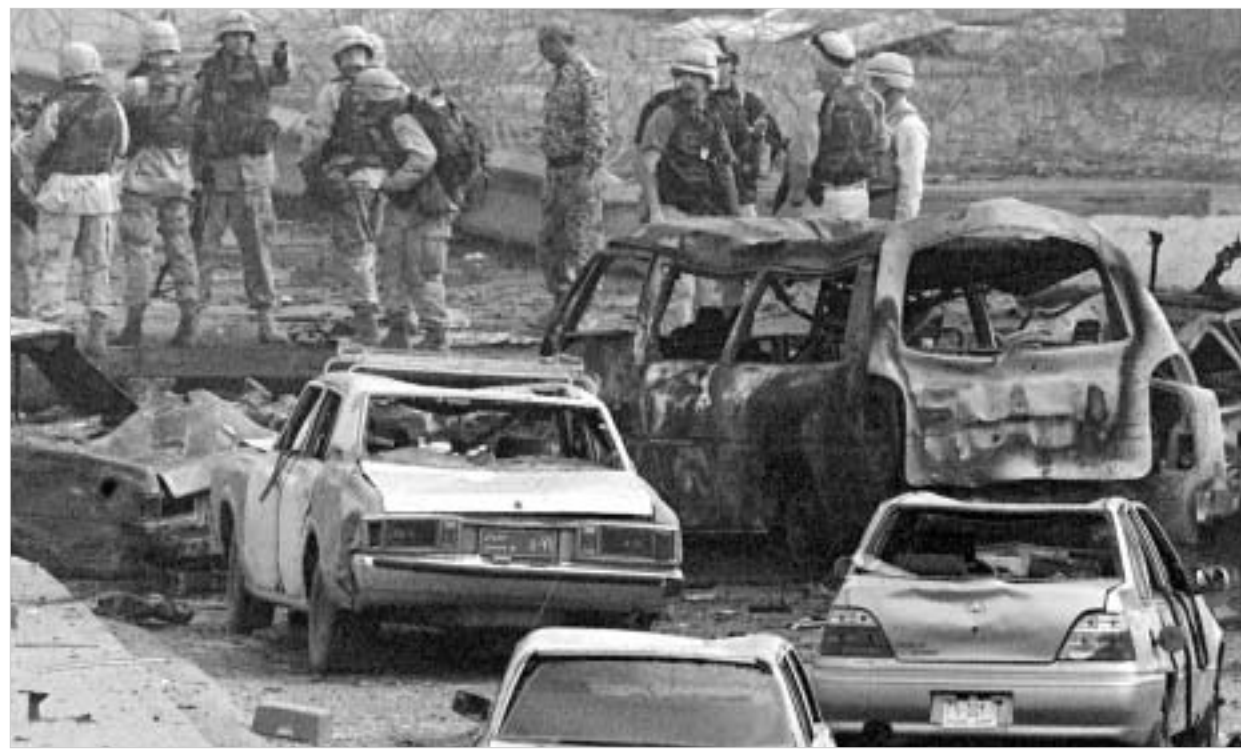
კამიკაძე-ტერორისტმა ასაფეთქებელი მოწყობილობა აშშ-ს მთავარი სამხედრო შტაბ-ბინის წინ ამოქმედდა.

გუშინ, ერაყის დედაქალაქ ბაღდადში, აშშ-ს მთავარი სამხედრო შტაბ-ბინის წინ უძლიერესი აფეთქება მოხდა. ბაზის შესასვლელთან მანქანაში მჯდომმა დაუდგენელმა კამიკაძე-ტერორისტმა ასაფეთქებელი მოწყობილობა ამოქმედდა, რის შედეგადაც, სულ ცოტა, 20 ადამიანი დაიღუპა და 60-ზე მეტი დაიჭრა. თუმცა, მსხვერპლი შესაძლოა კიდევ გაიზარდოს. ერაყის დედაქალაქის ცენტრში ტრაგედია იმ დროს დატრიალდა, როდესაც ნიუ-იორკში გაეროს-ს გენერალურ მდივანთან კოფი ანანთან შეხვედრისათვის ერაყის მმართველი საბჭოს წევრები გასამგზავრებლად ემზადებოდნენ. ეს შეხვედრა დღეისათვის არის დაგეგმილი და მასში მონაწილეობას აშშ-ს და დიდი ბრიტანეთის ოფიციალური წარმომადგენლებიც მიიღებენ. მათ ერაყის მომავალი მოწყობის საკითხები უნდა განიხილონ.