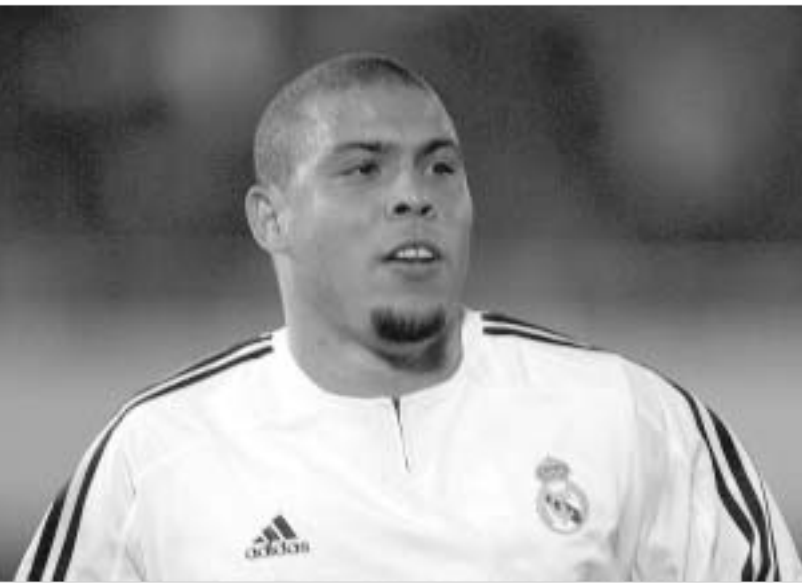
რონალდო რიოს წლევანდელ კარნავალზე არ გაემგზავრება