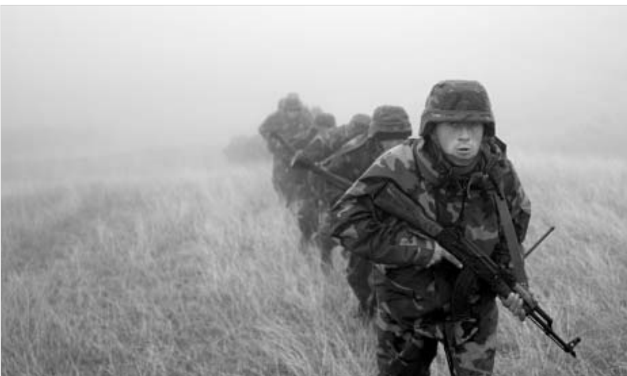
წვრთნისა და აღჭურვის პროგრამით 2000-მდე პროფესიონალი სამხედრო მომზადდა.

„ჯარისკაცი, პირველ რიგში, დისციპლინირებული უნდა იყოს. რაც ჯარს მოეთხოვება, ეს დისციპლინაა. მე რასაც ვაკვირდები, ეს უკვე მეხუთე ფაზაა ჩვენი ჩამოყალიბების და დისციპლინაც უკეთესია და, საერთ-