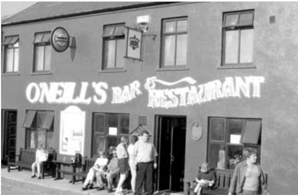
ფაბი O'Neill's ლონდონში.