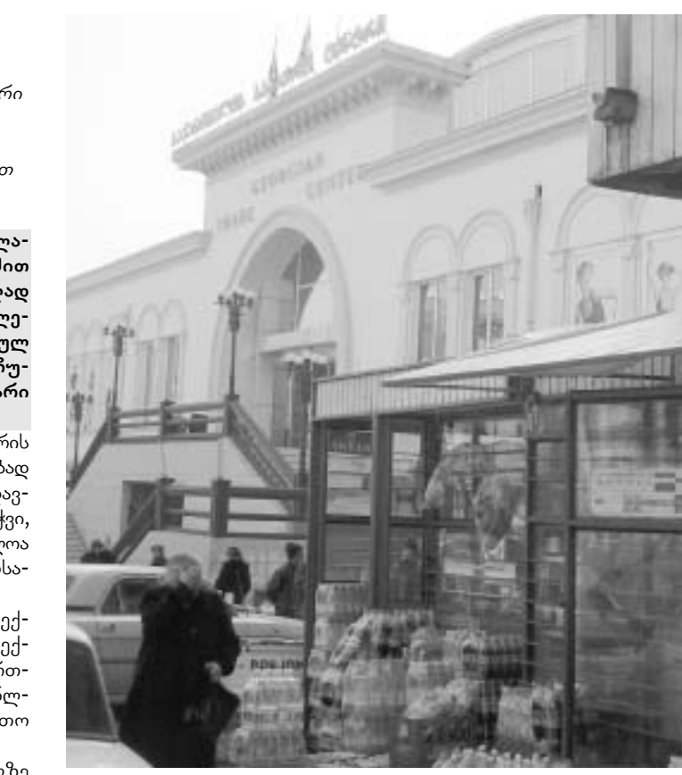
ეს სქემა თავისი შინაარსით ბევრად უფრო რთულია, მაგრამ საბოლოო ანგარიშით ცაცხვებით უფრო ეფექტიანი შეიძლება გამოდგეს. ვიდრე ნებისმიერი სხვა. კერძოდ, სავაჭრო ცენტრი ფართს შესავალზე თანად პროდუქციის მწარმოებელს ანუ პროდუქციის შექმნა უშუალოდ ე.წ. პირველი ხელიდან მოხდება. ეს კი, პროდუქციის ხარისხზე უშუალო პასუხისმგებლის ცოდნის გარდა, არც მეტი, არც ნაკლები, პროდუქციის ფასის შემცირებასაც გულისხმობს. ვინაიდან თამაშად რჩება ვაჭრობის პროცესში მოუშორებელ ჭირად ქცეული ერთეული - გადაწყვეტილი, რომელთა ოდენობაც ზოგიერთ პროდუქტზე რამდენიმეს აღწევს.

ცხადია, ყველა იმ ადამიანისთვის, ვისთვისაც დახურული ბაზარი აგრარული პროდუქტის შექმნის ერთადერთი თუ არა, ერთ-ერთი ყველაზე ხშირი წერტილია, კითხვა, ხომ არ ნიშნავს ეს ფაქტი მა-