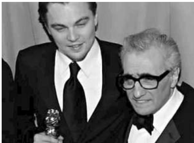
ლეონარდო დი კაპრიო და მარტინ სკორსეზე

საბოლოოდ, „პირისპირ“ ორი ჯილდოს პირისპირ დარჩა. ერთი ერგო როგორც საუკეთესო კომედიას, მეორე კი ალექსანდერ პეინმა და ჯემ ტვილორმა დაიმსახურა.