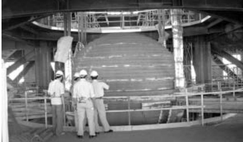
ტაიპეი 101-ის კანქარის ბირთვი

“ტაიპეი 101” მსოფლიოში უსწრაფესი ლიფტებითაა აღჭურვილი. ზვეით მოძრაობისას, მათი სიჩქარე 60 კმ/სთ-ს აღწევს, ქვევით მოძრაობისას კი - 36 კმ/სთ-ს. ამასთან, ისინი აეროდინამიკური ფორმისაა, არიან და ორი სართული აქვთ. ორსართულიანი ლიფტები რაღაც საჭიროაო, იკითხავთ. რა და, ასე ნაკლები შახტა საჭირო, რითაც იზოგება შენობის სასარგებლო ფართობი. ორსართულიანი ლიფტები ერთი სართული მხოლოდ კენტი სართულზე ჩერდება, მეორე კი - ლუნზე. ამ ლიფტების წყალობით, ადამიანი 89-ე სართულზე მდებარე სათვალავო ბაქანს სულ რაღაც 40 წამში მიაღწევს.