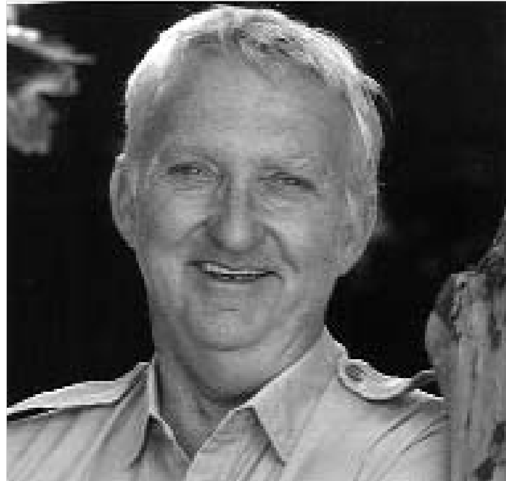
"ანთემი". ეს არის არა მარტო ჩემი წინასწარმეტყველება არამედ შეგრძნება მილიონი ადამიანისა საქართველოში.

- ყველაზე მნიშვნელოვანი, ალბათ, ფულბრაიტის პრემია იყო, რომელმაც ჩემი ცხოვრება შეცვალა. როდესაც ვიქტორიას კოლეჯის დეკანი ვიყავი, მსოფლიოს სკოლების მონახულები-