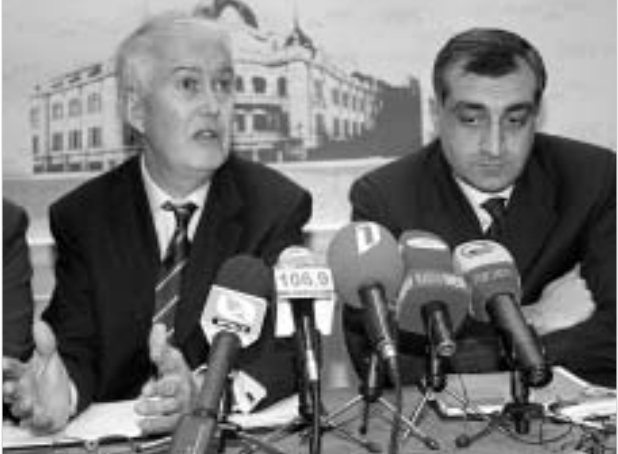
IFC-ის სუბორდინირებული სესხის მოკულობა ოთხი მთლიანი აშშ დოლარია და იგი თიბისი ბანკის მთლიანი კაპიტალის ზრდის მიზნით გამოიყენება.

საერთაშორისო საფინანსო კორპორაცია (IFC) "თიბისი ბანკისათვის" სუბორდინირებულ სესხს გამოყოფს, რომლის ინვესტირებაც "თიბისი ბანკის" კაპიტალში განხორციელდება. ეს საქართველოში კომერციული ბანკისათვის საერთაშორისო ინსტიტუტის მიერ სუბორდინირებული სესხის გამოყოფის პირველი პრეცედენტი იქნება.