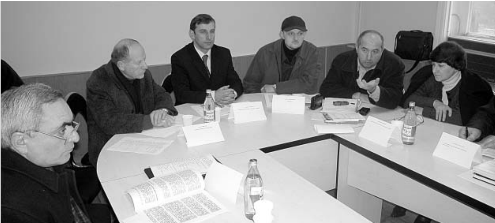
აფხაზეთის საკითხზე ერთ-ერთი კონცეფციის განხილვისას.

კავკასია უფრო და უფრო ხდება მსოფლიო პოლიტიკის მნიშვნელოვანი და ანგარიშგასაწევი ღერძი. ვინც ფლობს კავკასიას, ის ინარჩუნებს გავლენას ახლო აღმოსავლეთზეც. ამიტომ ევროპა დასავლეთით ერთად მხარს უჭერს "კავკასიური პაქტის" იდეას, რომელიც გულისხმობს რეგი-