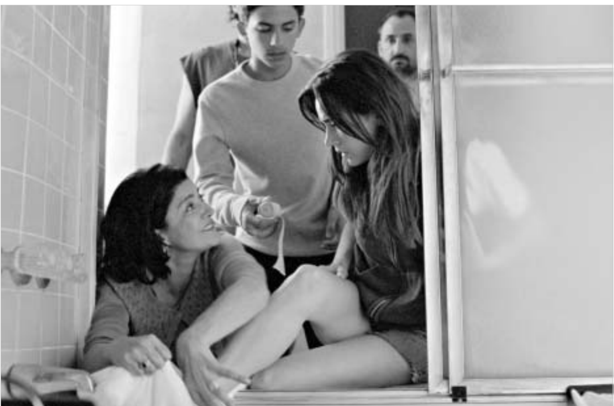
კადრი ფილმიდან "ქვიშისა და ყინულის სახლი".

ამერიკის კინოხელოვნების კინოაკადემიაში, რომლის პრეროგატივაა ყოველწლიურად სახელგანთქმულ "ოსკარების" გაცემა, ახალი სკანდალი ღვივდება. მაშინ, როდესაც მერიკა ხელწართულ ბრძოლას უცხადებს აუდიო-ვიდეო პროდუქციის არალეგალურ მწარმოებლებს, ამერიკის კინოაკადემიის წევრებს ვიდეო-მეკობრეებთან ალიანსში ადანაშაულებენ.