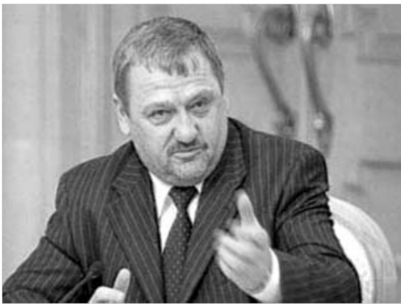
კადიროვი ჩეჩნეთში საპრეზიდენტო მმართველობის განმტკიცებას აპირებს.

პრესკონფერენციაზე კადიროვმა სხვა საკითხებზეც ისაუბრა. მან განაცხადა, რომ მომავალშიც გააგრძელებს ჩეჩნეთში საპრეზიდენტო მმართველობის განმტკიცების პოლიტიკას და მის მთავარ დასაყრდენს მისივე ინციატივით შექმნილი სახელმწიფო საბჭო წარმოადგენს. რაც შეეხება ხელისუფლების სხვა ორგანოებს, მაგალითად, როგორცაა პარლამენტი, მისი ბედი, რაღა თქმა უნდა, კადიროვს არ აინტერესებს. “ჩვენ მათთვის დასავლეთში ადგილიც კი არ გვაქვს. თუკი დეპუტატებს ავირჩევთ, ისინი საქაღალდეებით ხელში ქუჩა-ქუჩა ივლიან. ამიტომ, პირველ რიგში,