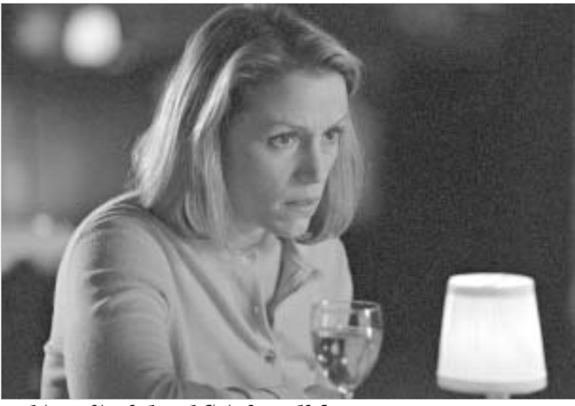
ფიურის თავმჯდომარე ფრენსის მაკდორმანდი.

"ოსკარი" ხედება "ოქროს დათვს" - კინომოყვარულებს, რომლებიც ხშირ-ხშირად ამონებენ ბერლინის კინოფესტივალის ინტერნეტ-საიტს, ეს სათაური შეუმჩნეველი არ დარჩებოდათ. ამ "დასოფრულ" ახალ ამბავში ფესტივალის ორგანიზატორები გულისხმობენ იმას, რომ ფიურის თავმჯდომარეა ფრენსის მაკდორმანდი "ოსკარის" მფლობელი ფილმისთვის "ფარგო". მეტიც, რადგანაც "ფარგო" არაპოლიფუფური ნაწარმოებია, მაკდორმანდი და მოუკიდებელი კინოს ერთ-ერთი მთავარი კერპიც გახლავთ. მაკდორმანდი უხელმძღვანელებს ფიურის, რომლის წევრებს შორისაც გახლავთ ცნობილი ირანელი სახე სამირა მაკმალაფი, იტალიელი მსახიობი ვალერია ბრუნი ტედეში, პროდიუსერი პიტერ რომელი და რეჟისორები: 1992 წელს "ოსკარით" დაჯილდოებული იტალიელი გაბრიელე სალვატორესი, ამერიკელი დენ ტალ-