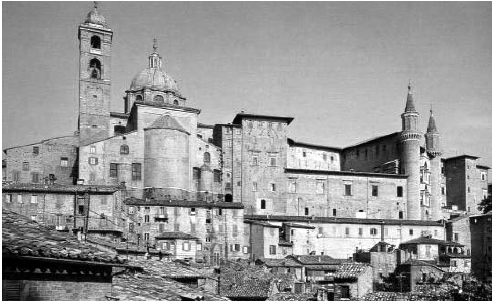
ურბინოს ჰერცოგის სისახლე

ერთ-ერთი ყველაზე ბრწყინვალე საჰერცოგო კარი მხატვარ რაფაელის მშობლიურ ქალაქში, ურბინოში იყო განლაგებული. ურბინოში, XIII საუკუნეიდან მოყოლებული, მონტეფელტროთა საგვარეულო ბატონობდა, სიმდიდრითა და შეიარაღებით განთქმული. ურბინოს ჰერცოგებს არასოდეს ჰქონდათ საკუთარი ჯარი, მაგრამ არასოდეს კარგავდნენ შემთხვევას, სათანადო გასამრჯელოს ფასად ვინმესთვის შეეთავაზებინათ თავიანთი სამსახური, ამიტომაც დიდ სარდალთა სახელიც მოიხვეჭეს.