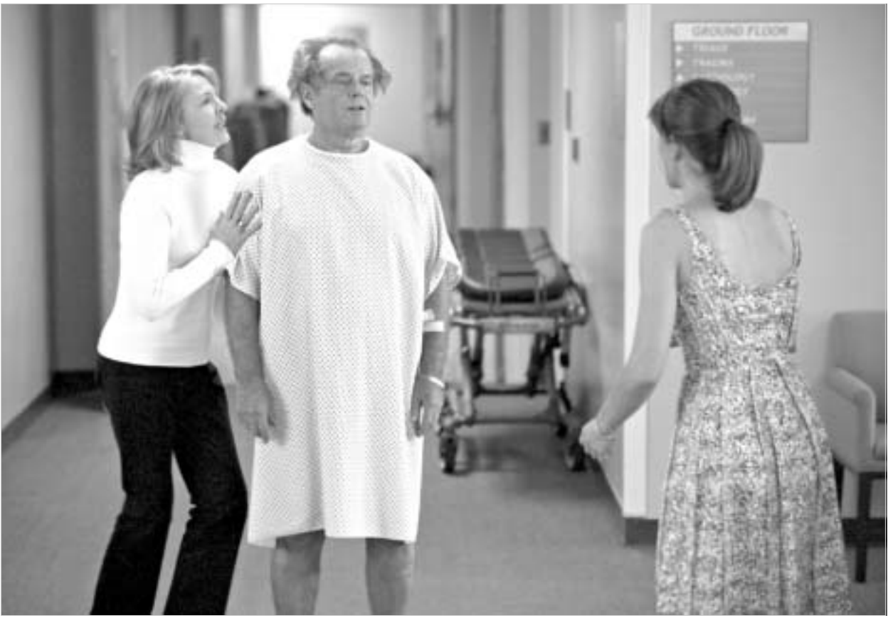
ჯეკ ნიკოლსონი ფილმი Something's Gotta Give.

ამ ფილმების ასლები DVD-დისკებზე, რომელთაც აკადემია ავრცელებს, მხოლოდ მათ უნდა ენახათ, ვინც "ოსკარების" მინიჭებას წყვეტს. რამდენიმე დღის წინათ ინტერნეტში აღმოჩნდა ფილმი Something's Gotta Give ჯეკ ნიკოლსონისა და დიან კიტონის მონაწილეობით. ზუსტად მეორე დღეს ყველა მსურველს იგივე მისამართზე შეეძლო, თავისუფლად ენახა "უკანასკნელი სამურაი" (მთავარ როლში ტომ კრუზი). კინომწარმოებლებისთვის მეთად არასასიამოვნო სიურპრიზი აღმოჩნდა ორი დღის წინათ ერთ-ერთი ინტერნეტ-აუქციონის შეთავაზება - მომხმარებლებს თავისუფლად მიუწვდებოდათ ხელი ფილმების - "ქვიშისა და ყინულის სახლი" და ისტორიული დრამის "ცივი მთის" გადაქაჩვა.