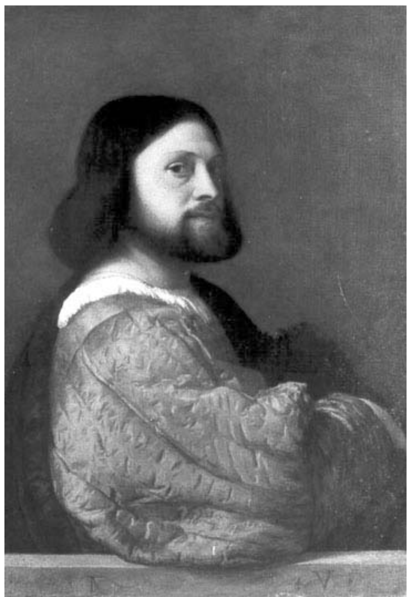
ტიციანი - არიოსტოს პორტრეტი

პოემის დასრულებას ათი წელი დასჭირდა. გზადავზ არიოსტომ ხუთი კომედიაც შეთხზა. 1532 წელს იგი ჭკუქმა იმსხვერპლა. სიცოცხლეშივე არიოსტო ჰომეროსს შეადარეს, მისი პოემა კი, რომელიც სიდიდით ერთად აღებული "ილიადასა" და "ოდისეას" ტოლი იყო, თავისი დროის პესტ-სეულერად იქცა. არიოსტოსავით არავის შეძლო მკითხველის მოწყვეტა მოსანყენი და ერთფეროვანი რეალობისაგან, ასე მარჯვედ ვერაინ მალავდა გამონავონის ქვეშ შთავონების არარსებობას. და მაინც, მისთვის არასოდეს უღალატია ეპოქის ყველაზე დიდ კერძს, გემოვნებას, რის წყალობითაც ლუდოვიკო არიოსტო შეიქნა XVI საუკუნის ყველაზე დიდი პოეტი.