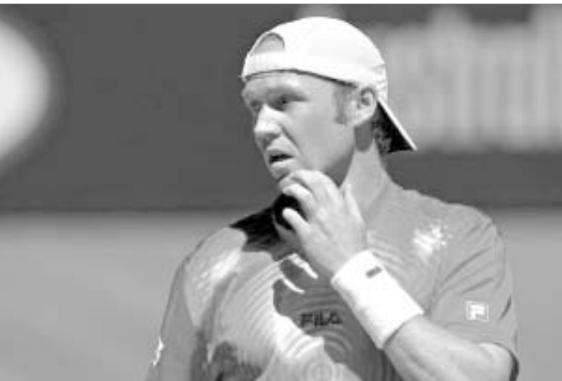
მუტლერი ჩოგბურთის მიტოვებაზეც კი ფიქრობს.