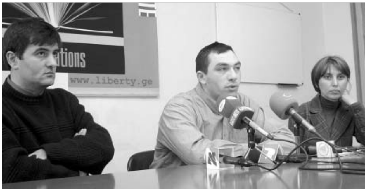
“თავისუფლების ინსტიტუტი” მხარს უჭერს დამანაშავეობასთან ბრძოლას. მაგრამ არა იმ მეთოდებით, რასაც ყოფილი ხელისუფლება იყენებდა.

გუშინ თავისუფლების ინსტიტუტში გამართულ პრესკონფერენციაზე ამავე ორგანიზაციის წევრებმა ვარდების რევოლუციის შედეგად მოსული ხელისუფლების მისამართით დელიკატური ფორმის, მაგრამ სერიოზული ხასიათის მინიშნებები გააკეთეს. კერძოდ, მესამე სექტორის წარმომადგენლებმა ხელისუფლებას შეახსენეს, რომ ნებისმიერი სასიკეთო წამოწყება, თუკი იგი მართვის ძველ ფორმებსა და მეთოდებს დაეფუძნება, საქართველოს დემოკრატიული განვითარების გზით ვერ წაიყვანს.