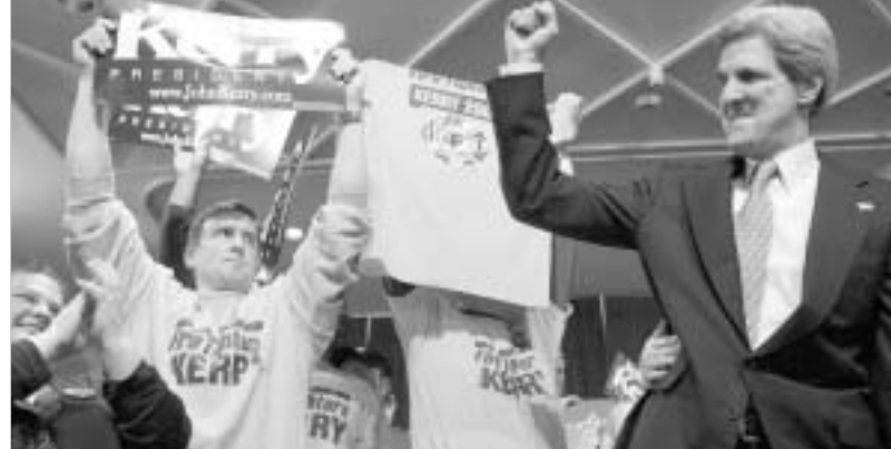
ჯონ კერი პირველ გამარჯვებას ზეიმობს.

კერის სენატორმა ჯონ კერიმ აიოვას შტატში დემოკრატიული პარტიის საპრეზიდენტო კანდიდატებს შორის გამართულ არჩევნებში გაიმარჯვა. ყველასათვის მოულოდნელად, მაღალრეიტინგულ კანდიდატად მიჩნეული მოვარდ დინი მესამე ადგილზე გავიდა. სენატორმა ჯონ ედვარდსმა კერის შემდეგ ყველაზე მეტი ხმა მიიღო. კონგრესმენი დიკ გეფარდტი კი მეოთხე ადგილზე გავიდა. ამის შემდეგ, მან საპრეზიდენტო არჩევნებში მონაწილეობაზე საერთოდ უარი თქვა და პრეზიდენტობის მსურველ დემოკრატ კანდიდატთა რიცხვი შეიადამდე შეამცირა. საბოლოო შედეგები ამგვარია: ჯონ კერიმ 37.7 პროცენტი მიიღო, ჯონ ედვარდსმა – 31.8, ჰოვარდ დინმა – 18, რიჩარდ გეფარდტმა – 10.5, დენის კუსინიჩმა – 1.3, ალ შარპტონმა – 0.7. აიოვას შტატში გამართულ არჩევნებში მონაწილეობის არ დალეულები კანდიდატები კანდიდატებს შორის საარჩევნო ოლქებში პარტიის წევრები იკრიბებიან და დემოკრატები მიდამარტინე არჩევნებს მართავენ, რათა პარტიის ერთი, ყველაზე პოპულარული კანდიდატი გამოავლინონ. თითოეული შტატის საარჩევნო ოლქებში პარტიის წევრები იკრიბებიან და დელეგატებს ირჩევენ, რომლებიც თავის შორი, ამა თუ იმ საპრეზიდენტო კანდიდატს უჭერენ მხარს. ტრადიციულად, საპრეზიდენტო კანდიდატების შერჩევა აიოვას შტატში იწყება ხოლმე. ამჯერად, რესპუბლი-