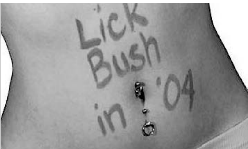
ქალები ბუშის წინააღმდეგ.

ცამეტმა ამერიკელმა გოგონამ გადაწყვიტა, რომ მომავალ არჩევნებში ჯორჯ ბუშს ხმა აღარავინ უნდა მისცეს. ამ ჩანაფიქრის განსახორციელებლად მათ შესანიშნავი ვებ-გვერდი შექმნეს, რომელშიც ისინი გულწრფელად და დაუფარავად გამოთქვამენ საკუთარ აზრს ახლანდელი პრეზიდენტის შესახებ.