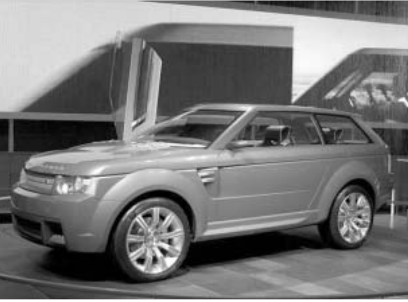
ლენდ როვერ რეინჯ შტორმერი