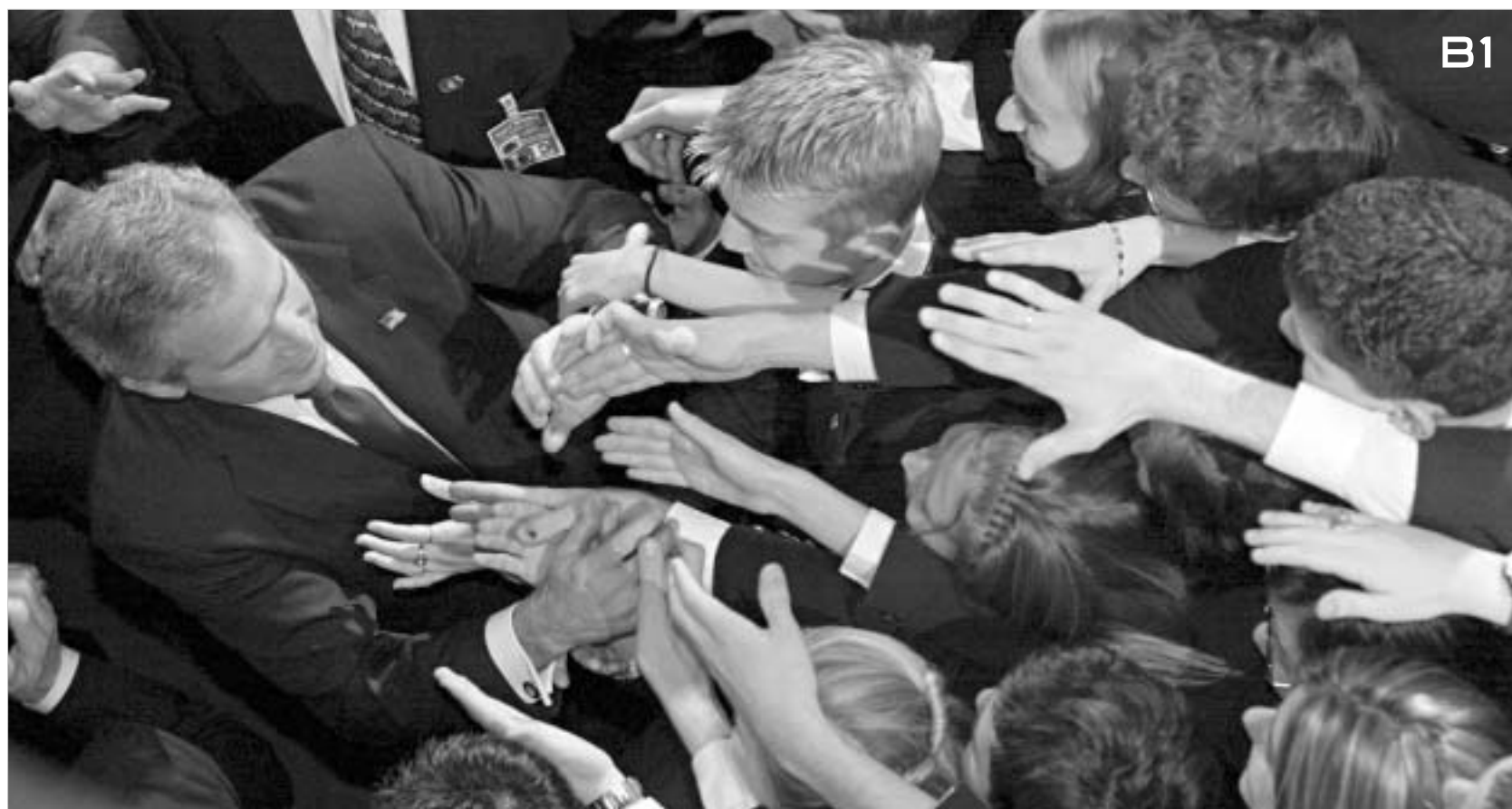
ასე ესალმებოდა ჭორჭ ბუზს აშშ-ს კონგრესი.

"24 საათის" სპეციალური რეპორტაჟი აშშ-ს კონგრესიდან