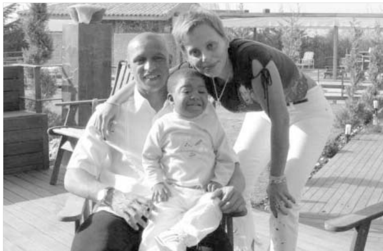
რობერტო კარლოსს ოჯახი ენატრება.

- მართალია ბრძანდებით, მაგრამ უკანასკნელი ორი თვის განმავლობაში არცთუ ისე სასიამოვნო პერიოდი მქონდა. როცა ტვინი არეული გაქვს, ძნელია, ორგანიზმი აიძულო, კარგად იმუშაოს. ახლა მთავარია, გულშემატკივრებმა იცოდნენ: ჩემი პრობლემები წელ-წელა მთავრდება