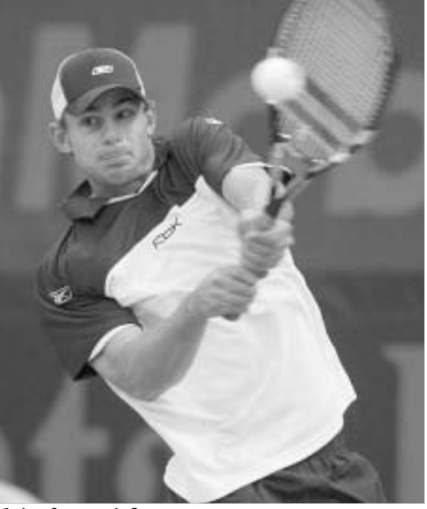
ტურნირის ფაქტობრივი: ანდრე აგასი და ენდი როდიკი უპრობლემოდ იგებენ

როდიკმა სამმაგი მატჩ-პოინტი მოიპოვა და გამარჯვებას პირველი მონონდებისთანავე, მეორე დარტყმაზე მიიღწია. მთლიანად კი წარმატების მისაღწევად ამერიკელს შარშან დონისგან მოხმარებაში მხილველი ჩეხის დასამარცხებლად 1 საათი და 13 წუთი დასჭირდა.