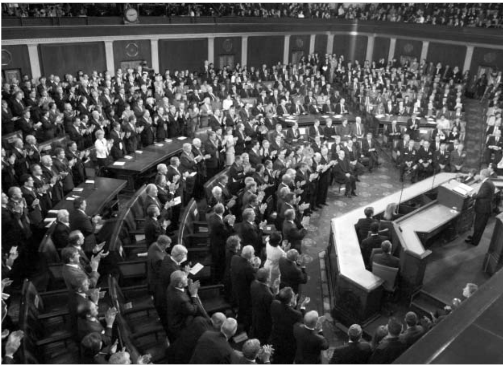
რესპუბლიკელების ოვაციები - ბუშს