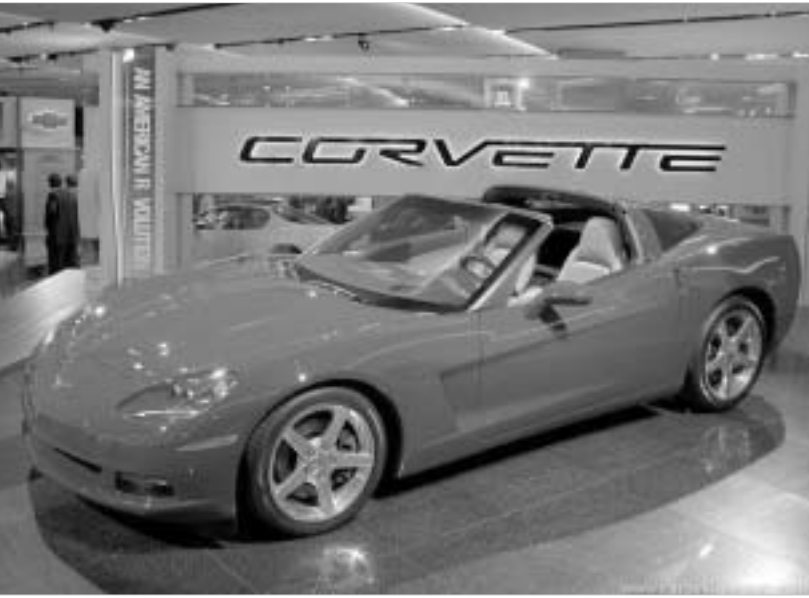
შევროლე კორვეტი C6