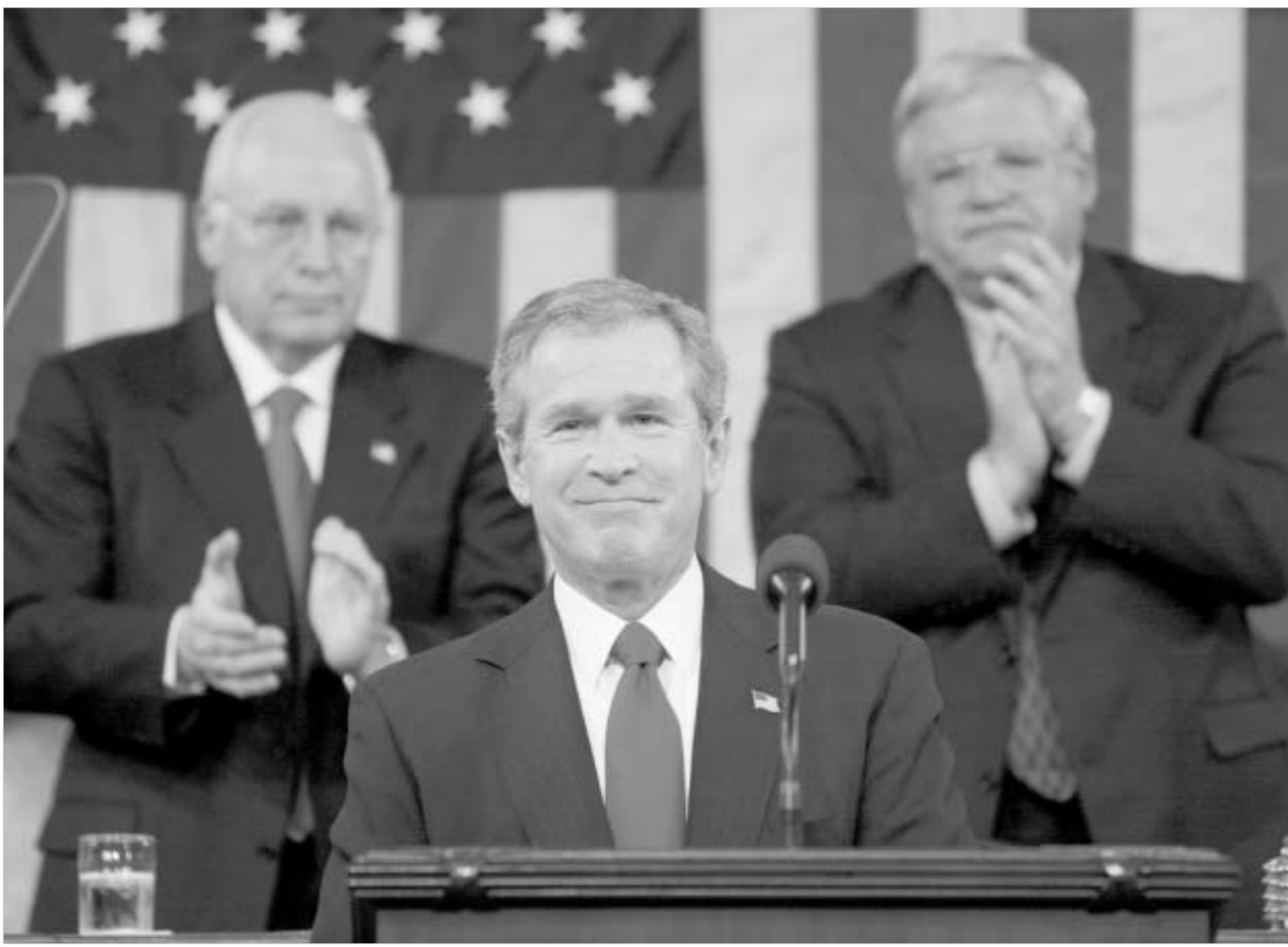
"ამერიკა არავის თანხმობას არ დაელოდება... ქვეყნის უსაფრთხოების დასაცავად".

ჯორჯ ბუშმა განსაკუთრებული აქცენტი ახლო აღმოსავლეთის დემოკრატიზაციაზე გააკეთა, რაზეც კონცენტრირებული იქნება საინფორმაციო საშუალებები და ამერიკის მიერ დაფინანსებული პროგ-