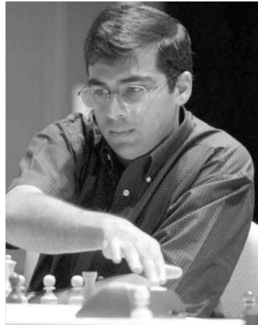
ანანდს წინ ვედარაფერი დაუდგება

რაც შეეხება ლუკ ვან ველის, ის შორს არის თავისი საუკეთესო ფორმისგან, რომელშიც შარშან იყო. თუმცა, ადამსზე მისი სენსაციური გამარჯვება გარკვეულ კითხვებს ბადებს. ვან ველიმ სუსტად დაწყებული პარტია რთულ ენდშილში გადაიყვანა და კიდევ ერთხელ დაამტკიცა, რომ კუ და სამი პაიკი უფრო ძლიერია, ვიდრე მხოლოდ დედოფალი.