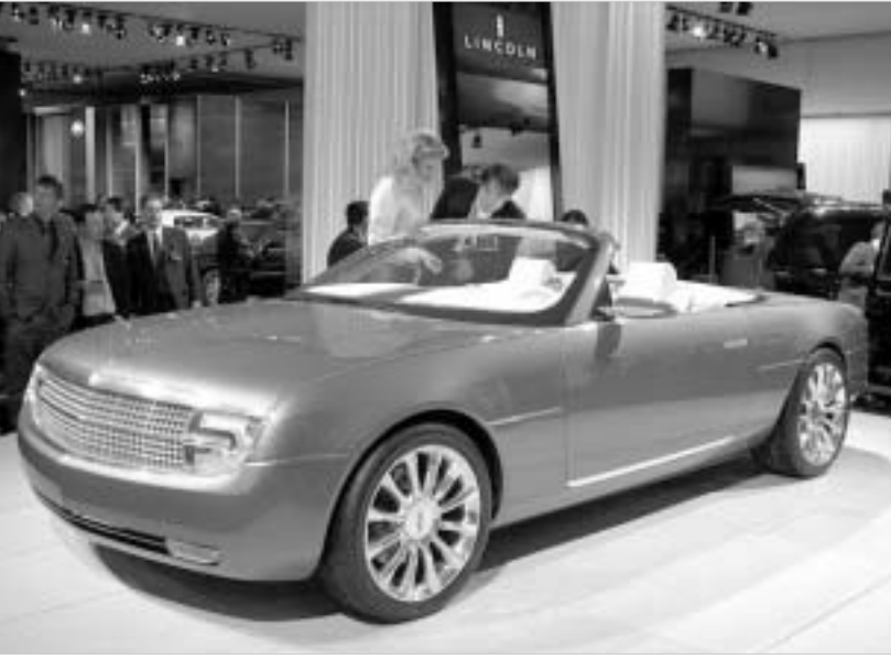
ლინკოლნ მარკ X