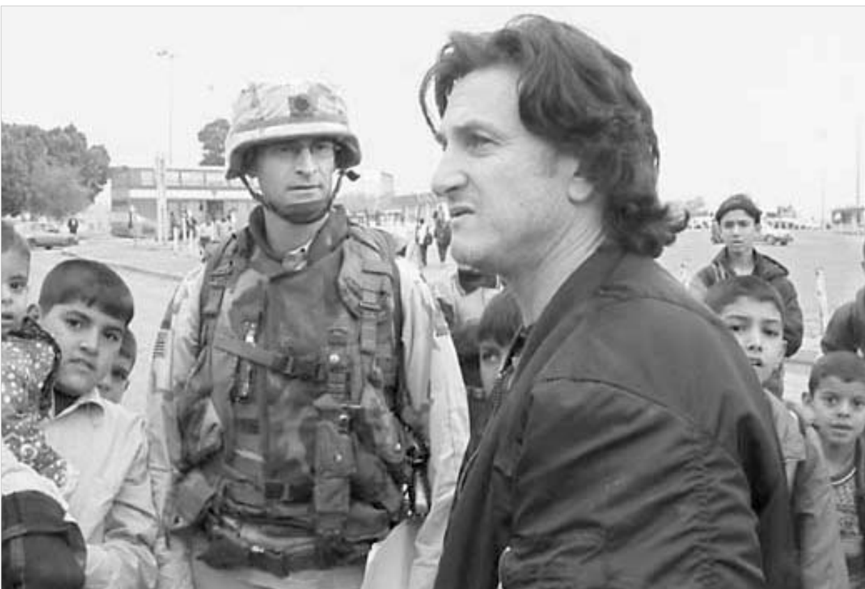
შონ პენი ბაღდადში

აი, ასეთი არაერთგვაროვანი შეფასებები დაიმსახურა შონ პენმა 14, 15 იანვრის "სან ფრანცისკო ქრონიკალში" დაბეჭდილი რეპორტაჟების გამო, რომლებიც მსახიობმა ერაყში 4-დღიანი ვიზიტის შემდეგ დაწერა.