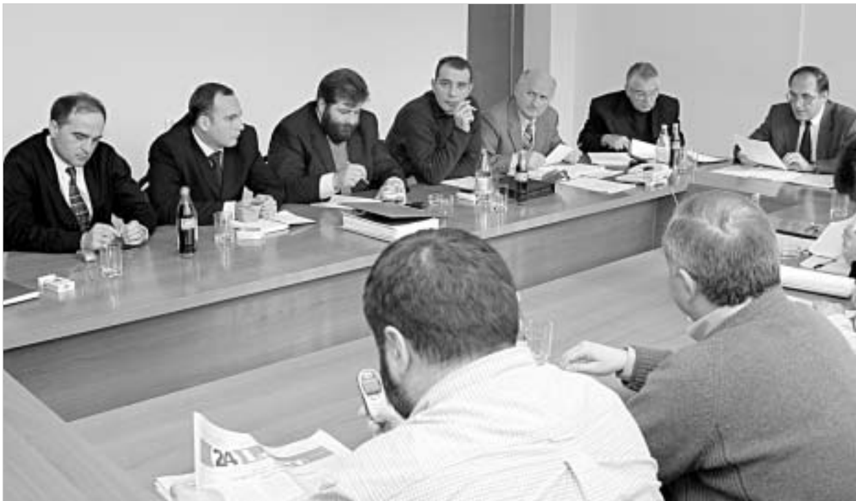
„რუსთავი 2“-მა ევრეთ წოდებულ OPT-ს სიხშირეზე მაუწყებლობის ათწლიანი ლიცენზია მოიპოვა.