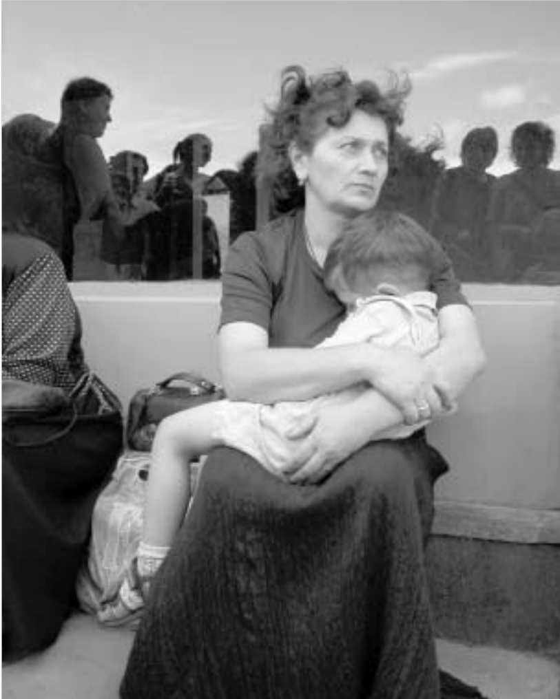
„მსოფლიოს განწყობა“ თბილისში. თავისუფლების მოედანზე.

ამ ქვეყნების წარმომადგენლები ეკონომიკური ცვლილებების მოლოდინში არიან. კითხვაზე, - "თქვენი ქვეყანა ახლა უფრო უსაფრთხოა თუ - 10 წლის წინათ?" - მთელ მსოფლიოში გამოკითხულთა 57 პროცენტმა ნეგატიური პასუხი გასცა. ოპტიმისტურადაა განწყობილი მხოლოდ 22 პროცენტი. ავღანეთი კი, სადაც 88 პროცენტს მიაჩნია, რომ მათი ქვეყანა ამჟამად უფრო უსაფრთხოა, ვიდრე - 10 წლის წინათ, იმედიანი განწყობის მხრივ, ლიდერობს; მის შემდეგაა კოსოვო (81 პროცენტი) და საქართველო (55 პროცენტი). დასავლეთ ევროპის წარმომადგენელთა ნახევარი (58 პროცენტი) მიიჩნევს, რომ, გასულ 10 წელთან შედარებით, საფრთხემ იმატა. ასე ფიქრობს დანიელთა - 85, პორტუგალიელთა - 77, ბრიტანელთა - 65, ფრანგთა - 55 და გერმანელთა 52 პროცენტიც. აღმოჩნდა, რომ მსოფლიოს ხალხთა ყოველი მეორე მოსახლე ფიქრობს, რომ მათი ქვეყნები ამჟამად ეკონომიკურად ნაკლებად წარმატებულნი არიან, ვიდრე - 10 წლის წინათ; მხოლოდ მესამედს მიაჩნია, რომ ეკონომიკური წარმატება სახეზეა. ასე დასავლეთ ევროპის ქვეყნების წარმომადგენელთა მხოლოდ 32 პროცენტს ვკონია. პოზიტიურად განწყობილი ქვეყანათა რიცხვში არიან ის ქვეყნები, სადაც ეროვნული ვალუტა ევროთი არ შეცვლილა: შვეიცარია (59 პროცენტი), დანია (59 პროცენტი), ირლანდია (50 პროცენტი), ნორვეგია (44 პროცენტი) და დიდი ბრიტანეთი (44 პროცენტი). დასავლეთ ევროპის ყველა დანარჩენი ქვეყანა ნეგატიურად არის განწყობილი. უნდა გამოიყოს გერმანია, სადაც გამოკითხულთა 77 პროცენტი მიიჩნევს, რომ, გასულ 10 წელთან შედარებით, ქვეყანა ამჟამად ეკონომიკურად წარუმატებელია. აღმოსავლეთ და ცენტრალური ევროპის ქვეყნების წარმომადგენელ-