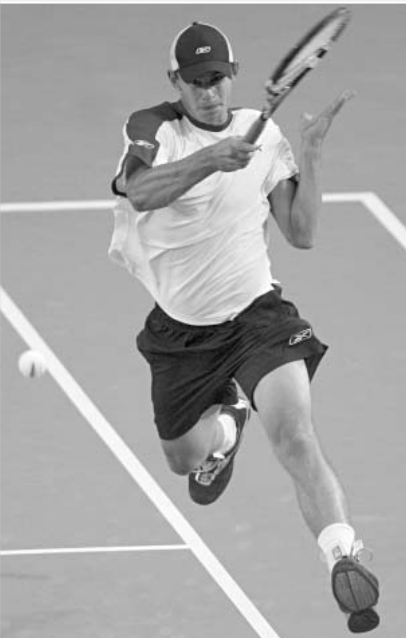
ენდი როდუკი ტრადიციას არ არღვევს - უპრობლემოდ იგებს.

"დღეს, დილით, თავს შესანიშნავად ვგრძნობდი. მე მივალნიე იმას, რაც მსურდა. ახლა ჩემი მიზანი ნახევარფინალში გასვლაა. ფორმას თანდათან აღვიდგენ", - განაცხადა საფინმა. მეორე ბლეიკს, როდელში შეხვდება ჯეიმზ ბლეიკს, საფინმა პირველი ანაბე მენდინა-პარიეტეს, ხოლო ამერიკელმა ლინდს დევინორტმა იტალიელი ლაურა გრანიელი გაისტუმრა სამშობლოში.