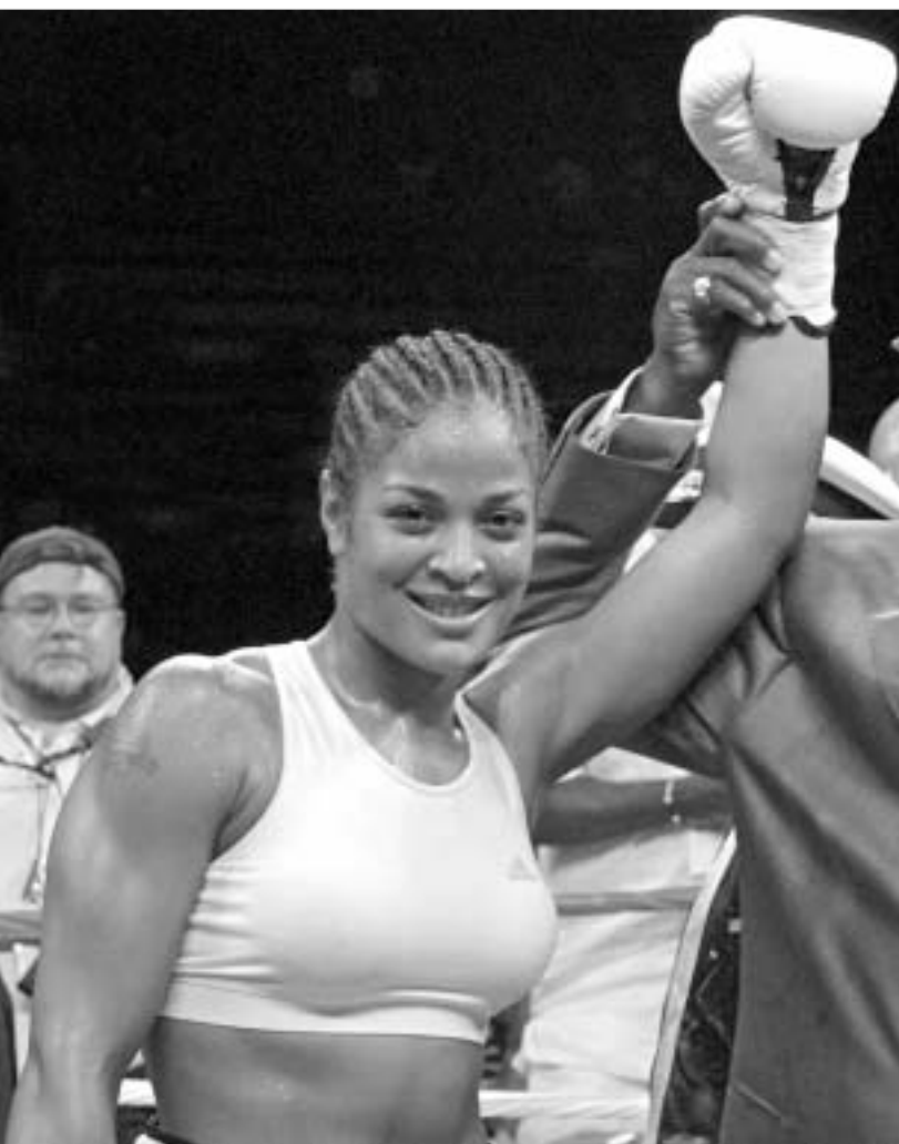
ღაილა ალის ბევრი თაყვანისმცემელი ჰყავს.