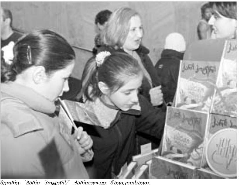
მეორე "პარი პოტერს" ქართულად წავიკითხავთ.