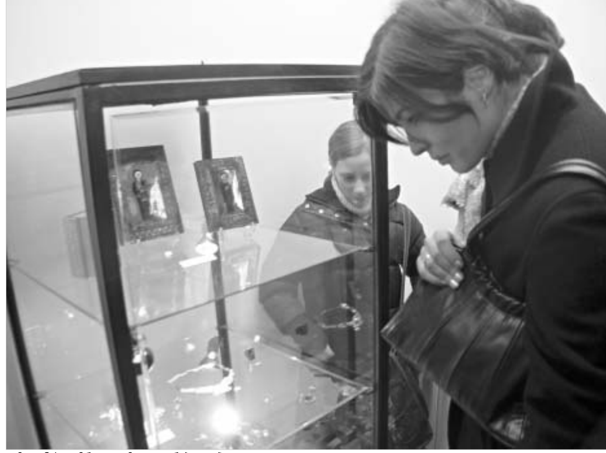
გამოფენას უამრავი დამთვალიერებელი ჰყავდა.