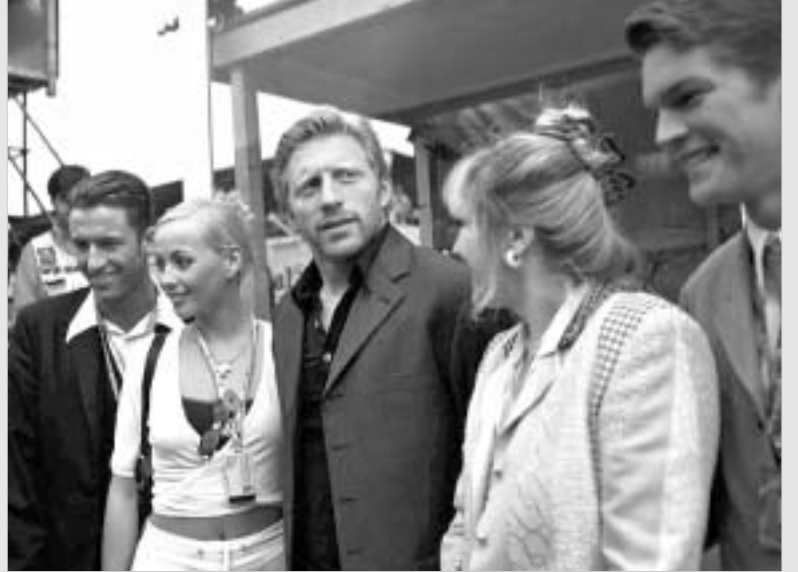
ბორის ბეკერი ჟურნალისტობას იწყებს.

"თვრამეტი წლის განმავლობაში ვიყავი რესპონდენტი. ჟურნალისტები ათასგვარ კითხვებს მისვამდნენ. თუმცა, მუდამ ისეთი შერძინება მექონდა, რომ არასოდეს უკითხავთ რაიმე მნიშვნელოვანი. ახლა მინდა, თავად დაესვა კითხვები, თანაც, საინტერესო კითხვები".