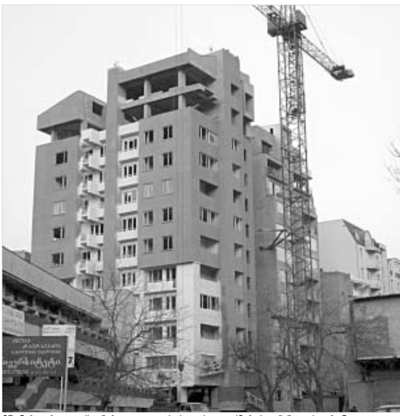
მშენებლები ფიქსირებული გადასახადის გაუქმებას აპროტესტებენ.

მშენებლობაში ფიქსირებული გადასახადის შემოღების შესახებ მომზადებული კანონპროექტი ურბანიზაციისა და მშენებლობის სამინისტრომ პარლამენტს გასულ წელს, სექტემბერში წარუდგინა. სხვათა შორის, ეს კანონპროექტი, რომელიც გადასახადო კოდექსში დამატებისა და ცვლილებების შეტანას გულისხმობდა, ფინანსთა სამინისტროსთან ხანგრძლივი მოლაპარაკებისა და შეთანხმების შემდეგ მომზადდა. ამ ორ უწყებას შორის იმ პერიოდში სადავო საკითხად იქცა ფიქსირებული გადასახადის განაკვეთი. მშენებლობის სამინისტრო ერთ კვადრატულ მეტ-