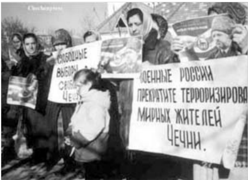
რუსეთის წინააღმდეგ მიმართული საბრძოლველი აქცია.

უსმანის რაზმი, ისევე როგორც ჩვენები მებრძოლების სხვა მობილური ჯგუფები, დივერსიულ აქციების ახორციელებენ, თავს ესხმებიან სამხედრო კოლონიებს და რუსეთის არმიის გარნიზონებს. “თუკი რაოდენობრივად ძალები არათავა-