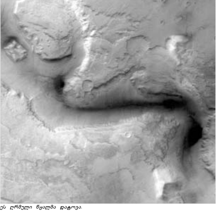
ეს ღრმული წყალმა დატოვა.

ამ ფოტოზე გამოსახულია მალელობები, სადაც ჩანს ნაკვალევი. მიიჩნევენ, რომ ეს ნაკვალევი წყალმა დატოვა. მხოლოდ რამდენიმე