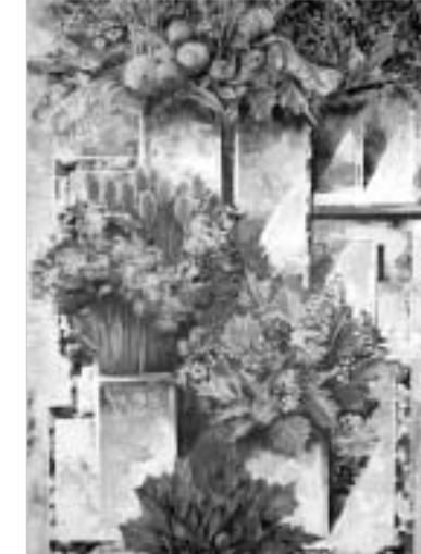
თბილისი, საბურთალოს რაიონი