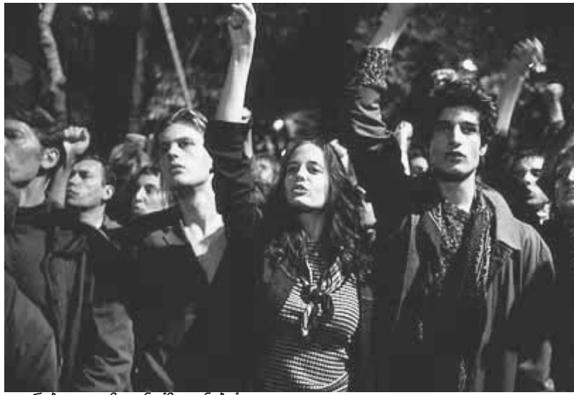
კადრები ფილმიდან 'მეოსნება'

ცხოვრება კინო რომ არ არის, ყველამ ვიცით. ზოგჯერ, როცა რალაც გასაოცარი ხდება ხოლმე, გამბობთ, თავი კინოში მეგონათ, მაგრამ ასეთი რამ, მოგეხსენებათ, დიდი იშვიათობაა. ბერნარდო ბერტოლუჩი კიდევ ერთი ასეთი კინო-ზღაპარი შემოგვთავაზა, 1968 წლის უტოპური ამბავი. და თუმცა ცხადია, რომ ასეთები არ ხდება, "მეოსნებას" მაინც სიამოვნებით მოვატყუებინებთ თავს - ის მეტისმეტად ტუბილია, ისევე, როგორც ნებისმიერი ოცნება. ერთგვარი ავადმყოფობაც კი ყოფილა, სინეფილია. ამ სენის მატარებელი ადამიანი მარტოხელაა. კინო მაცდურია, მაგრამ მას მხოლოდ პატარა, უბინო გოგონა თუ დაუფერებს. კინოთეატრში ნანახი კარგი კინოფილმი იგივეა, რაც დღისით ნანახი სიზმარი, რომელიც, დიდი-დიდი, ორი საათი გრძელდება: ირგვლივ ბუნება, ეკრანი მომწუსხველად ციალებს... სიზმარია, აბა, რა! ბერნარდო ბერტოლუჩის "მეოსნება" ნამდვილი კინოა, ცდუნება, რალაცის დაპირება. ასეთია 1968 წლის მისი მომხდარი სტუდენტური გამოსვლა კი - ასეთ სექსუალურ რეჟოლუციას კინოში თუ ნახავთ. ასეთები არიან მოედანზე შეკრებილი ახალგაზრდები, ეშმა-