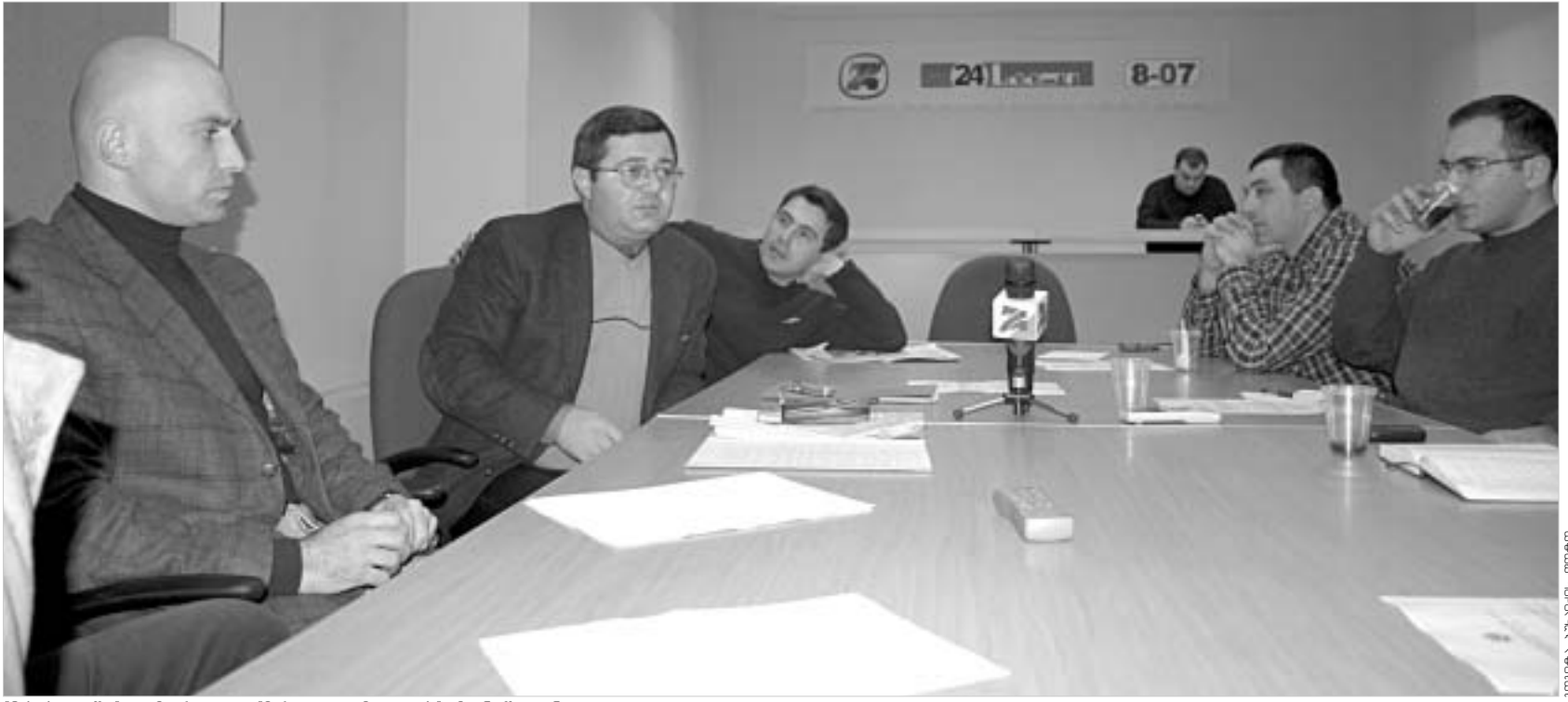
"24 საათში" გამართული "მრგვალი მაგიდას" მონაწილეები.

დამოუკიდებლობის მეთორმეტე წელს ჯერ კიდევ უპასუხოდ რჩება კითხვა: რამი გვჭირდება ჯარი? ძველი ხელისუფლების მიერ "რეფორმირებული" არმია არჩეული პრეზიდენტის მიხედვით სააკაშვილის ინაუგურაციას დაამშვენებს... რა არის ეს, ძალის თუ უსუსურობის დემონსტრაცია? როგორ არმიას ჩააბარებს სააკაშვილი საკუთარ შთამომავალს? რა შეიცვლება ქართულ ჯარში სამოქალაქო თავდაცვის მინისტრის მოსვლის შემთხვევაში? - "24 საათის" სტუმრები ცდილობენ, პასუხი გასცენ ამ კითხვებს.