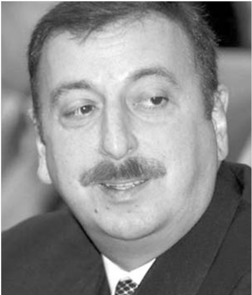
ილჰამ ალიევის ოპოზიციის დევნაში ადამიანუფლები.

სხვა საერთაშორისო ორგანიზაციებმა, მათ შორის, ევროსაბჭოს