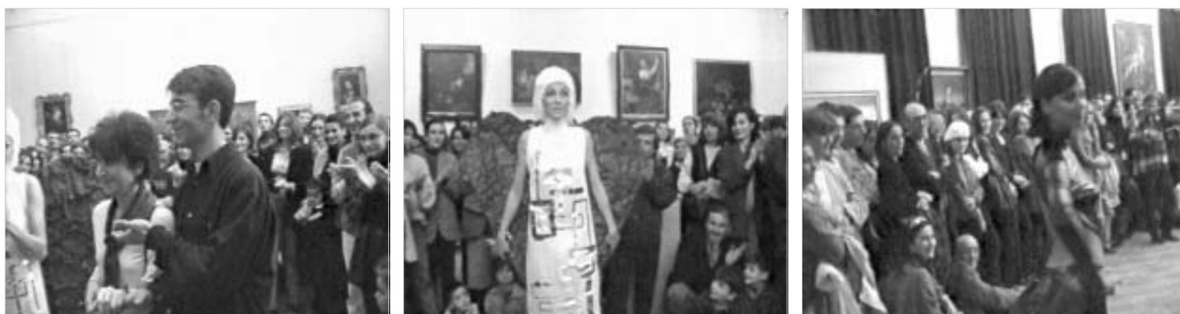
კოლექციის ჩვენება ხელოვნების მუზეუმში 1998 წელს.