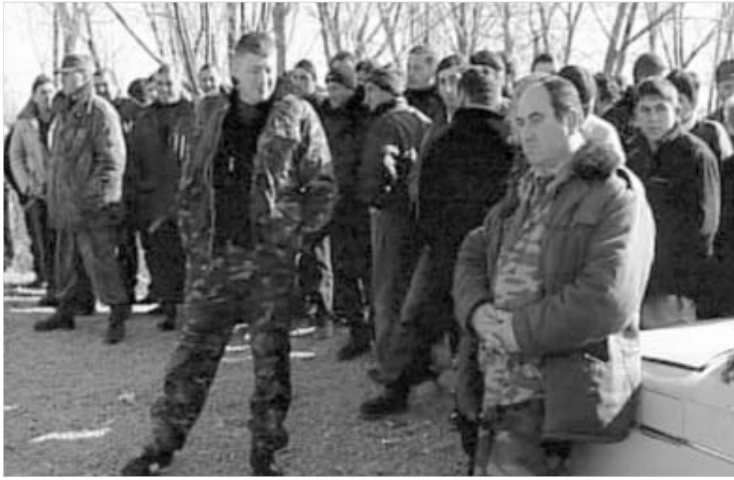
ქართველი მძევლის ახლობლების თქმით, დღეს ერგნეთის საგუშაგოსთან გაკვლილი მტერი ადამიანი შეიკრიბება და საპროტესტო აქციის ფორმაც უფრო სერიოზული იქნება.

"ჩვენ პოლიციელებს კომინალებზე არ ვაქცივით," - აცხადებს ქვეყნის პრეზიდენტი მიხეილ სააკაშვილი. ცხინვალის ძალიან მძიმე დაკავებული ქართველი პოლიციელი, რომელსაც მკვლელობის ბრალდება წაუყენეს, სასტიკად ნაცემი, ცხინვალის ციხეში კვლავ რჩება. შესაბამისად, უკვე მეოთხე დღეა, ქართულ-ოსური კონფლიქტის ზონაში სიტუაცია უკიდურესად დაძაბულია. დიდი და პატარა ლიხვის ხეობებში გუშინ დილიდან მოსახლეობამ საპროტესტო აქციები მოაწყო.