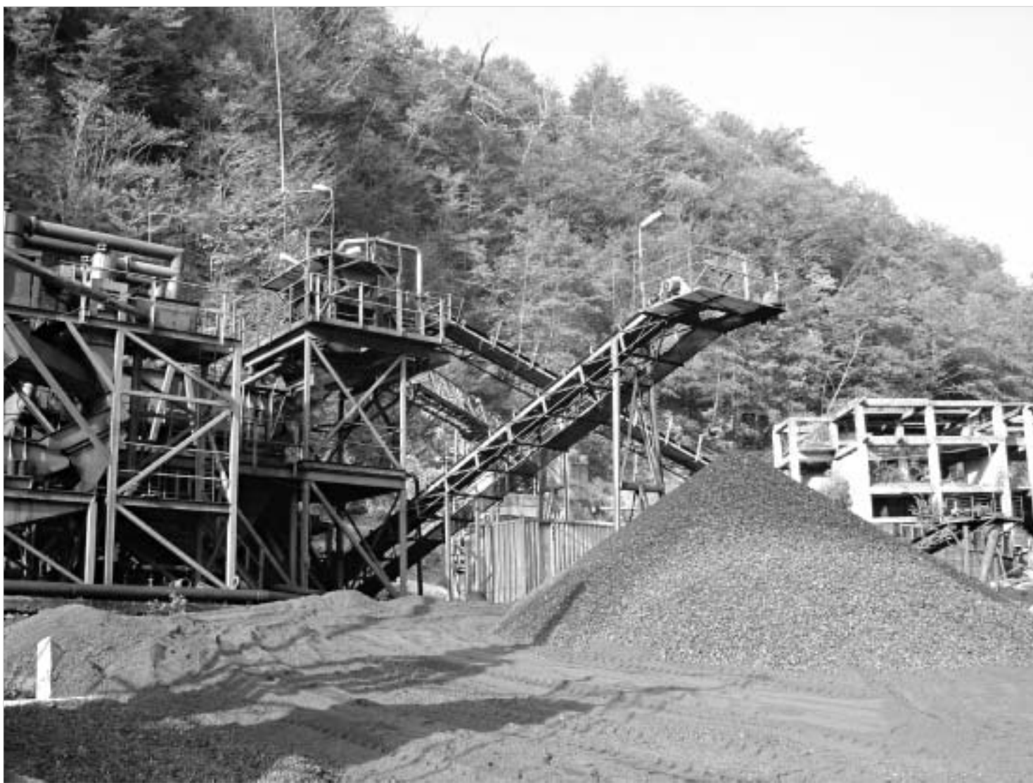
ტყვარჩელის ქვანახშირის საბადო, რომელსაც თურქები ამუშავებენ.

აღნიშნული ვითარებას ობიექტური მიზეზები გააჩნია. საქმე ის არის, რომ ტურისტთა უმეტესი ნაწილი სწორედ გაგრამი და ბიჭვინთში ჩადის. თავდაპირველად, ეს ყველაფერი უკავშირდებოდა იმას, რომ ომის შემდგომ, საკურორტო ინფრასტრუქტურის უმეტესი ნაწილი მხოლოდ აქ შენარჩუნდა. ამასთან, ახლოს არის საზღვარი რუსეთთან, ესე იგი, იოლია სატრანსპორტო მიმოსვლაც. ბოლო დროს აქ აქტიურად ვითარდება მომსახურების სფერო და დღეს, გაგრის და ბიჭვინთის სავაჭრო მარკა, უკვე საკმაოდ კარგად არის ცნობილი რუსულ ტურისტულ ბაზარზე. საერთოდაც, გაგრის გარე ანტიურაჟი, აფხაზეთის სხვა ყველა კურორტზე გაცილებით მიმზღველია. ამასთან ერთად, ინვესტორთა მუშაობის პირობები, რესპუბლიკის სხვა რეგიონებთან შედარებით განსხვავდება. ამის გამო, მათთვის უმჯობესია აქ ჩაიღონ ინვესტიციები და დარამუნებული იყვნენ ტურისტთა სიმრავლეში.