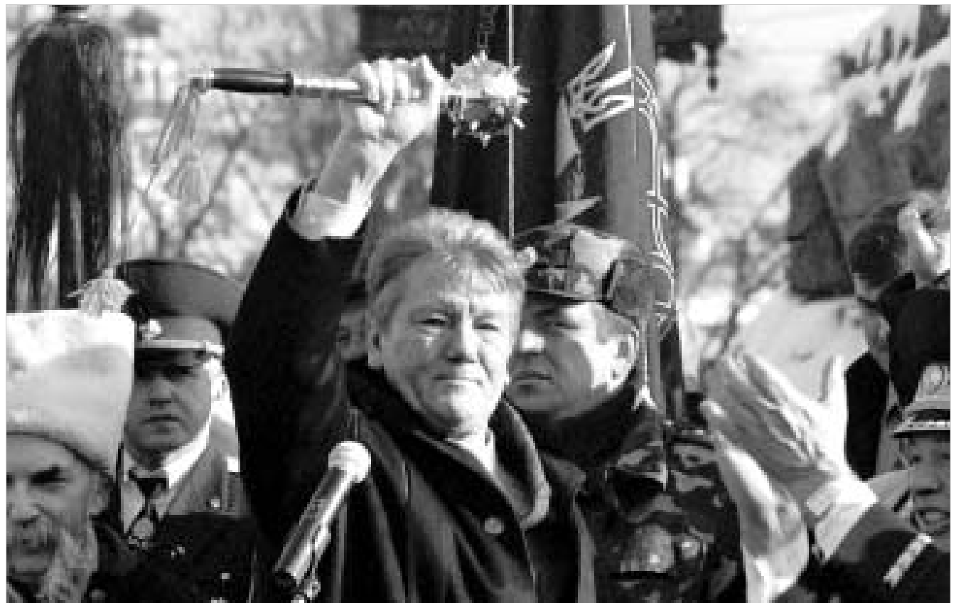
გუშინ უკრაინის ახალი პრეზიდენტის მმართველობის ვადა დაიწყო.