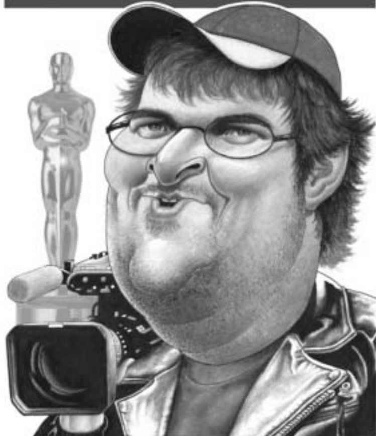
1954 წ. 23 აპრილი: დაიბადა მიჩიგანის შტატში, ქალაქ ფლინტში.