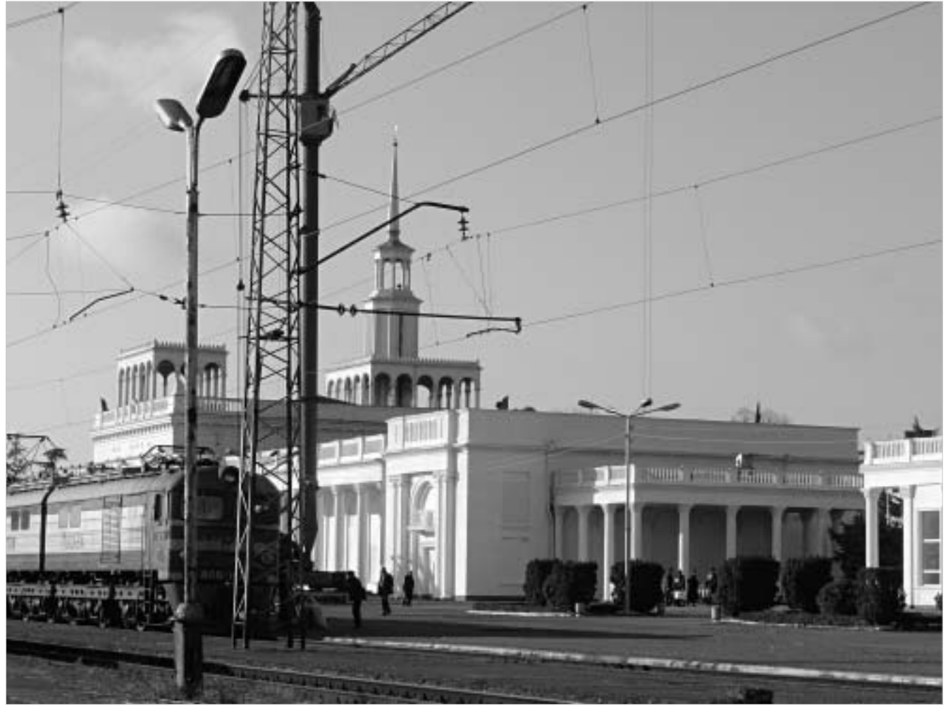
რუსეთში ყველაზე დიდი ფული რეინტეგრაციის ალტერნატივა და სოხუმის სადგურის კონსტრუქციის რეინტეგრაციის დახარჯვა.