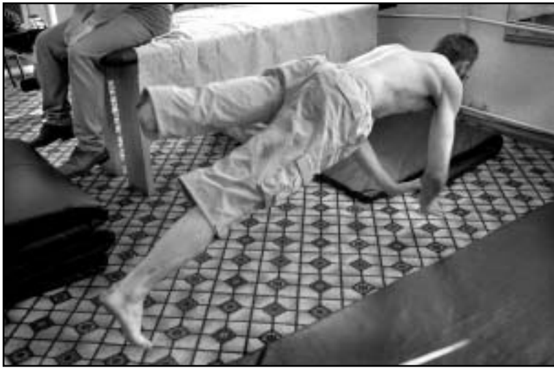
სოხუმის სარეაბილიტაციო ცენტრი