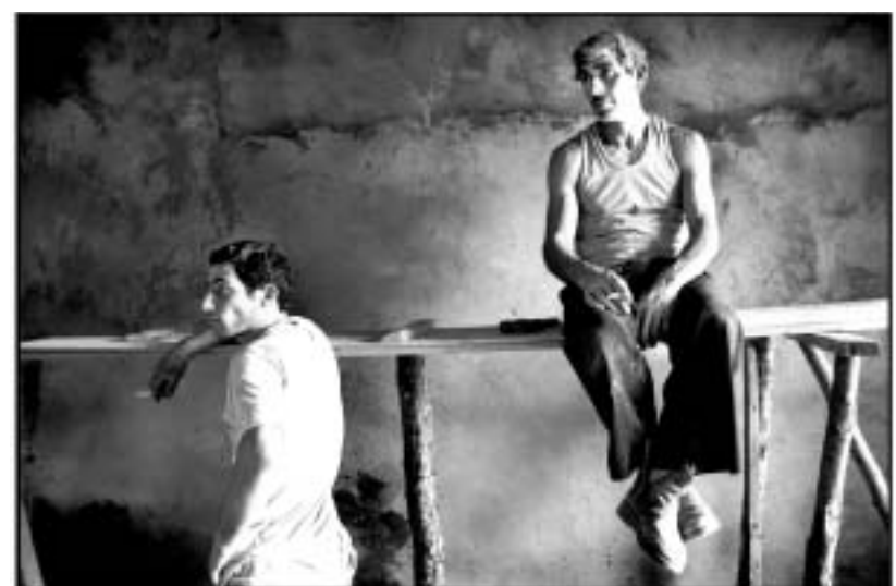
მეგრული მუშები ოჩამჩირეში