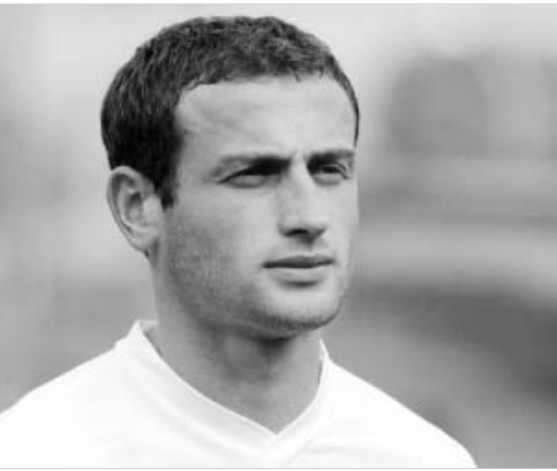
მაღხინ ასათინის "ლოკომოტივი" სთამაშო პრეტეკია აქლი.