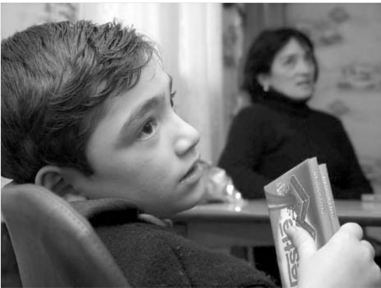
პატარა გიორგი ახლა ბედნიერია.

EveryChildi-ის, UNICEF-ის, World Vision International-ის, Mercy Corps-