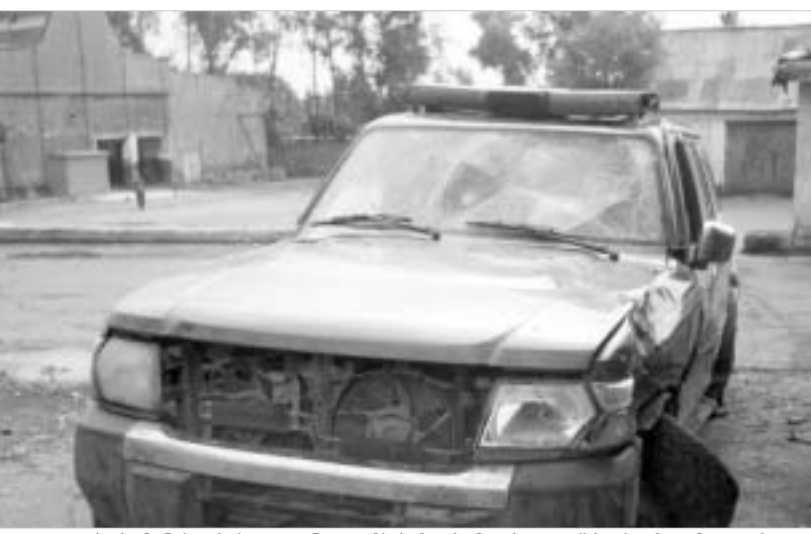
თავდაცვის სამინისტროს კუთვნილი „ვიპი“. რომელსაც ექსპერტიზა ჩაუტარდა.