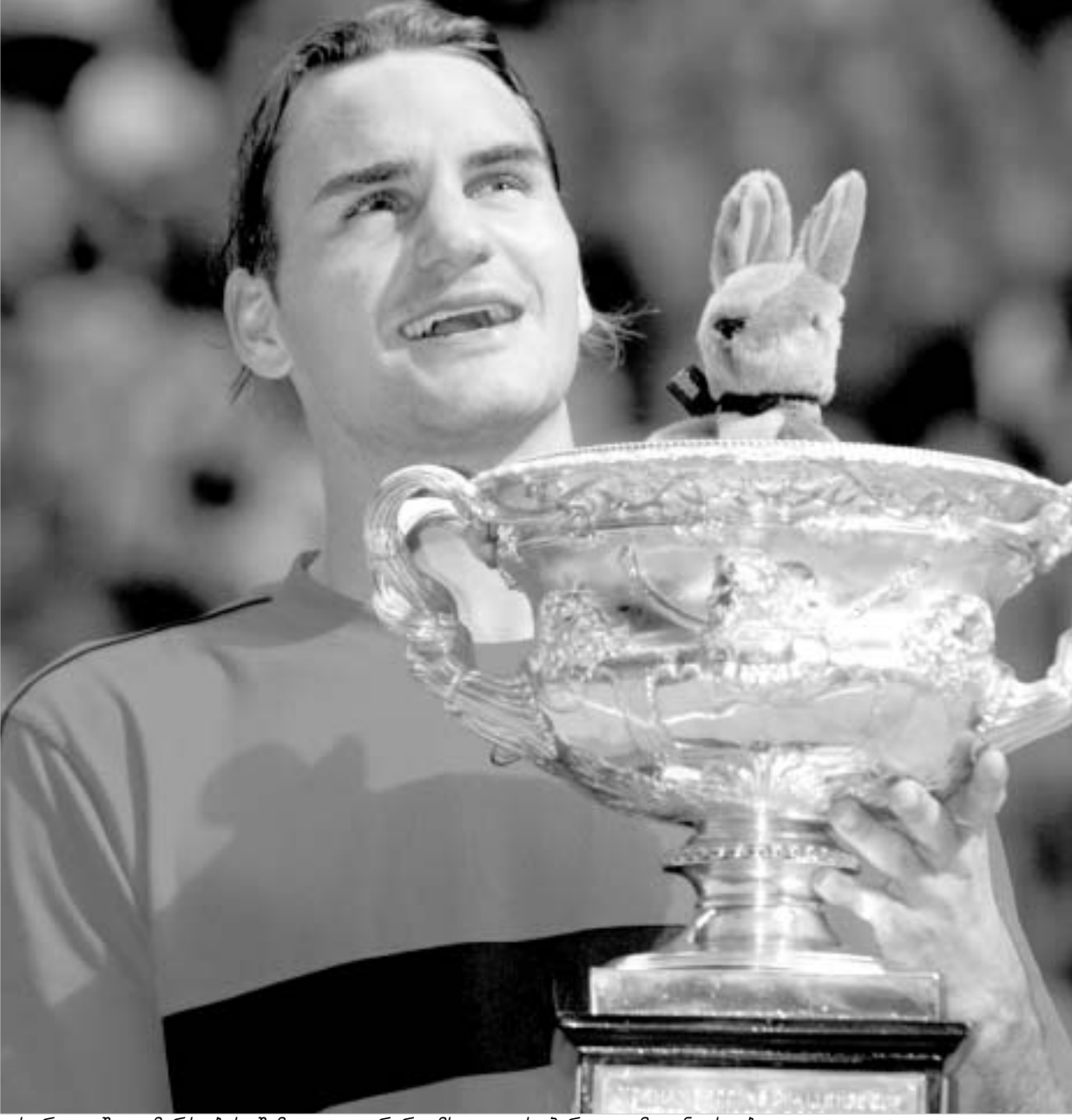
ავსტრალიაში გამარჯვების შემდეგ ფედერერი მსოფლიოს პირველი რიგანი ხდება.

პარტიის განმავლობაში საფინს არც ერთი პირველი მოწოდება არ ნაუვიდა. ამიტომ გასაკვირი არ უნდა იყოს, რომ პირველი სეტი ფედერერს დარჩა. რუსისთვის მეორე სეტში კიდევ უფრო დაიძაბა ვითარება - უამრავ შეცდომას უშვებდა, რასაც ძალზე ემოციურად გამოხატავდა. პირველი მოწოდებისას ბურთი მიზანს არ აღწევდა და თუ რამდენიმე ქულის ალუბას ახერხებდა, მხოლოდ იმიტომ, რომ შვეიცარიელი უშვებდა შეცდომებს. ფედერერი მთელი თავისი სჯობდა რუსს. სჯობდა როგორც სისწრაფეში, ისე სიზუსტეში. მეორე სეტიც შვეიცარიელის გამარჯვებით დასრულდა. საფინისთვის ვითარება არც მესამე სეტში შეცვლილა უკეთესად. გათამაშებები საკმაოდ დიდხანს გრძლდებოდა. თითოეულმა მათგანმა ერთმანეთს ორ-ორი მოწოდება ართვა, ხოლო ორდესაც ანგარიში 6:6 გახდა, საქმე ტაიბრეიკამდე მივიდა. მთელი მინი-