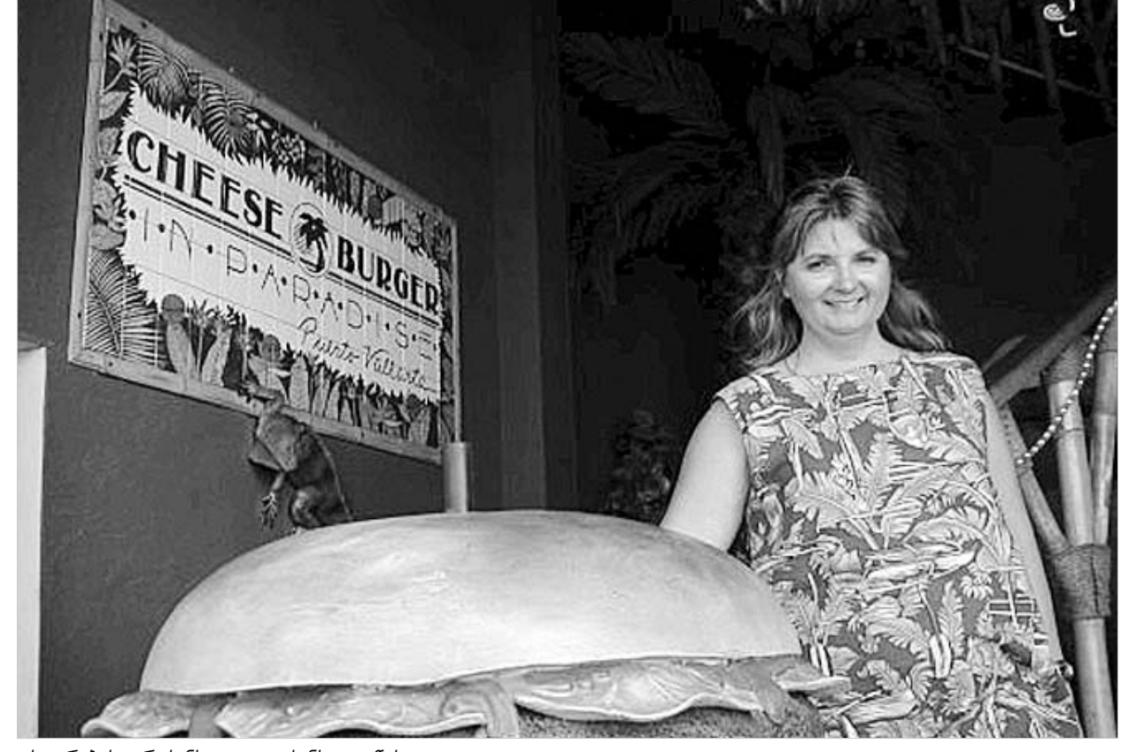
ცხოვრების არაბანსალი და კანსალი წესი.