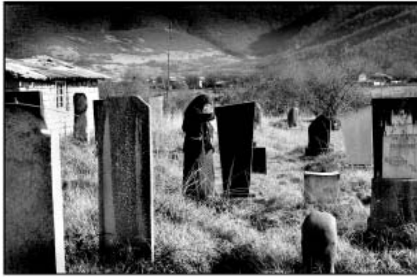
პანკისის მუსულმანური სასაფლაო

მამ ასე, ეპიზოდები ქართული რეალობიდან რუბრიკაში „რეპორტაჟი (ფოტო)კომენტარებით“.