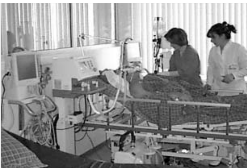
ეროვნულ ცენტრში რეინიაციის ერთი დღე ასობით დოლარი ჯდება. დაუფინანსებლობა ნიშნავს სიკვდილს!

თი თანამედროვე აპარატურით, რომ “დიდი სამედიცინო” ქვეყნიბიდან ჩამოსულ ექიმებსაც კი უეჭვით და, რაც მთავარია, ამ სიკეთით სარგებლობს ქვეყნის რიგითი, უშუბო მოქალაქე, ანუ ის, ვისთვისაც იქმნება კიდევ ჯანდაცვის სახელმწიფო პროგრამები. შესაბამისად, ეროვნული სამედიცინო ცენტრის შემოსავლების 80 პროცენტით სწორედ სახელმწიფო პროგრამებში განისაზღვრა, რაც თვეში 500 ათას ლარს შეადგენდა (საკუთარი, ანუ შინა და სტანდარტებით მიღებული თანხა, დაახლოებით 50-100 ათასი ლარი, მთლიანი შემოსავლის 20 პროცენტია). კარგ დაფინანსებას ჩვენი ქვეყნის პირობაზე მაღალი ანაზღაურებაც მოჰყვა და, პირველად საქართველოში, იმის საშუალება განჩნდა, რომ ავადმყოფისთვის ფულად და მედიკამენტებით არავის მოეთხოვა. ასეთი ჯან-