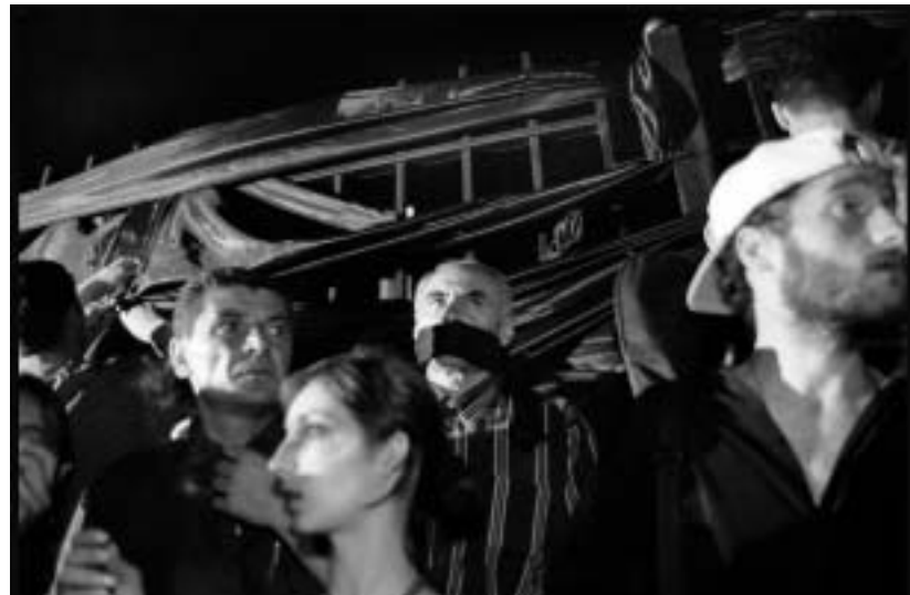
საპროტესტო აქცია გ. სანაიას მკვლელობის შემდეგ