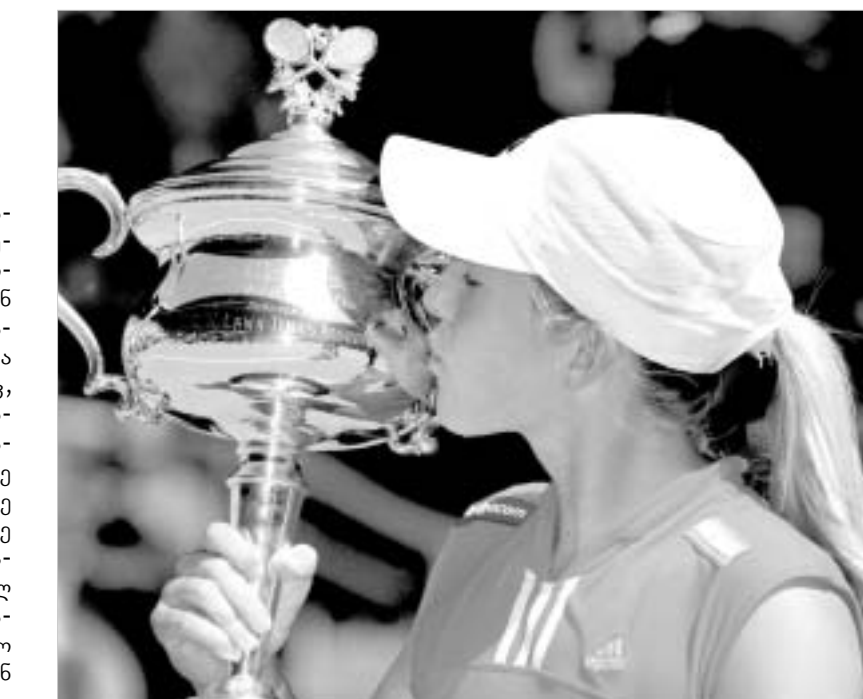
ენინ-არდენმა დიდი სლემის ტიტული მესამედ მოიპოვა.

მაყურებელი, ჰოუიტის თოსნობით, რომელიც ტრიბუნაზე სასიდედროსთან - ელსთან, გოლფის ცოცხალ ლეგენდა გრეგ ნორმანთან და საკუთარ მომზადებთან მოკალათებულიყო, მხურვალედ უჭერდა მხარს. მზარდაჭერამ, მართლაც, გამოიღო შედეგი, მაგრამ დროებით. კლიისტერსმა სეტი თავის სასარგებლოდ შემოაბრუნა და საქმე გადაწყვეტ, მესამე პარტიამდე მიიყვანა. მესამე სეტი კი ძალზე დრამატულად ნარიმართა. კლიისტერსმა გამარჯვებისკენ მიმავალ ენინ-არდენს ბევრი თავსატეხი გაუწინა და, ერთი მეტად საჩოთირო სათამაშო სიტუაცია რომ არა, ვინ იცის, როგორ წარიმართებოდა მოვლენები. საქმე ისაა, რომ დასკენი სეტში, კლიისტერს ანგარიშის გათანაბრება შეეძლო. ეკრძოდ, ერთ-ერთ ეპიზოდში გემიის მოგების ალანშიშნავად მაყურებელმა და კლიისტერსმა სიხარულიდან სხლეხელები აღმართეს, მაგრამ კომპიუტერის მსაჯმა, ფრანგმა სანდრა დენცენმა სხვაგვარად გადაწყვიტა და კლიისტერსის მიერ ენინ-არდენსკენ გადაგებული ბურთი ხაზს მიღმა დააფიქსირა. შესაბამისად, გემიი ჟუსტინის სასარგებლოდ გამოაცხადა. "რა თქმა უნდა, საწმუნაროა, მაგრამ დღეს მე უკეთ ვითამაშე, ვიდრე ადრეულ ფინალეებში. ამ შემთხვევასთან დაკავშირებით ვერავის დავადამაშაულე. თუმცა, მითხრეს, რომ ბურთი ხაზს მიღმა არ