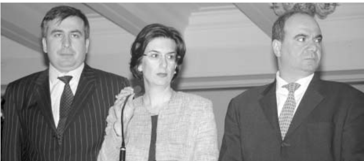
ტროშკინატი ერთიანობას ინარჩუნებს და საკონსტიტუციო ცვლილებებზე შეთანხმებას აპირებს.

მიხედვით სააკაშვილის განმარტებით, "კონსტიტუციური პასუხისმგებლობის მატარებელ მთავრობას პრეზიდენტი-მინისტრი უხელმძღვანელებს, რომელიც აღმასრულებელი ხელი-სუფლების ყოველდღეობის მმართველი იქნება, თავად პრეზიდენტი კი ძირითად მიმართულებებს განსა-