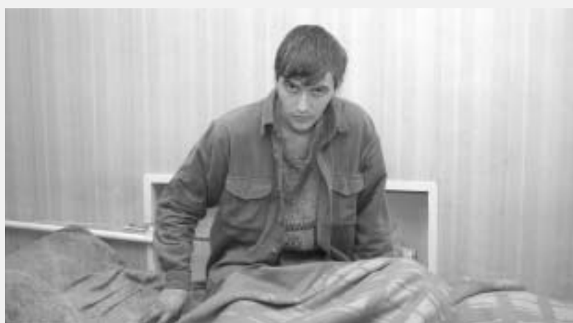
მამო ხალოუს ფოტო