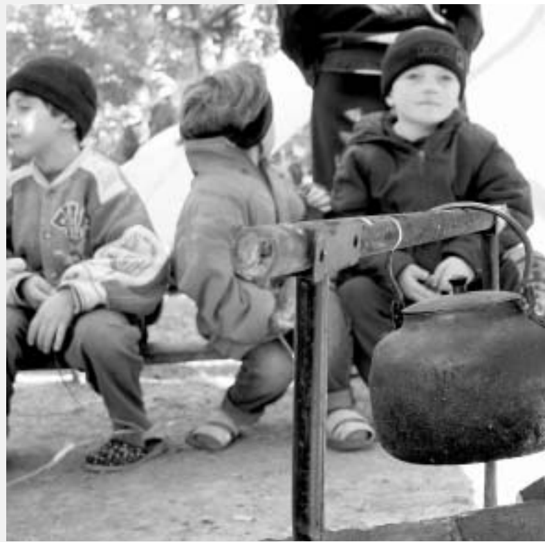
მამო ხალოუს ფოტო