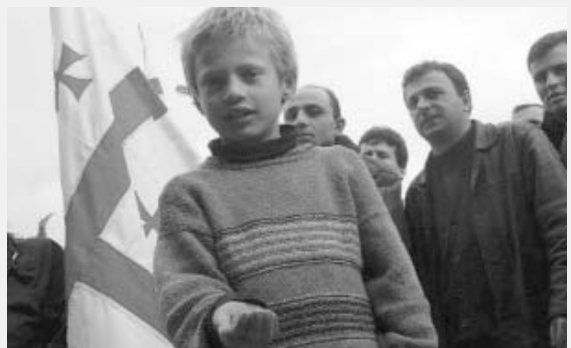
მამო ხალოუს ფოტო