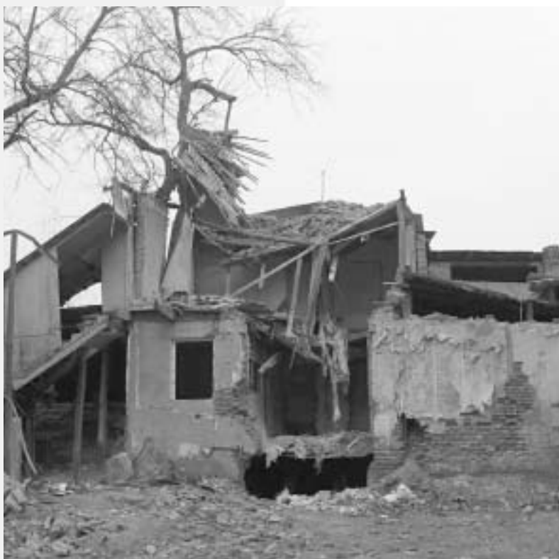
მამო ხალოუს ფოტო