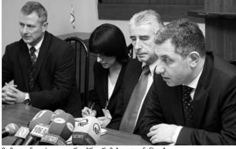
9 მილიონით სოციალური პროგრამები დაფინანსდება.

საქართველოს მთავრობამ მიიღო ბაქო-თბილისი-ჯეიჰანის მილსადენის კომპანის Btc co-ს საბრანდო პროგრამის პირველი ტრანში 9 მილიონი დოლარის ოდენობით. პროგრამის შექმნას საფუძვლად დაედო 2004 წლის 19 ოქტომბერს დადებული ხელშეკრულება, რომელსაც ხელს აწერენ Btc Co-ს აღმასრულებელი დირექტორი მაიკ ტაუზენდი და საქართველოს პრემიერ-მინისტრი ზურაბ ჟვანია. ხელშეკრულების თანახმად, საქართველოს მთავრობას 2010 წლამდე გადაეცემა 40 მილიონი დოლარი.