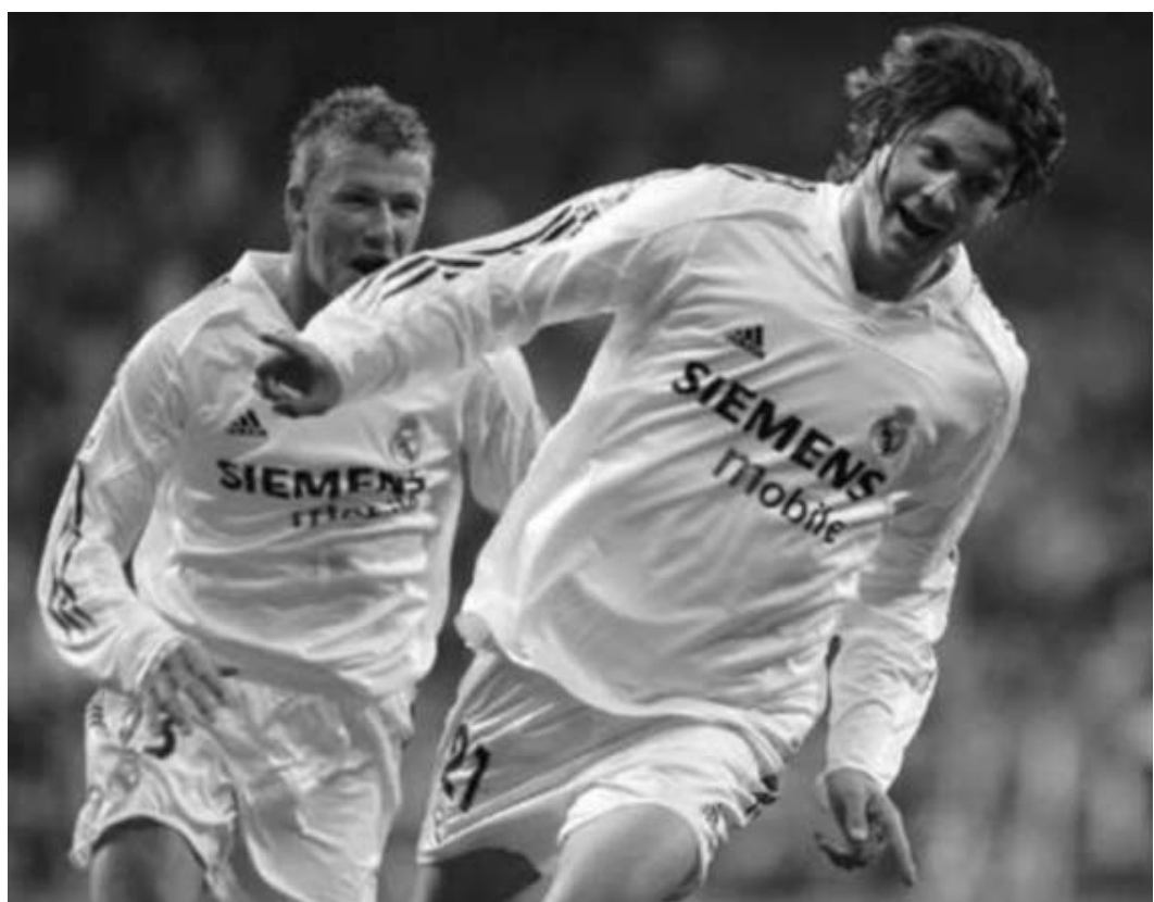
სანტიაგო სოლარი: „შე ძირითადი შემადგენლობის ფეხბურთელია მიმანჩია თავი“.

- ფიქრობ, აქ მოვლენების მთელი სერია იყო. ჩემი აზრით, მათ შორის მთავარი ის ხუთი წელია, რომელიც აქ გავატარე. ასევე ფუნდამენტური იყო გულშემატკივართა სიყვარული, რომელსაც ყოველთვის ვგრძობდი, როცა მინდობდა გამოვდიოდი. აგრეთვე გადაწყვეტი იყო თავად პრეზიდენტის სურვილი. კონტრაქტის გაგრძელებაზე ბევრმა სხვა ფაქტორმაც იმოქმედა. ჩემი ვარაუდით, კლუბი ასევე დაინტერესდა მთავარი მწვრთნელისა და სპორტული დირექტორის აზრით... ერთად აღებული ყველა ეს ფაქტორი განსაზღვრავს ახალი კონტრაქტის ხელშეკრულებას.