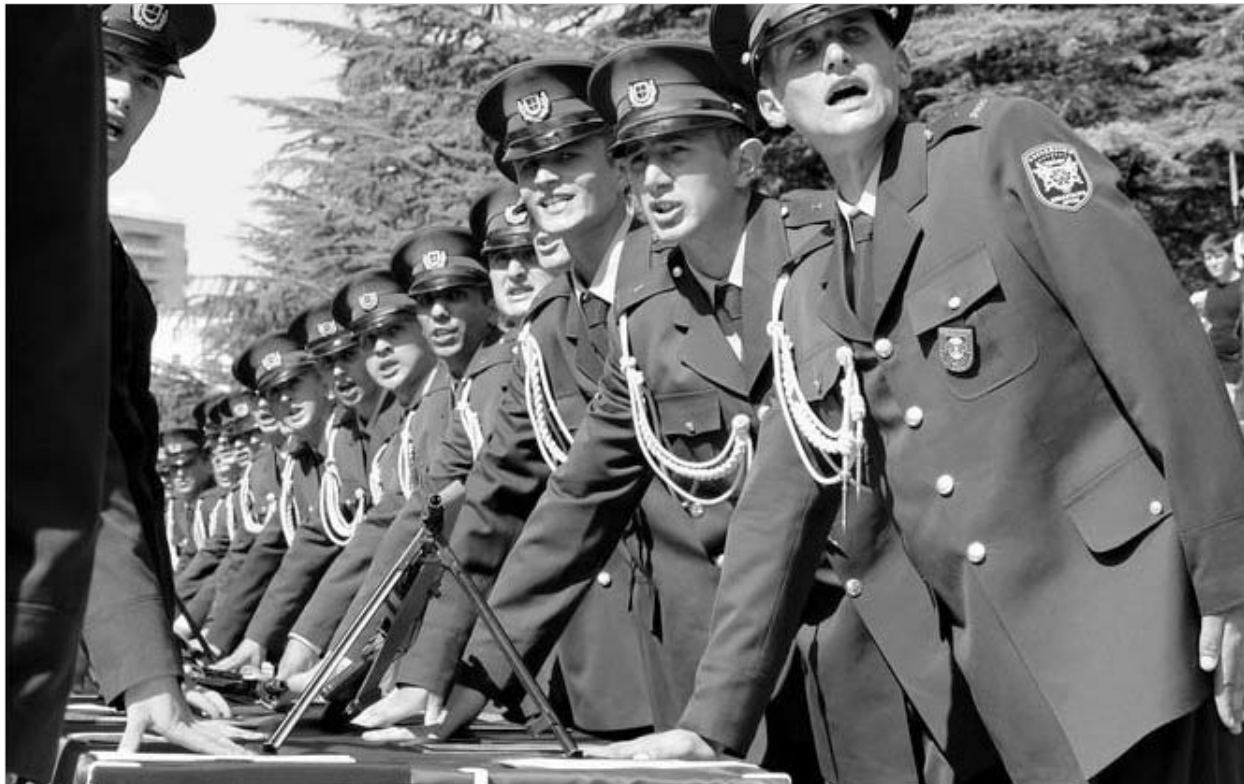
ფოცი თუ ცოციხი? - ამიერიდან არჩევანს წვევამდებლები გააკეთებენ

"სამოქალაქო სავალდებულო სამსახურის შესახებ" კანონპროექტის მიხედვით, სამხედრო და სამოქალაქო სავალდებულო სამსახურები სახელმწიფოს წინაშე ვალდებუ-