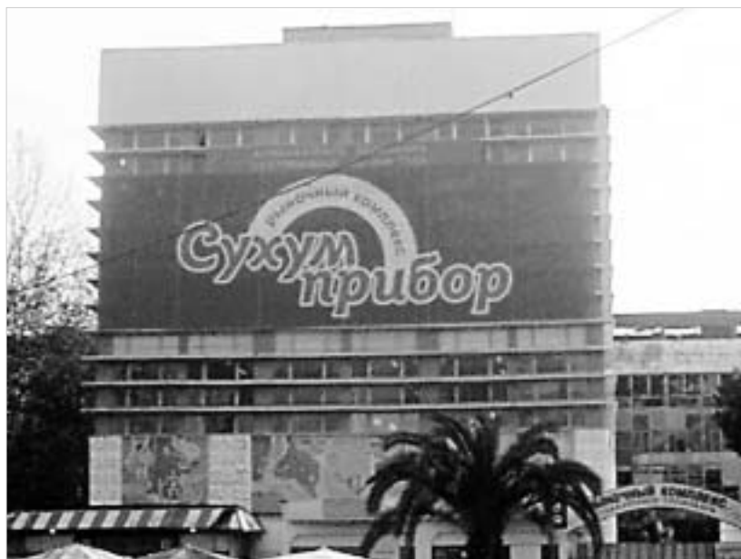
"Сухумирепуб"-ის შენობა - ლურჯად შეღებეს

- ბოლო 6 თვის განმავლობაში ისინი არჩევნებით იყვნენ დაკავებუ- ლი. მდგომარეობა დაძაბული იყო, პოლიტიკური ელიტა - გაყოფილი