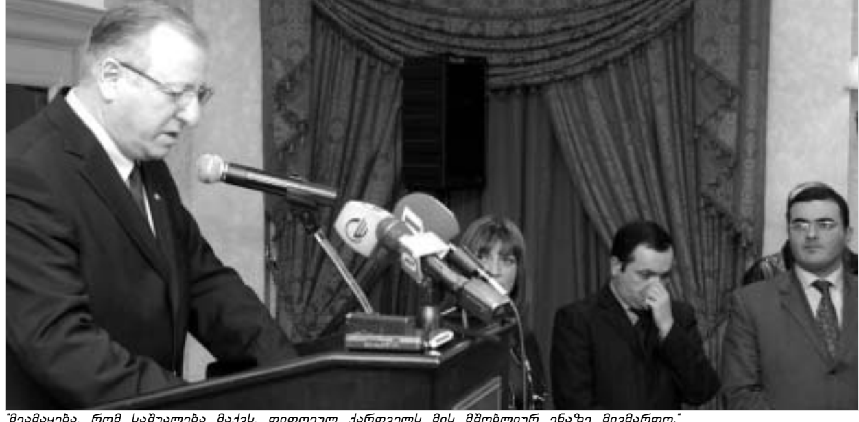
შაბთაი ცურმა, რომ საშუალება მაქვს, თითოეულ ქართველს მის მშობლიურ ენაზე მივმართო.

რთველებთან. გარდა ამისა, მიხარული ვარ იმის გამოც, რომ საქართველოში იმ დროს მიხდებოდა მოღვაწეობა, როდესაც ქვეყანა