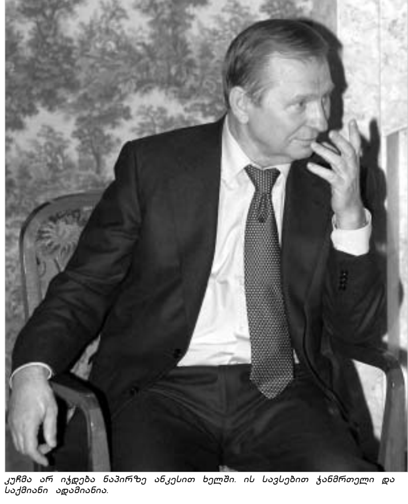
კურმა არ იქნება ნაპირზე ანკესით ხელში. ის სავსებით კანონიერი და საქმიანი ადამიანია.

სანამ უკრაინის პრემიერ-მინისტრის მოვალეობის შემსრულებელი იულია ტიმოშენკო კურმას სამართლებას შეუდგებოდა, ხელი-სუფლებამ კურმასთვის მუდმივი ჯამაგირის დაწესება მოასწრო. ლეონიდა კურმამ გაცვილებით მეტი ხარჯები გათვალისწინებული, ვიდრე უკრაინის პირველ პრეზიდენტს ლეონიდ კრავჩუკს თავის დროზე დაუწესეს. თანამდებობიდან გადადგარა კრავჩუკს თავიდან არც ტრანსპორტი ჰყავდა, აღარც ოფისი ჰქონდა. ექს-პრეზიდენტის გარანტიები რვა პუნქტს შეიცავს, რომელიც საიდუმლო სამთავრობო დადგენილებაშია ("ლეონიდა კურმას დაცვის, უზრუნველყოფისა და მომსახურების შესახებ") შეტანილი. ამ დადგენილების ხელმოწერა ყოფილი პრემიერმა ნიკოლაი აზაროვმა მოასწრო. დოკუმენტის თანახმად, კურმას ყოველთვიური ჯამაგირი ეკუთვნის, პრეზიდენტის ხელფასის ოდენობით. "კურმას საქმიანობის უზრუნველყოფისათვის" სამკაცრიანი (მრჩეველი და ორი თანამდებობა) აპარატი შეიქმნება. კურმას სამუდამო მფლობელობაში გადავა 72-ე სამთავრობო აგარაკი, რომლის ტერიტორიაც მრავალპეტატიანი ფართობზეა გადაჭიმული, კივიდან 25 კილომეტრში. აგარაკი უზრუნველყოფილია დაცვითა და მომსახურებით. ექს-პრეზიდენტს გამოეყოფა ორი ავტომობილი და ოთხი მძღოლი, აგრეთვე დაიცვის ქვედანაყოფი, რომელიც კურმას დაცვას უკრაინული კანონის "თანამდებობის პირთა სახელმწიფო დაცვის შესახებ" თანახმად, კურმასა და მის მუდმივ ლუდმივ მომსახურებას, ექს-პრეზიდენტის უფლებები უზრუნველყოფს. კურმასა და მის მუდმივ ლუდმივ მომსახურებას, ექს-პრეზიდენტის უფლებები უზრუნველყოფს. კურმას ტრანსპორტის ყველა სახეობით მიუღს უკრაინაში უფასოდ გადაადგილების უფლება აქვს, გარ-