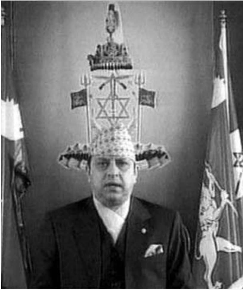
ნეპალის მეფე გიანენდრა.

ნეპალის მეფე გიანენდრამ ქვეყანაში საგანგებო მდგომარეობა გამოაცხადა და აღმასრულებელი ხელისუფლების უფლებამოსილებანი მანამდე გადაიბარა, სანამ მინისტრთა ახალი კაბინეტი არ იქნება ფორმირებული. მიღებული გადაწყვეტილების შესახებ ქვეყნადომებს მეფემ სატელევიზიო გამოსვლით აცნო. გადაყენებული მთავრობა, რომელსაც პრემიერ-მინისტრი შერ ბახადურ დეუბა ხელმძღვანელობდა, გიანენდრამ ქვეყანაში მშვიდობის აღდგენისა და საპარლამენტო არჩევნებისთვის მომზადების უზრუნველყოფის მიზნით განაგრძო. საპარლამენტო არჩევნები მიმდინარე წლის აპრილში დაგეგმილი. ყოფილი პრემიერ-მინისტრი გიანენდრამ ერთხელ უკვე გაათავისუფლა, კერძოდ, 2 წლის წინ, როცა დეუბამ ვერ შეძლო მანისტი ბოვიკების თავდასხმის აღკვეთა. თუმცა, გასულ წელს კვლავ აღადგინა თანამდებობაზე იმ პი-