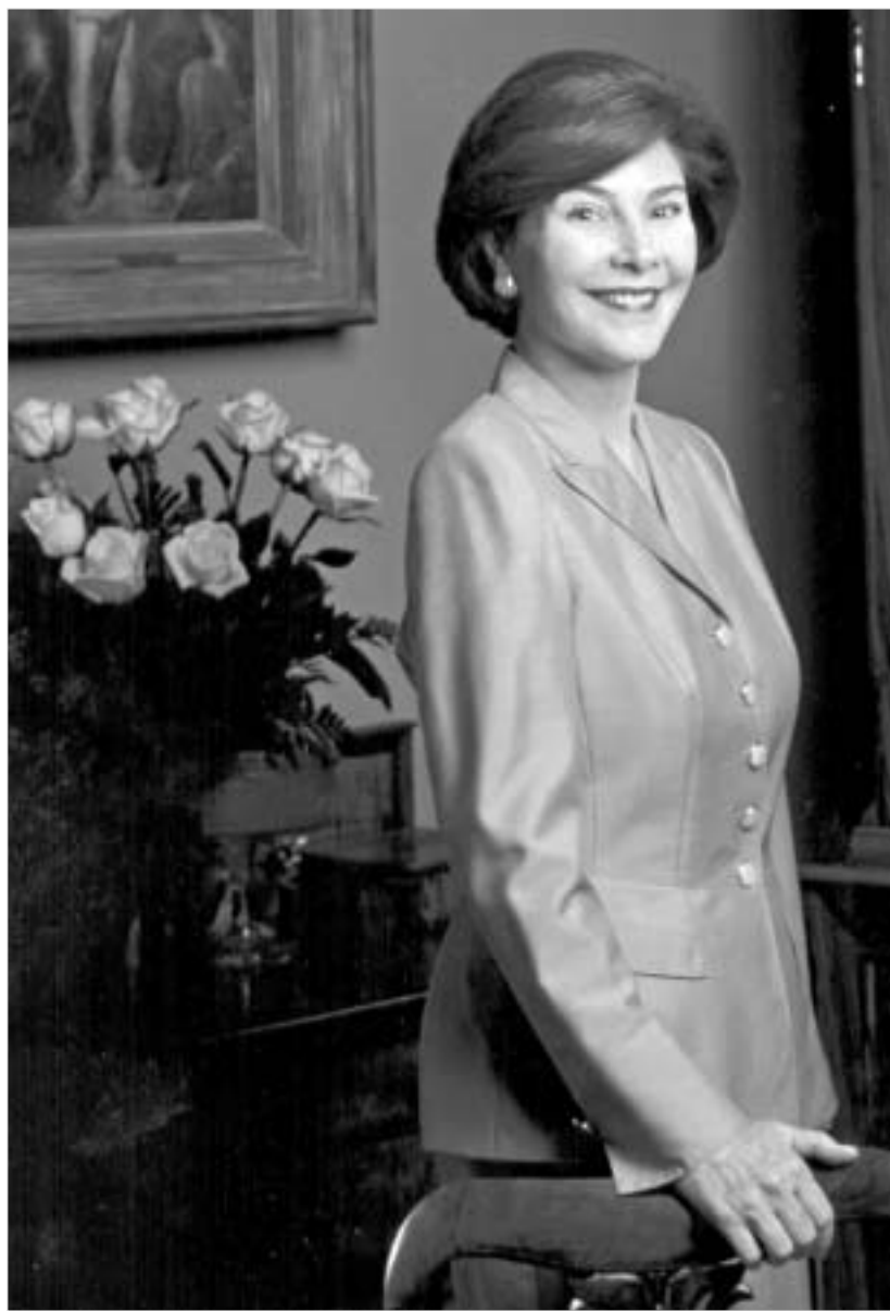
დახვეწილი ლორა ბუში.