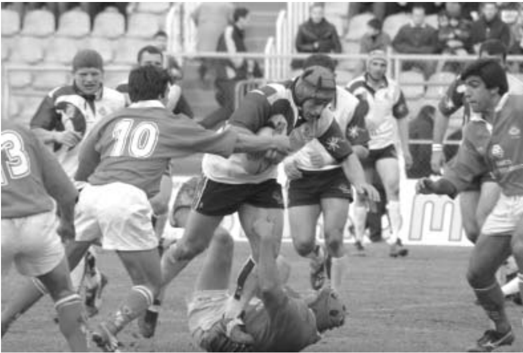
პორტუგალიასთან შარშანაც წაეავეთ და წელსაც

ოღ არ დასტვინა, ან არასწორად დასტვინა, მაგრამ, საეჭვოა, რაიმე სტუცილოიყო იმ სამ-ოთხ, თუნდაც ხუთ ეპიზოდში, სხვაგვარად, ანუ ჩვენს სასარგებლოდ რომ დაესტვინა. მეტოქე გავჯობნიდა ხელით თამაში, ფეხით თამაში, მოძრაობაში და, საერთოდ, ტაქტიკურად უფრო გამართულად თამაშობდა. ისმის უფრო ზუსტად, იტალიულ მსაჯებზე, რომლებიც წინა წლებში პორტუგალიასთან მატჩში აშკარად ჩვენს მეტოქეს სწყალობდნენ. იყო დრო, როცა ჩვენდამი სიმპათიაში ფრანგ მსაჯებს ადანაშაულებდნენ. განსაკუთრებით რუსები აქტიურობდნენ ხოლმე, მაგრამ ჩვენ ხომ ვიცოდით, რომ მათზე ძლიერები ვიყავით. ერთი სიტყვით, ეს ლაპარაკი გულის მოგახანს ჰგავს, რომელსაც საქმის რეალური ვითარებასთან საერთო არაფერი აქვს. მსაჯი რომ მასპინძლებს მიუდგებოდა, დიდი მიხვედრა არ სჭირდებოდა. მსაჯი, ყოველთვის თუ არა, უმეტესად მაინც, მასპინძლებს უდგება ხოლმე. უმაღლეს დონეზე ეს ერთგვარად შეფარვით ხდება, დაბალ დონეზე კი უფრო თვალშისაცემია. გაუშინნი იყო ეპიზოდები, როცა მსაჯმა საერთო