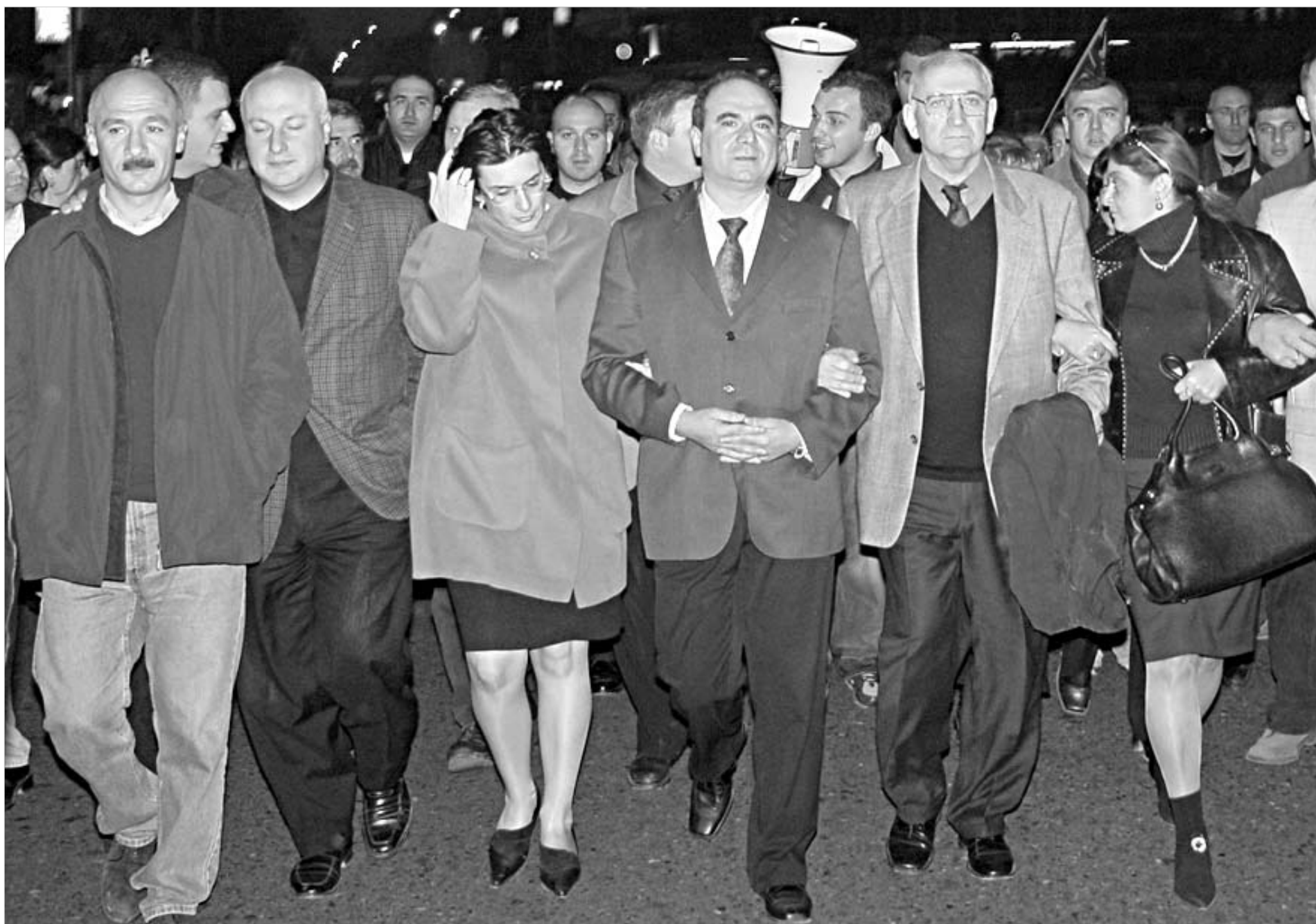
საქართველოს პოლიტიკურმა ელიტამ დაკარგა ბოლო დროის გამორჩეული ლიდერი.