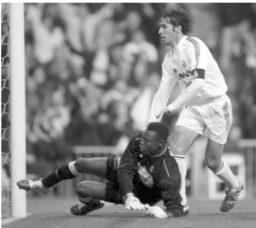
რეალი: “საფეხბურთო სამყაროში ხელშეუხებელი და შეუცვლელი არავინაა”

- რა თქმა უნდა. “ბარსელონა” დამარჯვებულად დამკვიდრდა პირველ ადგილზე. ამ დრომდე მათ ბევრი პრობლემა გადაიტანეს, მაგრამ, ამასთან, საჭირო შედეგს აღწევდნენ. ახლა მათ ჩემპიონობის საუკეთესო შანსი აქვთ, მაგრამ წინ კიდევ მთელი მეორე წრეა. ჩვენ კიდევ შევხვდებით ერთმანეთს, მაგრამ ახლა მხოლოდ იმ მატჩებზე ვფიქრობ, რომლებიც უახლოეს მომავალში გველოდება. თუ წარმატებულ სერიას განვაგრძობთ, შეიძლება, ბოლოს და ბოლოს, მათ სადმე ფეხი წამოქრათ. რაც არ უნდა გავაკეთოთ, ეს არის ის, რომ ქულები არ ვკარგავთ ქოთ. განსაკუთრებით “ზურნაბუზე”. - როგორ ფიქრობ, მათი თამაშის ხარისხმა დიქორა? - შესაძლოა, ახლა ისინი არცთუ ისე დამაზ ფეხბურთის აჩვენებენ, მაგრამ ევეტუტურად თამაშობენ და შედეგს აღწევენ. ჩემპიონის ტიტული კი სწორედ შედეგს მოაქვს. ჩვენ სტაბილურად უნდა ვითამაშოთ, ისაც კიდევ წრეში ვერ ვახერხებთ. ვიმედოვნებ, დარჩენილ ექვს თვეში ყველაფე-