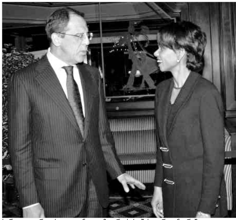
სერგეი ლავროვის და კონდოლიზა რაისის შეხვედრა ანკარაში.

რაისმა ანკარაში შეხვედრაზე რუსეთის მოუწოდებ, არა მარტო საერთო ტერიტორიაზე ეზრუნა დემოკრატიის გაძლიერებაზე, არამ-