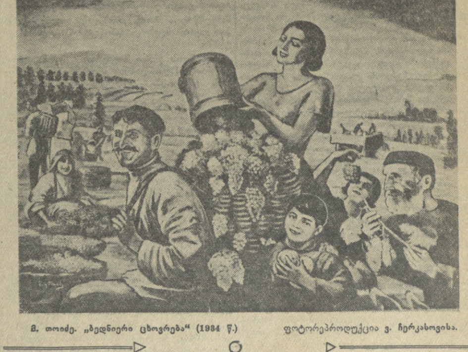
მ. თოიძე „ხედიური ცხოვრება“ (1984 წ.)

ფირე მუშაობას. მას ხშირად ნახავდით მოსპიტლებში, სადაც ჩვენს გვირ მეტროლებს არ აკლებდა ზრუნვას. მოდერნიზმის ტილოებით და აქტიური საზოგადოებრივი მუშაობით მ. თოიძემ მთელ საბჭოთა კავშირში საყოველთაო სიყვარული და აღიარება დაიმსახურა. ამ მხრივ დამახასიათებელია თვალსაჩინო რუსი მხატვრის, სტალინური პრემიის ლაურეატის შიშარინის სიტყვები, როცა მან მოსე თოიძის სურათების გამოფენა ნახა: „რა ბრწყინვალე ოსტატი ყოფილა ჩვენი ძვირფასი მოხუცი“. ჩვენი ფილიალის სურათები, რომელიც გამოფენილია ქართული სახეობის ხელოვნების მუზეუმის ნათელ დარბაზებში, სურულ წარმოდგენას გვიამაჟებს ამ შესანიშნავი ოსტატის შემოქმედებაზე და სიამაყის გრძობით აფასებს ჩვენს ველს. უესსურეთ ჩვენს მსტოვან, მაგრამ მარად ახალგაზრდა მხატვარს კიდევ მრავალი წლის შემოქმედებით ენერჯია და ნაყოფითი შრომა ჩვენი ხალხის ხელოვნების განვითარებისა და წინსვლისათვის. თამარ აბაქელია, ხელოვნების დამსახურებული მოღვაწე.