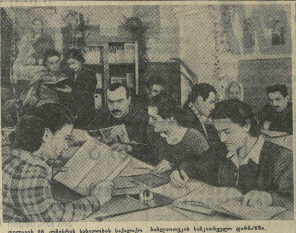
თელავის 26 კომისიის ხაზგადაღობის საქალაქო ბიბლიოთეკის სამკითხველო დარბაზში.