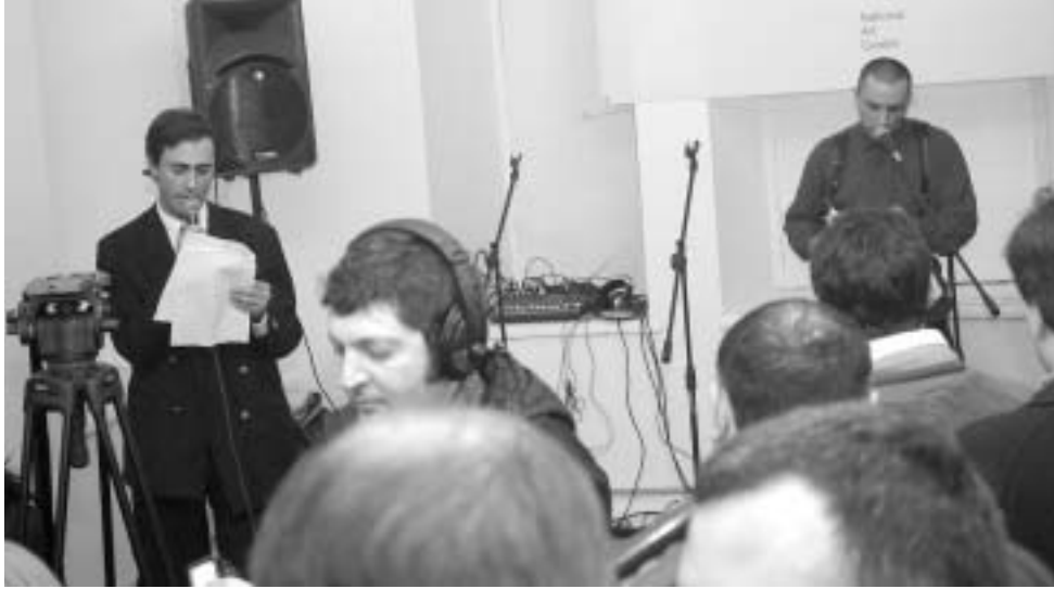
ხელოვნების ნაციონალური ცენტრის გახსნაზე.

ლოდ წლების მანძილზე იქ ჩამოყალიბებული ტლანქი სტრუქტურის ბრალად.