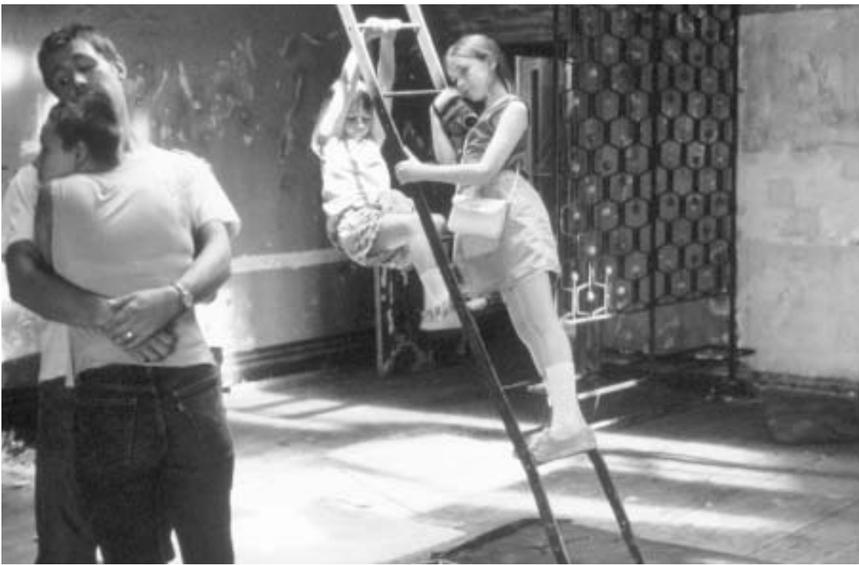
ირლანდიელები ამერიკაში. კადრი ტომ შერიდანიის ფილმიდან.