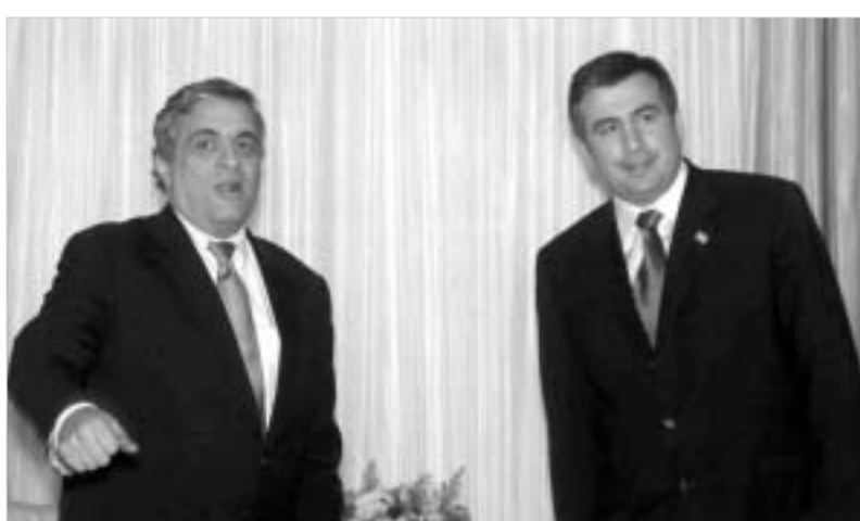
ტენტი მონარულია საქართველოს პრეზიდენტთან შეხვედრის.