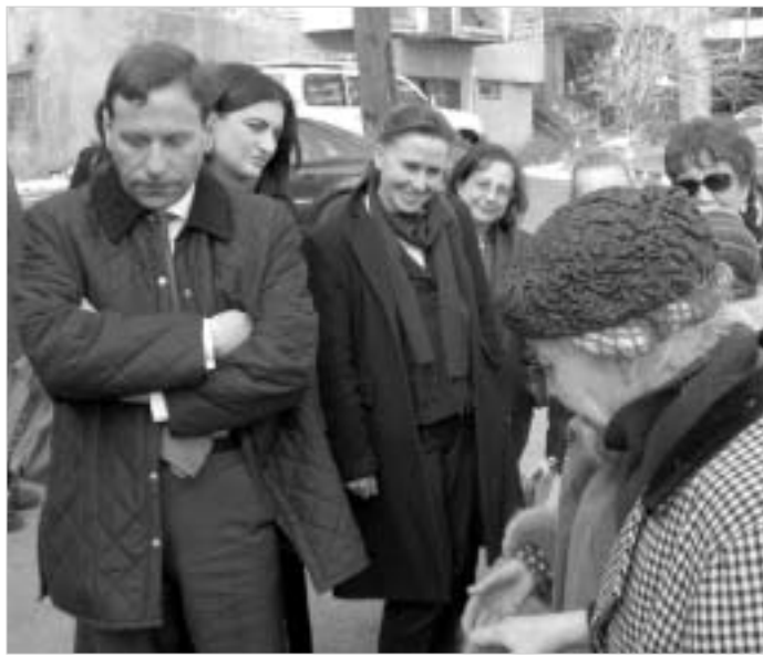
იტალიელთა დელეგაცია სამგორის ბავშვთა სახლში.

სამგორის რაიონის მიუსაფარ ბავშვთა სარეაბილიტაციო ცენტრ "სასოებისა" და მთაწმინდის რაიონის უფასო სასადილო "ვიქტორიას" გუშინ იტალიის ელჩი ფაბრიციო რომანო და გაერთიანებული სამეფოს პროგრამის წარმომადგენელი საქართველოში, პიპა რედფორდი ესტუმრნენ. მათ ამ დაწესებულებებს იტალიური ფქვილი და შაქარი გადაცეს.