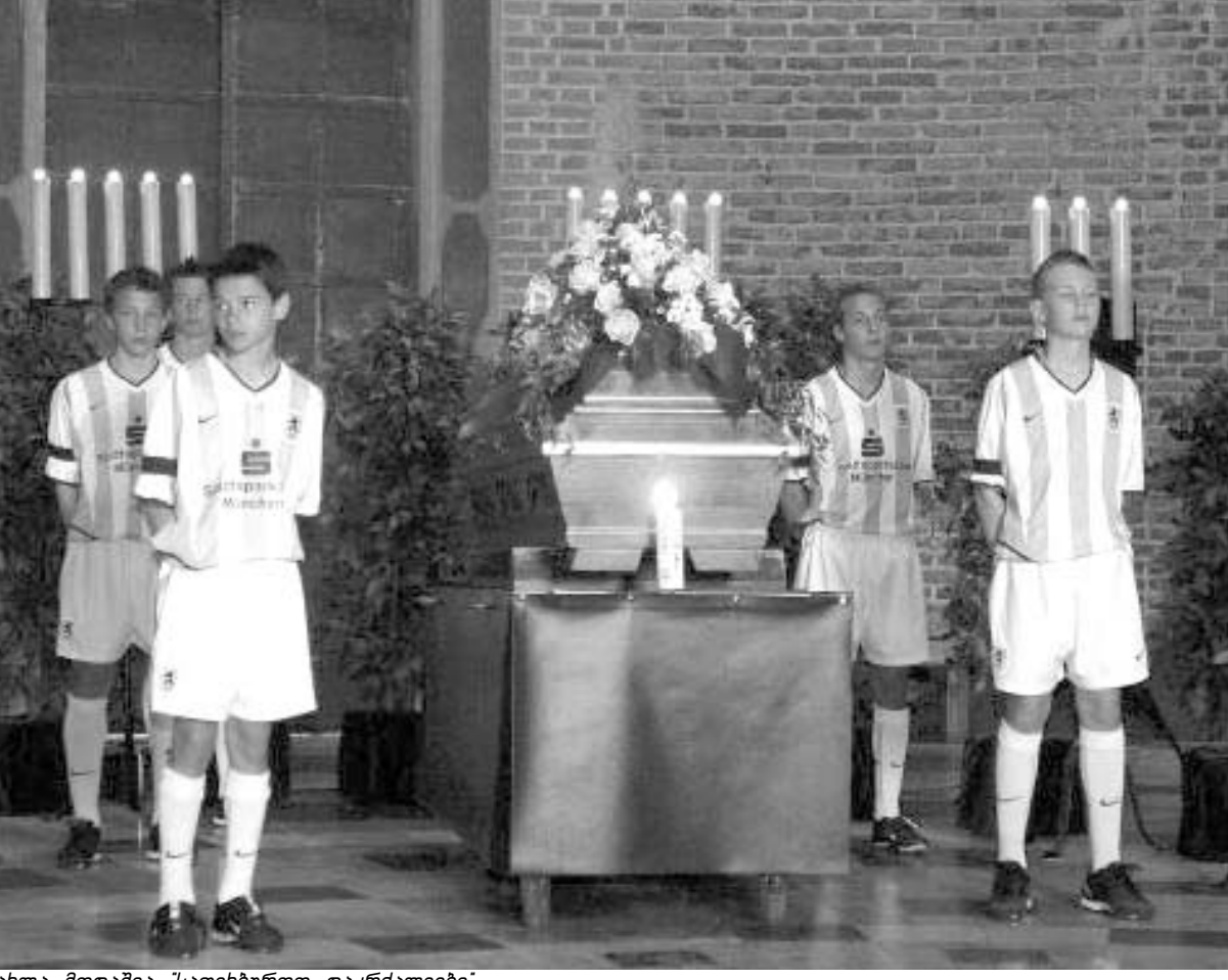
ახლა მოდამია "საფეხბურთო დაკრძალვები"