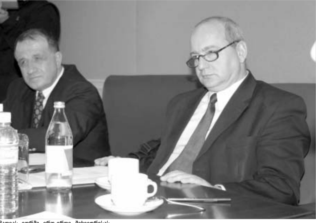
მათიას იორში ერთ-ერთი შეხვედრისას.

თავარ ხორბალაძე ევროსაბჭოს წინასაარჩევნო დამკვირვებელთა მისია მათიას იორშის ხელმძღვანელობით საქართველოში სამშაბათს, საღამოს ჩამოვიდა. მათიას იორში პირველივე კომენტარით იმის თაობაზე, რომ "შოკშია რეკომენდაციების შეუსრულებლობის გამო", შოკში ჩავიდო საქართველოს დღევანდელი ხელისუფლება და გარკვეული კოზირები მისცა ოპოზიციას. უკვე გუშინ მათიას იორში ჟურნალისტებთან საუბარში აცხადებდა, რომ არ ახსოვს, იმხარა თუ არა საუბარში სიტყვა "შოკი", თუმცა სიტყვითი შემოთავაზება. "24 საათის" ინტერვიუ ბატონ იორშთან პრესასა და არასამთავრობო სექტორის წარმომადგენლებთან შეხვედრის შემდეგ შედგა - ხელისუფლებისა და ცენტრალური საარჩევნო კომისიის წარმომადგენლებთან შეხვედრამდე.