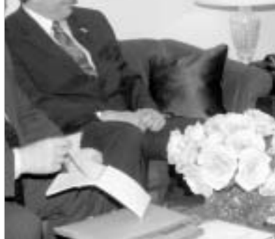
საუბარი კონდოლიზა რაისთან.

სახელმწიფო მდივანმა დადებითად შეაფასა საქართველოს ძალისხმევა, დაამყაროს რუსეთთან კეთილმეზობლური ურთიერთობა და განავითაროს თანამშრომლობა სხვადასხვა სფეროში. შეხვედრაზე კოლინ პაუელმა ყურადღება გაამახვილა ერაცის სტაბილიზაციასა და ამ პროცესში საქართველოს მონაწილეობის მნიშვნელობაზე. მან კიდევ ერთხელ განაცხადა, რომ ამერიკა საქართველოს ერთგული მეგობარია.