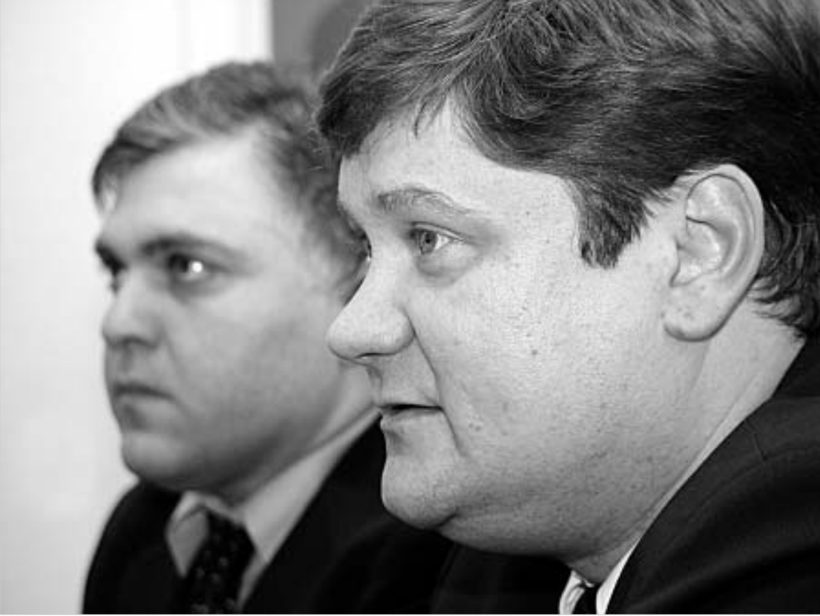
მიკოლაიუნასი თბილისის გამრიცხველიანებას გააგრძელებს.

"თელასში" მიჩნევენ, რომ გსეკ-ის მიერ მიღებული გადაწყვეტილება იმპორტის შეზღუდვის თაობაზე თბილისისთვის არასახარებელია. საეკონომიკური კონსტრუქციის განხორციელების მიზნების მიხედვით, რადგან სურვილი და შესაძლებლობა, ჩვევ გრადიუზე არ ვთანხმდებით," - აცხადებს