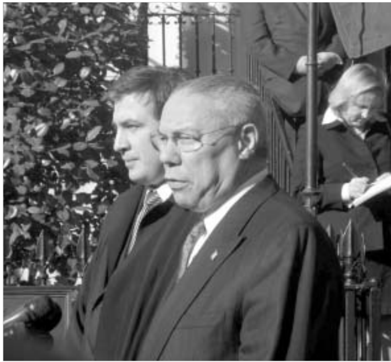
კოლინ პაუელი კვლავ ადასტურებს, რომ ამერიკა საქართველოს მეგობარია.

ვაშინგტონიდან ნიუ-იორკში გამგზავრების წინ, საქართველოს პრეზიდენტი მიხეილ სააკაშვილი ამერიკის შეერთებული შტატების სახელმწიფო მდივანს კოლინ პაუელს შეხვდა. საუბარი შეეხო საქართველოსა და ამერიკის მიმართ თანამშრომლობას როგორც უსაფრთხოების სფეროში, ასევე დემოკრატიისა და პოლიტიკის საკითხებში. მიხეილ სააკაშვილის თქმით, საქართველოს წვლილი შეაქვს საერთაშორისო ტერიტორიების წინააღმდეგ ბრძოლაში და ის ამით ამაყობს. საქართველოს პრეზიდენტმა განაცხადა, რომ მალე ერაცში ქართული სამხედრო კონტინგენტის შემადგენლობა გაფართოვდება.