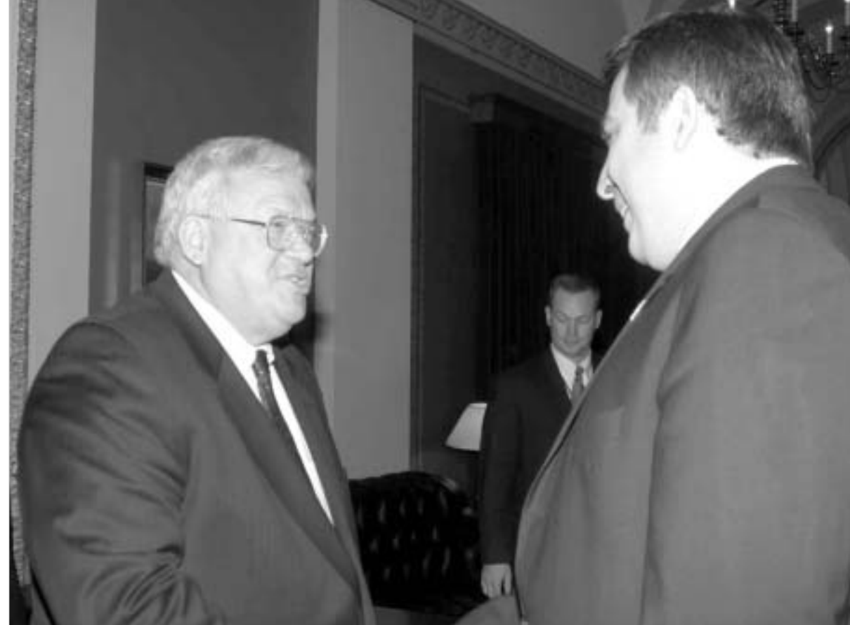
დენის პასტერტი და მიხეილ სააკაშვილი.

"ასეთი სოლიდური დახმარება უპრეცედენტო ფაქტია. კონგრესთან მოლაპარაკებას მაინც ვაგრძელებთ, რათა ჩვენთვის მნიშვნელოვანია, რომ ეს თანხა კიდევ უფრო გაიზარდოს. გამოყოფილი დახმარება საქართველოში ცალკეული ინსტიტუტების გაძლიერებას, ენერჯეტიკის განვითარებას, პოლიციის რეფორმასა და მძლავრი ქართული ჯარის ჩამოყალიბებას მოხმარდება," - განაცხადა მიხეილ სააკაშვილმა.