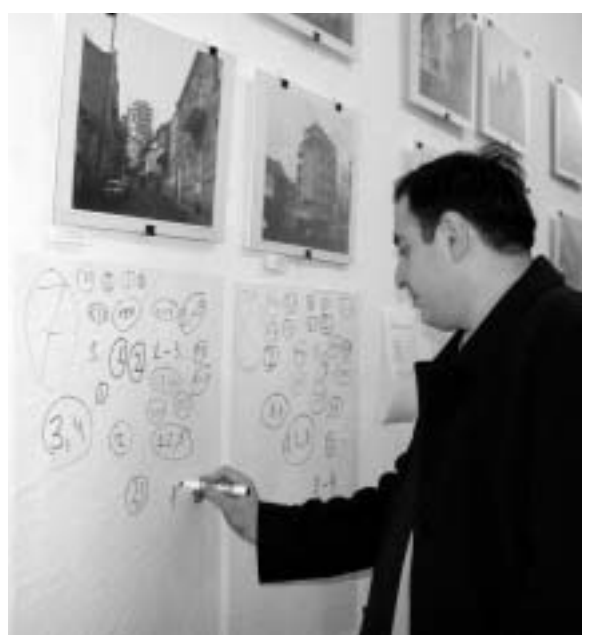
გამომსვენებელი და შემფასებელი

თბილისში, მოახლოებული "ოს- კარის" ნომინაციებზე არანაკლებ საინტერესო ნომინაციებს გამოაფ- ლენენ, ასევე არანაკლებ ნაზრულ კონკურსზე: ავირჩიოთ ცუდიდან ყველაზე ცუდი. არჩევანი დამთეა- ლიერებულმა უნდა გააკეთოს. დამ- თვალერებელი გამოფენის აქტიუ- რი მონაწილეა. არ გვერით რომე- ლიმ კონცეპტუალისტი მხატვრის გამოფენაზე გესაუბრებოდეთ. ექს- პოზიციის ავტორი საზოგადოება გახლავთ. ნამუშევრების დამკვეთი და შემსრულებელი - ისევ და ისევ საზოგადოება. ერთი სიტყვით, ეს თბილისის დღევანდელი არქიტექ- ტურაა და ის გარემოა, რომელშიც ჩვენ უსახორობთ - ასეთი უმასტა- ბო, უსახური, აგრესიული და უსტა- რული.