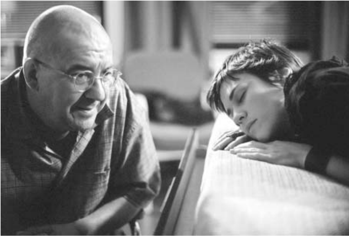
“ოსკარის” ერთ-ერთი ფაგორიტი. დენის არკანის “ბარბაროსული შემოტევა”

გუშინ ამერიკა “მოგებულის” პოზიციიდან ეგუებოდა იმ ფაქტს, რომ გლობალიზაციის ერთ-ერთი მთავარი მიზეზი და შემოქმედი თვითონ არის. დღეს კი ამწვეს, რომ ამერიკული ღირებულებების უკიდურეს პოპულარიზაციას უკუ-ეფექტიც მოჰყვა. ნაცნობი და იოლად წარმოსათქმელი სახელისა და გვარის – ბრედ პიტის ნაცვლად მოკრებ ავჰდამლოს სწორად წარმოთქმაზე უნდა იმტვიროს ენა; ასევე ნაცნობი და საყვარელი ტომ კრუზის მაგივრად კი დიონ ჰონსოსთვის უნდა შემოინახოს კეთილგანწყობა. ერთი სიტყვით, პოლიფუნქციური იპრობს. როდესაც იანვარში “ოსკარის” ნომინანტთა ენაობა გამოქვეყნდა, აღმოჩნდა, რომ სია სავეყ იყო უცხოელი მსახიობებით, რეჟისორებითა და სცენარისტებით.