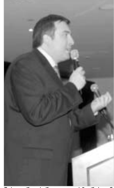
შეხვედრა ქართულ დიასპორასთან.

მიხეილ სააკაშვილი დაპირდა მათ, რომ საქართველოში მალე ცხოვრებისა და მუშაობის სათანადო პირობებს შექმნის და ყველას სამშობლოში დააბრუნებს. "ლუკმა-პურის მოსაპოვებლად უცხო ქვეყანაში გაუსადილო შრომა, ისეთი ნიჭიერი, შრომისმოყვარე ხალხისთვის, როგორებიც ქართველები არიან, სრულიად მიუღებელია. მოვა დრო, როცა ყველანი დაუბრუნდებით მშობლიურ მხარეს და თითოეული თქვენთაგანი ღირსეულ ადგილს, სწორედ, საქართველოში დაიმკვიდრებს," - აღნიშნა მან.