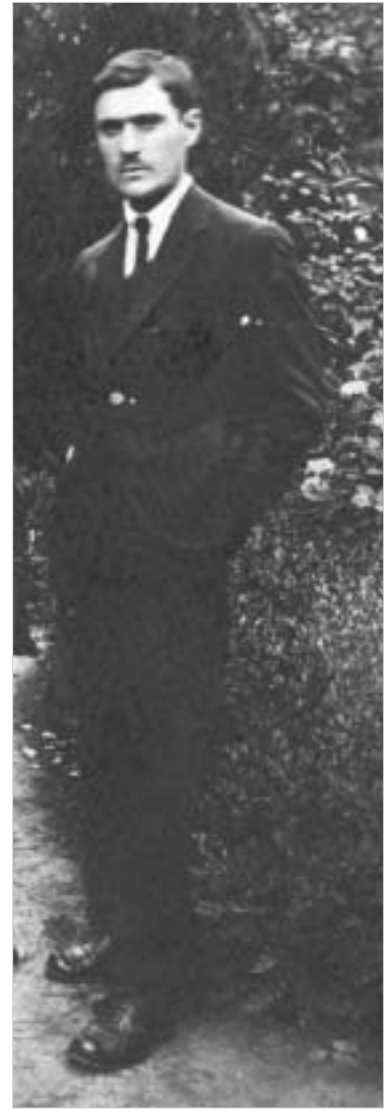
ლადის ხვედრი, იგი მივიწყებული და გარიყული გარდაიცვალა.