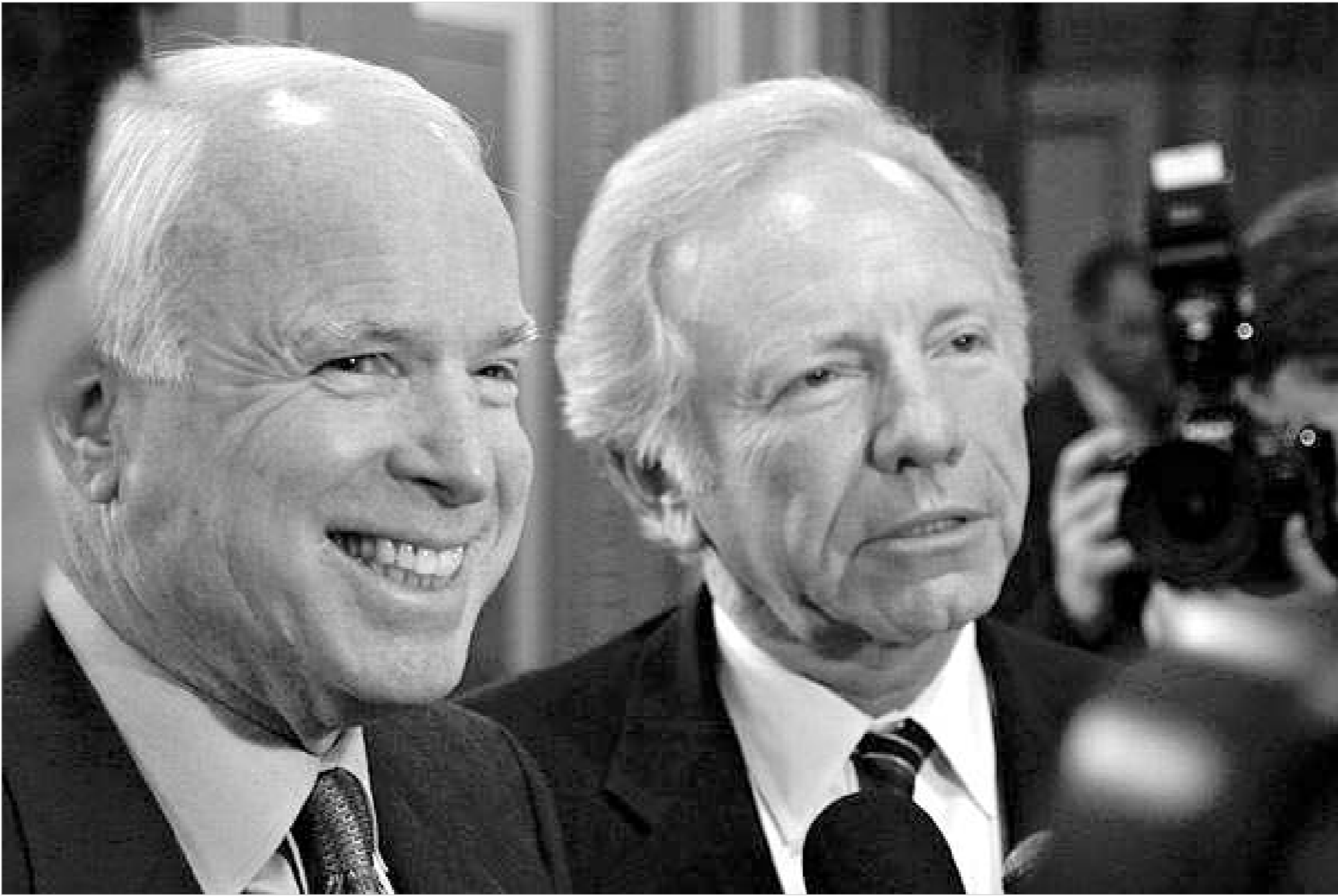
სენატორები ჯონ მაკკეინი და ჯო ლიბერმანი.