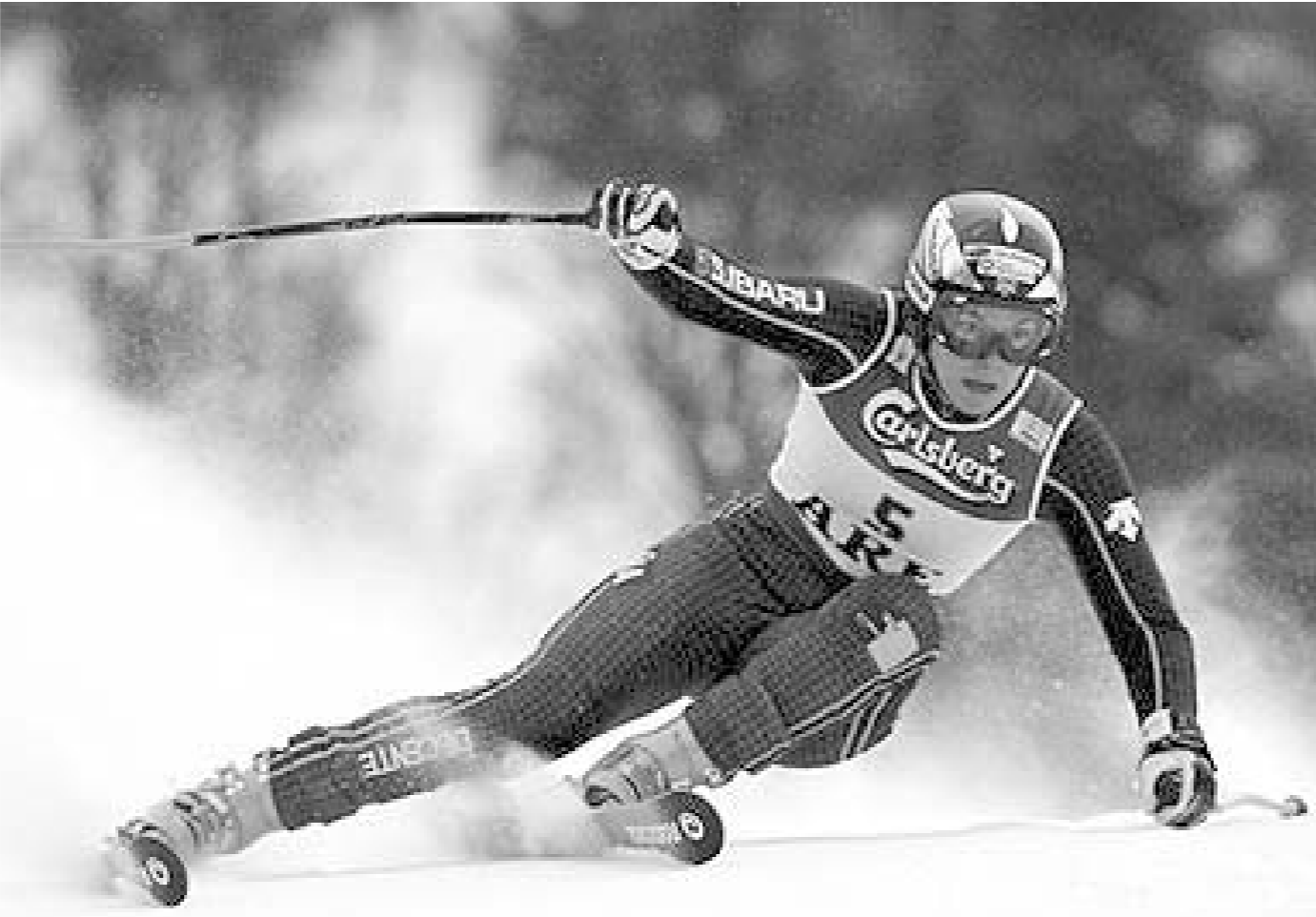
ესპანელმა რინდამ მსოფლიო თასზე ნაესი გატეხა

ჩემპიონატის დასაწყისშივე ფიქრობდნენ, რომ პირველობა ერთი ადამიანის წარმოდგენას დაემსგავსებოდა. ეჭვი მას შემდეგ უფრო გაძლიერდა, რაც ბოდე მილერმა პირველივე დისციპლინაში - სუპერგიგანტში გამარჯვებას დაშვებში ტრიუმფიც დაურთო. თანაც, მეტად პრესტიჟულ სახეობაში - დაშვებში. ამერიკელისთვის გამარჯვება იმითაც იყო მნიშვნელოვანი, რომ ის აღმოჩნდა პირველი ამერიკელი, რომელმაც უსწრაფეს სახეობაში სამთოთხილამურო ჩემპიონობა მოუტანა. როდესაც მსოფლიო ჩემპიონატზე კომბინაციის ჯერი დადგა, 27 წლის ამერიკელისადმი ზოგში ინტერესმა, ზოგში კი შიშმა იმძლეა, რისი საფუძველიც ამჟამად