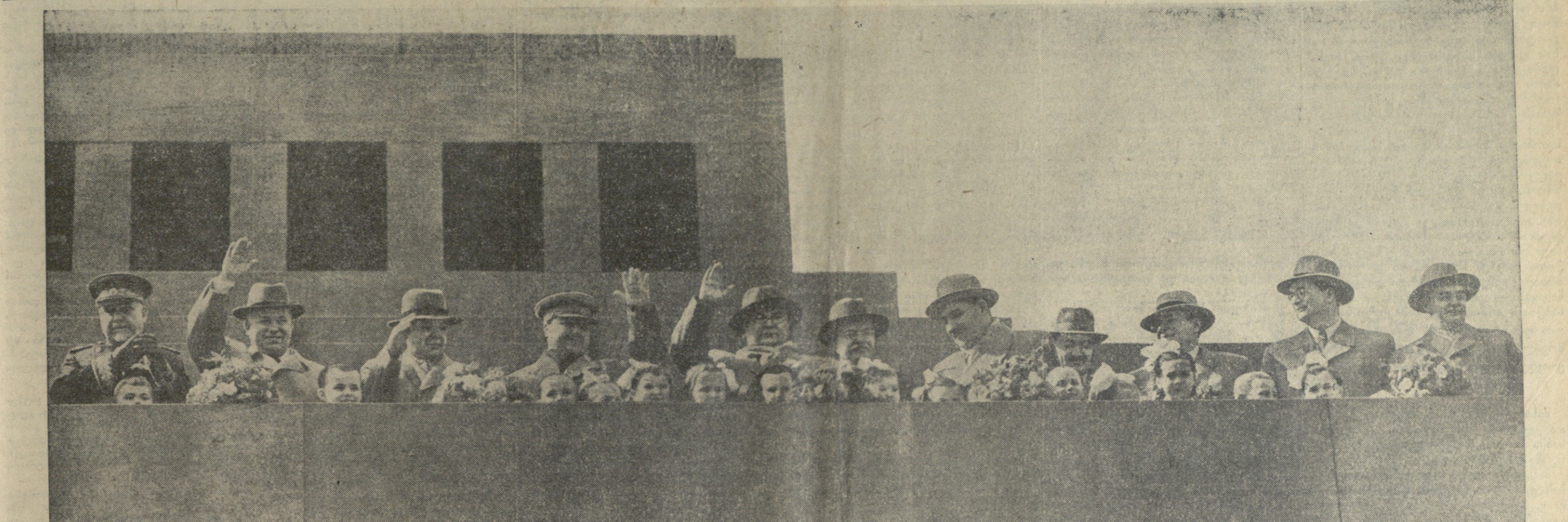
მავზოლეუმის ტრიბუნაზე 1953 წლის 1 მაისს. მარცხნიდან მარჯვნივ: ამხანაგები ნ. ა. ბულგანინი, ნ. ს. ხრუშჩოვი, ჯ. ი. ვოროვილოვი, ზ. მ. ბაქია, ვ. მ. მოლოტოვი, ლ. მ. კაბანოვი, ა. ი. მიკოიანი, მ. ზ. საბუროვი, მ. ზ. პერესტრინი, მ. მ. ვაშინიკი. პარტიისა და მთავრობის ხელმძღვანელებთან არიან ბავშვები, რომლებმაც მათ ყვავილები მიართვეს.

საბჭოთა კავშირის მშრომელებმა ზეიმით აღნიშნეს 1 მაისი — მშრომელთა საერთაშორისო სოლიდარობის დღე, ყველა ქვეყნის მუშათა ძმობის დღე. საბჭოთა ადამიანებმა ახალი ძალით ცხადვეს თავიანთი ერთიანობა, თავიანთი დარაზმულობა საბჭოთა კავშირის სოციალისტური პარტიისა და საბჭოთა მთავრობის გარშემო, თავიანთი მტკიცე მისწრაფება — იარონ წინ, კომუნისტებისაკენ!