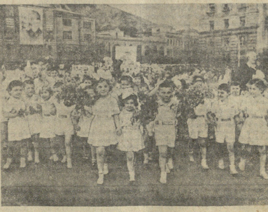
თბილისი, 1958 წლის 1 მაისი. ბავშვები ტრიბუნის წინ.

მოედანზე ერთმანეთს ევლიდნენ ნავსადგურის, მანქანათმშენებლის, მომთხრობელი და სხვა ქარხნების, სამკერავლო, ფეხსაცმლის, ობიექტის და სხვა საწარმოთა კოლექტივების ხალხმრავალი კოლონები.