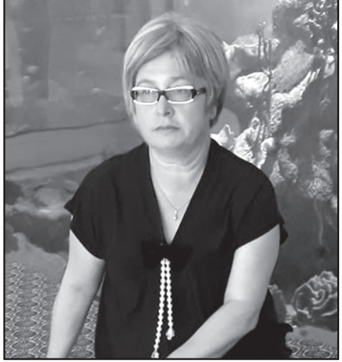
პრობლემების გამო. იმედი მაქვს, მისი მხარდამჭერები დაუჯერებენ ბატონ ბიძინას და ყველა სუნდატესავით არ აჯანყდებიან.

– ბიძინა ივანიშვილი ხომ მუდმივად გვაყვედრის იმას, რაც გავიკეთა. მე ქველმოქმედება ვიცი ისეთი, ილია ჭავჭავაძემ რომ გვასწავლა: მაღლი ქენი, ქვაზე დადე და გაიარო. ასეთი ქველმოქმედები გვაყავდა ჩვენ, ქართველებს. ამ კაცმა თავისი კამპიანის ნაწილი მართლაც მოახ-