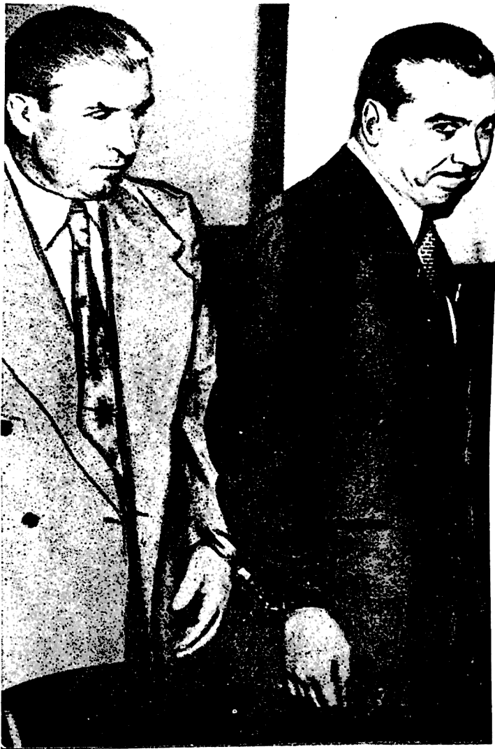
პოლიციელს აღონისი შეჰყავს სასამართლო დარბაზში