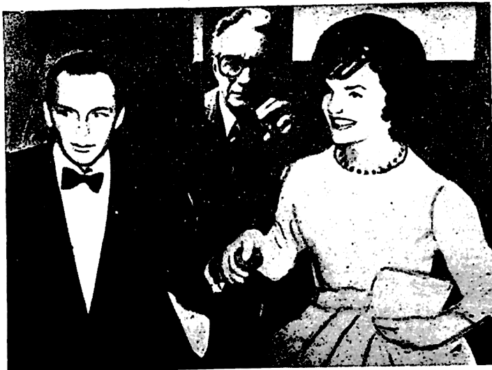
ფრენკ სინატრა და უაკლინ კენელი ოეატრ ვესტჩესტერში პრემიერის შემდეგ