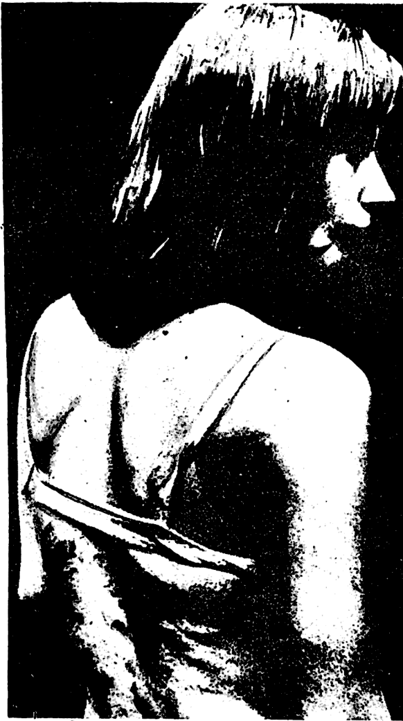
ქალი, რომელსაც საროსკიპოდან გაქცევისათვის გაუსწორდა მაფია