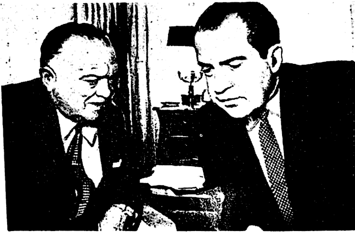
გამოძიების ფედერალური ბიუროს უფი ჯონ ედგარ ჰუვერი რიჩარდ ნიქსონთან ერთად