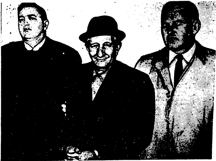
ლეგენდარული „ნაოლია“ გამბინო გამოძიების ფედერალური ბიუროს აგენტებმა დააპატიმრეს 1973 წელს