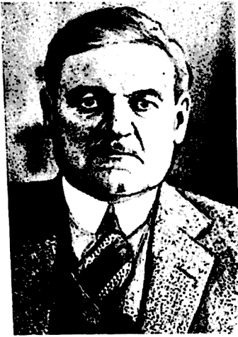
ჩიკაგოს მერი უილიამ ე. დევერი