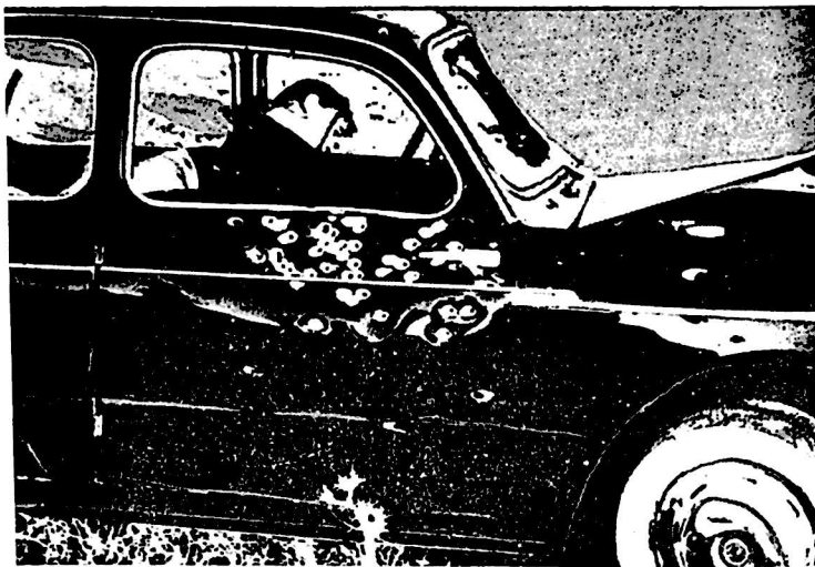
„ნათლია“ ნაჟარას სიკვდილი