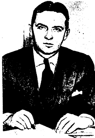
მოსუხიძველი პოლიციელი ელიოტ ნესი