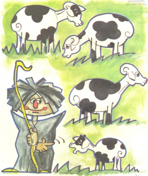
რომელია ამ ბატკნის დედა?