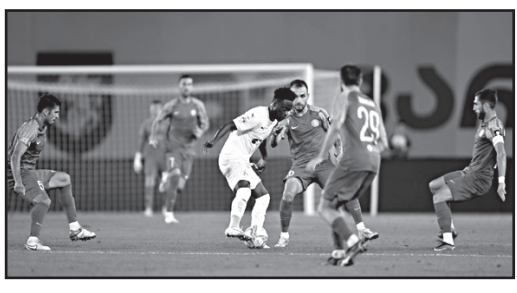
ლი 84), შონიკაშვილი, ლონიკაშვილი (გამამაგევიშვილი 75), ტაბატაძე, გულიაშვილი, გოშთელიანი (სიხარულიძე 64)

ვილი 87), შონია, დაფე (ლომინაძე 57), მაქაჯარია (ლომინაძე 87) დინამო: კუტალაძე, მალი (მაისურაძე 90), კალანდაძე, ტაბიძე, კობოჭი, მოისონაფიშვილი (ოსიკაშვილი 46), მეჭვინიშვილი, იმრაძე (ბარსნი 46), თ.კირიკიძე, კამარა (კუცია 90), სხირტლაძე (ხვადაგიანი 68) გაძეგება: კირიკიძე (6), ნოზაძე (74) დინამომ ანზორ მეჭვინიშვილის გატანილი საჯარიმო დარტყმით სძლია გავრას. გოლი 50-ე წუთზე გავიდა. ეს მეჭვინიშვილის მეოთხე გოლია სეზონში და აქედან ორი გაგრას გაუტანა. არადა, დინამოელები მე-6 წუთიდან 10 კაციტ თამაშობდნენ თორნიკე კირიკიძის გაძეგების გამო. მოუდნებ რიცხოვრებით თანაფარდობა 74-ე წუთზე აღდგა, როდესაც გავრასაც გაუძეგეს ლუკა ნოზაძე, მაგრამ დინამო მანამდე იგებდა. დინამო თბილისსა ზედღებ 7-ჯერ იმარჯვა, მეორე ადგილზეა და ერთი ქულით ჩამორჩება ლიდერ ბათუმელებს, ხოლო გავრა მეცხრეზეა და ექვი ტურია არ მოუგია.