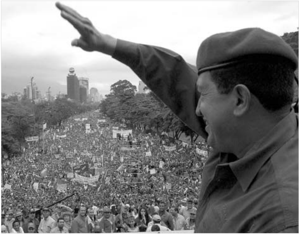
ჰუგო ჩავესი: მე არისტოკრატ არ ვარ.

"ვენესუელის მოქალაქეებს მშვიდობიანი წინააღმდეგობისკენ მოუწოდებთ," - აცხადებს ოპოზიციის ლიდერი ენრიკე მენდოზა. "ეს ბრძოლა, სადამდეც საჭიროა, იქამდე გაგრძელდება," - დამოძღვრა თავისი მხარდამჭერები მენდოზამ კარაკასში გამართული დემონსტრაციის დროს. "ნახვამდის, არსიტდი! ჩავეს, ახლა შენი რიგია!" - ასეთია ჩავესის ოპოზიციის მთავარი ლოზუნგი. თუმცა, ვენესუელის პრეზიდენტი მტკიცედ აცხადებს, რომ ის ბოლომდე ბრძოლებს და აღუდგება მისი დამხობის ნებისმიერ მცდე-