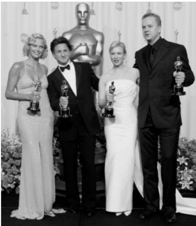
მთავარი "ოსკარების" მფლობელი ოთხეული