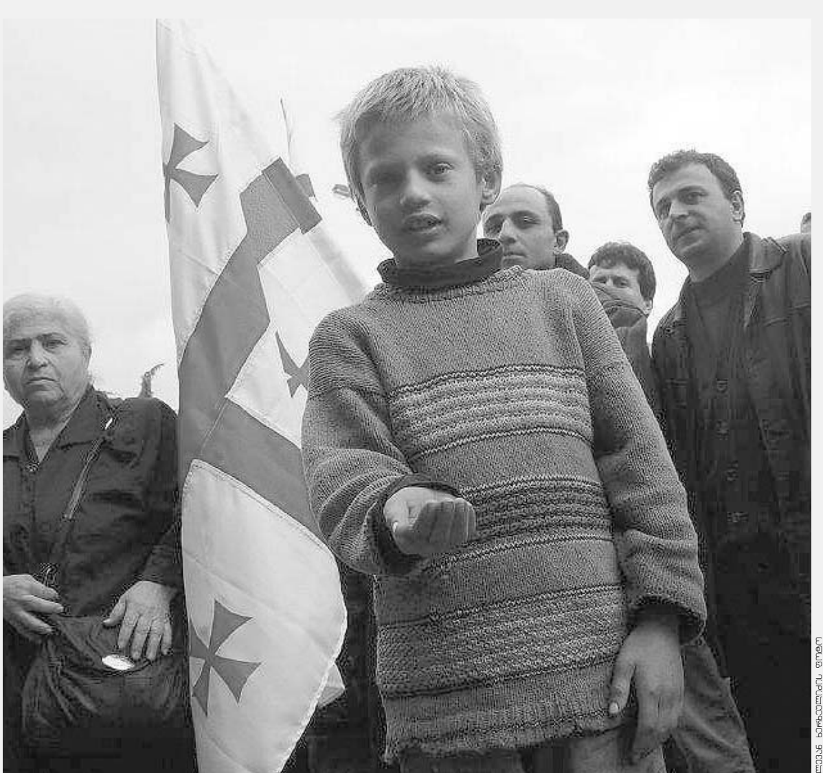
ლევან სიმონიანი ფონდი

ხალხში ბედნიერად ცხოვრების ნაპერწკალმა იელვა, ყველას იმედი გაუჩნდა, რომ ეს განუკითხაობა დამთავრდებოდა, ქვეყანაში არსებული კორუფცია აღმოფხვრებოდა და კვლავ სამართალი იბატონებდა.