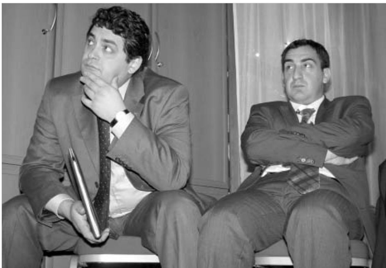
საქართველოს ეკონომიკისა და ენერჯეტიკის მინისტრები დონორებთან შეხვედრაზე.

ჯერჯერობით, საქართველოს მთავრობის წევრები დაფინანსების კონკრეტულ თანხებზე არ საუბრობენ. აღსანიშნავია ისიც, რომ დახმარებისათვის საჭირო თანხების ოდენობა თვითონ დონორებმა უნდა განსაზღვრონ. პრემიერ-მინისტრის ზურაბ ჟვანიას განცხადებით, დროა მსოფლიო