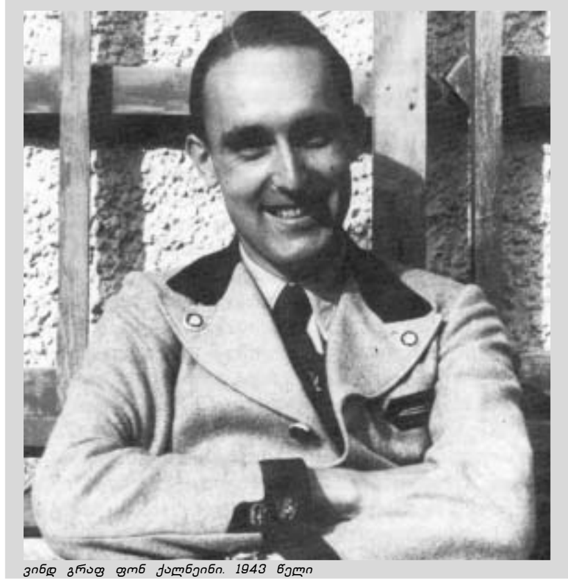
ვინდ გრაფ ფონ ქალენინი. 1943 წელი

"ჩემი არყოფნის განმავლობაში რუსთავი ძალიან შეიცვალა. იქ, სადაც უნინ ტრამაილი იყო, ახლა სამხედრო მოედნებია. იქ, სადაც ცხვარს აძოვებდნენ, მიდამო გადათხრილია. ღამით ტურები შორს ჩხავიან, არნივები კი ხმაურს გაეცენენ. უზარმაზარი პროექტი ნელ-ნელა ფორმას იძენს. მისი დასრულება ხუთწლივითაა გათვალისწინებული. ჯერ კიდევ უზარმაზარი სამუშაოა შესასრულებელი და საბჭოთა მეთოდის თანახმად, გერმანის ვადამდე შესრულებას უკანასკნელი ძალ-ღონით ცდილობენ. ამისთვის რუსთავში, დაახლოებით, 6000-მდე სამხედრო ტყვე, დაახლოებით, 4000 პატიმარი და ერთი-ორი ასეული დაქირავებული მუშა და მოხელეა კონცენტრირებული..."