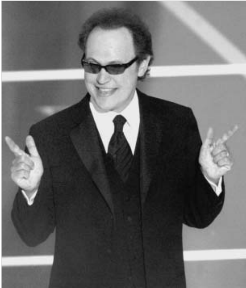
შოუს მასპინძელი ბილი კრისტალი

"ოსკარით" დაჯილდოებაში ნურასოდეს წუ ეძებთ რაიმე კანონზომიერებას, რადგან ხშირად წარმატება დამოკიდებულია პოლიტიკურ სიტუაციაზე, ამა თუ იმ პრეტენდენტის პიროვნულ თვისებებზე და მრავალ სხვა გარემოებაზე. პრესაში ბევრს წერდნენ სოფია კოპოლაზე, როგორც პირველ ქალ რეჟისორზე, რომელიც წარდგენილია "ოსკარზე". მისი ფილმი "თარგმანში დაკარგულნი" არის წყნარი, დინამიკის მოკლებული ფილმი, რომელიც გადაღებულია იაპონიაში და წაგავს იაპონური ჩაის მომზადების ცერემონიას. რატომღაც კინოაკადემიის კოსებმა კოპოლა ჩათვალეს "ოსკარის" ნომინაციის ღირსად, ეჭვი მაქვს, რომ აქ მთავარი როლი მისმა სახელგანთქმულმა მამამაც ითამაშა, თუმცა სოფია კოპოლას