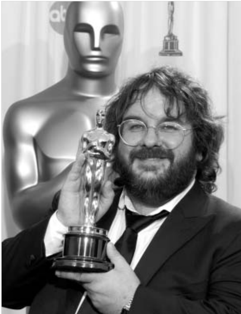
რეკორდსმენი პიტერ ჯექსონი