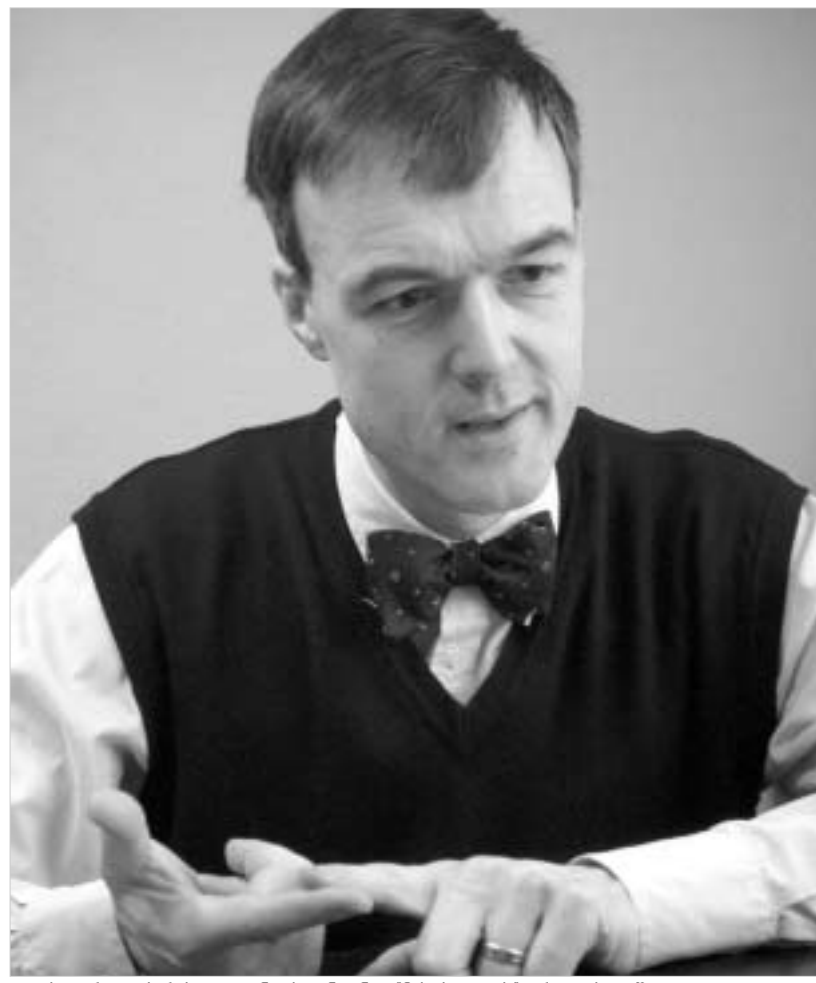
დოქტორ ალბრეხტ ფონ ქალენი "24 საათის" რედაქციაში.