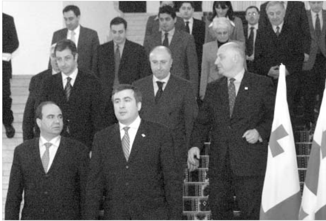
მათ კრიტიკა სჭირდებათ. რათა რეალობას არ მოსწყდნენ.