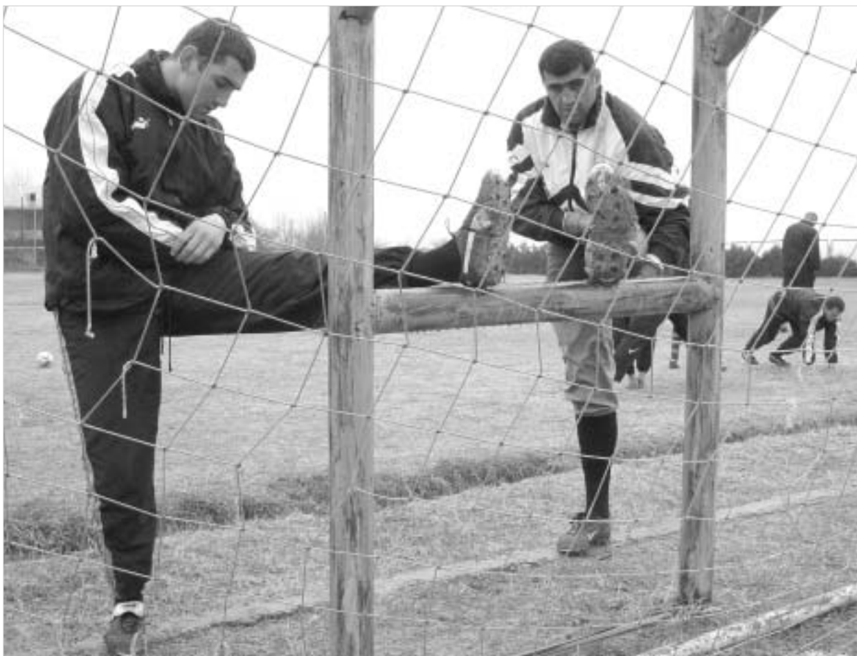
საქართველოს მორაგბეთა ნაკრები თანდათან ძველ იერსახეს იძენს

ამას მწვრთნელეებიც გრძობენ და ამიტომაცაა, რომ არჩევანი, ძირითადად, საფრანგეთში მოპოვებული გუნდის კეთს. თანაც, მათ კვალიფიკაციასაც ხომ წარმოიჩენს სჭირდება, თორემ, რა გამოდის - "არაკვალიფიციურ" სორელის ნასვლის შემდეგ გუნდმა პორტუგალიას და ესპანეთს ვერ მოუგო. გუნდის აწყობა ხანგრძლივი პროცესია და მისი ჩამოყალიბების პერიოდში არადა-მაკმაყოფილებელი შედეგებისაც არ უნდა შეგვეშინდეს, მაგრამ ისეც არ უნდა მოხდეს, რომ პორტუგალიისა და ესპანეთის ძლევა სანატრელი გაგვიხდეს.