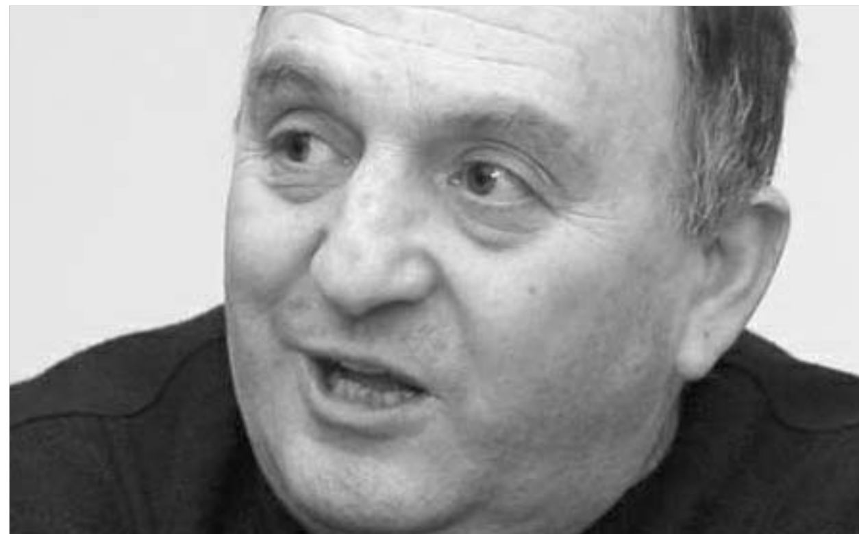
როლარია გადადგა – ვინ იქნება შემდეგი?

"5 მარტიდან გენერალური მდივანი აღარ ვიქნები. ძალისხმევა არ დამიშურდება, ყველაფერი გავაკეთე, რაც შეიძლება დამიანჩია, რომ ჩემი შესაძლებლობებით ამ პოსტზე ამოვყენი. 55 წლის ვაგედი და, დროა, ასეთ აქტიურ საქმიანობას წერტილი დაუვსე. თუმ-