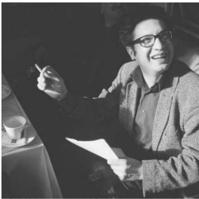
ლაშა ბაქრაძე - სად არის ევროპა?

ერთხელ, როცა მშვენიერი მეფის ასული ევროპა მეგობრებთან ერთად ზღვის პირას სეირნობდა, თამაშობდა და ყვავილებს კრავდა, სად იყო და სად არა, უღამაზესი თეთრი ხარი გამოჩნდა, რომელსაც რქები ნახევარმთვარესავით ჰქონდა მორკალავით. ის მშვიდად, დანადობილად, კუდის ქნევით მიუახლოვდა ევროპას და ზურგი მუშულოდა. ქალწული მის ზურგზე ამხედრდა, და ხარი ზღვაში გადაეშვა. შემინებული ევროპა მას რქებში ჩაეჭიდა - სხვა რა დარჩენოდა? ღია ზღვაში ხარს დედღინები