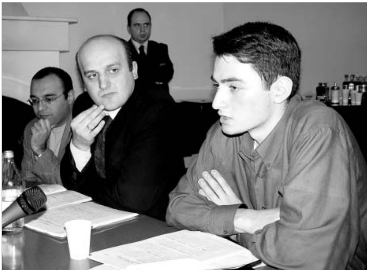
გუშინ თაიხსუფლების ინსტიტუტში "საგადასახადო ამნისტის" მექანიზმზე მსჯელობდნენ.

სათვის აქტუალურია, რადგან "ფევტორი კორპორაციული მართვა ხვეწს საინვესტიციო კლიმატს, მოიზიდავს ადგილობრივ და უცხოურ კაპიტალს, ქმნის ეკონომიკური ზრდის საფუძველს". IFC-ს მიერ ჩატარებულ პირველ ტრენინგს 17 ქართული კომპანიის ("ქსნის მინის ტარა", "თბილენი", "თბილის ლიზინგი", "სახალხო ბანკი", "ქართუ უნივერსალი" და სხვა) ხელმძღვანელი დაესწრო. კორპორაციაში აღნიშნავენ, რომ საქციო საზოგადოებას დიდი დაინტერესების გამო მსგავსი შეხვედრები ინტენსიურ ხასიათს მიიღებს. სექტორი კი ძალზე მთავრდება - დღეისათვის საქართველოში ოფიციალურად 1 800 საქციო საზოგადოებაა რეგისტრირებული.