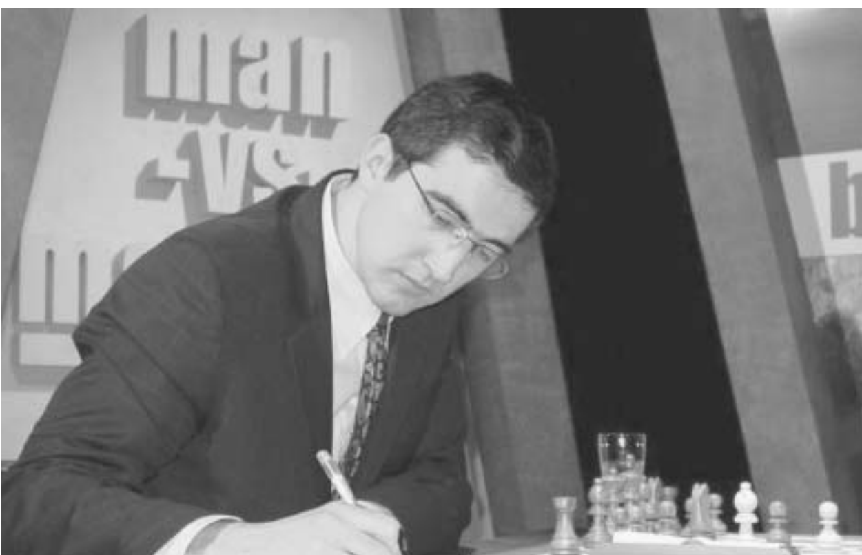
კრამნიკი ტურნირის ლიდერია

ვიდრე მსოფლიოს ნამყვანი მო-ჭადრაკეები ესპანურ მზეს ეფიცებიან და ლინარესის ტურნი-რით იქცევენ თავს, საჭადრაკო სამყარო მარშით მიექანება აღმო-საველეთისკენ. ფიდეს პრეზიდენტ-მა კირსან ილიუმჟინოვმა ნათლად ჩამოაყალიბა თანამედროვე ჭად-რაკის განვითარების გეზი. უფრო სწორად, უძველესი თამაშის გეოგ-რაფიული მიმართულება. მსოფ-ლიო ჩემპიონატებმა, რომელთა ორგანიზატორობას ფიდე უზრუნ-ველყოფს, აღმოსავლეთით იბრუ-ნეს პირი, აფრიკასა და სამხრეთ კავკასიაში. აღმოსავლეთში დიდი ტურნირები ადრეც ტარდებოდა. 2000 წლის მსოფლიო ჩემპიონატი ინდოეთში გაიმართა, ხოლო მის ფინანსს ირანმა უმასპინძლა, მაგ-რამ ასეთი მასშტაბის ტოტალური შეტევა ჯერ არ ყოფილა.