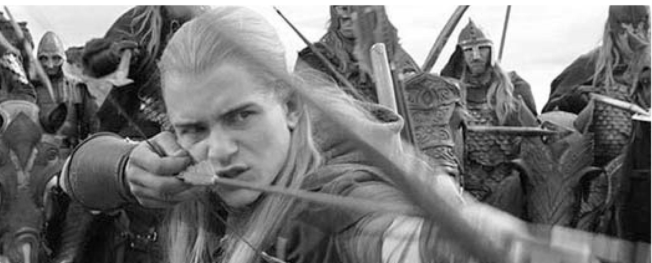
"ზეჭდების მბრძანებელი" მშვილდოსნობის სპორტის პოპულარიზაციას ეწევა

"ზეჭდების მბრძანებელმა" ბრიტანეთში მშვილდოსნობის ბუმი გამოიწვია