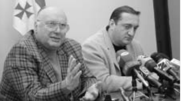
"მრენველ-ახლბი" ხელისუფლების ყველა ნაბიჯს აკრიტიკებენ.

ზუგდიდში ორი დღის წინ განვიხარებულ მოვლენებს, რასაც უმიშროების ადგილობრივი თანამშრომლების დაპატიმრებები მოჰყვა, ოპოზიციო დაუყოვნებლივ გამოეხმაურა.