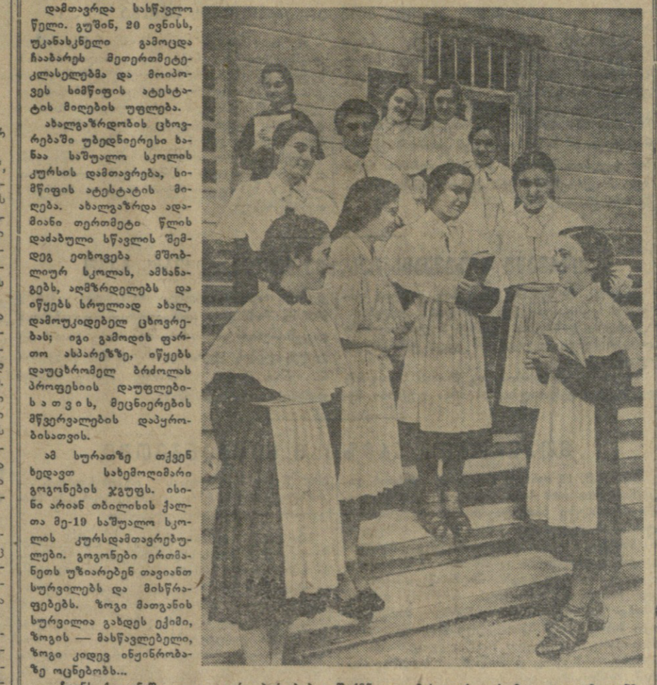
დამთავრდა სასწავლო წელი. გუნდის, 20 ივნისს, უკანასკნელი გამოცდა ჩაატარეს მეთერთმეტე-კლასელებმა და მოიპოვეს სიმფონიის ატესტატის მიღების უფლება.