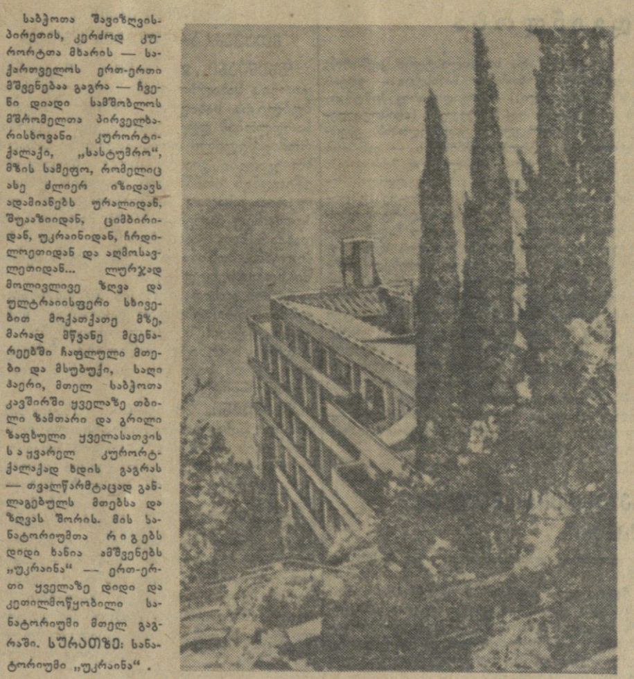
საბჭოთა ზღვისპირეთის კურორტი ზღვისპირას