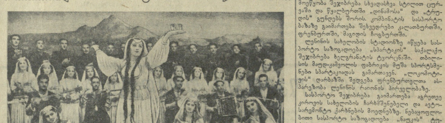
სურათში: აზერბაიჯანის სომხების და ცეკვის სახელმწიფო ანსამბლის ერთი ჯგუფი...