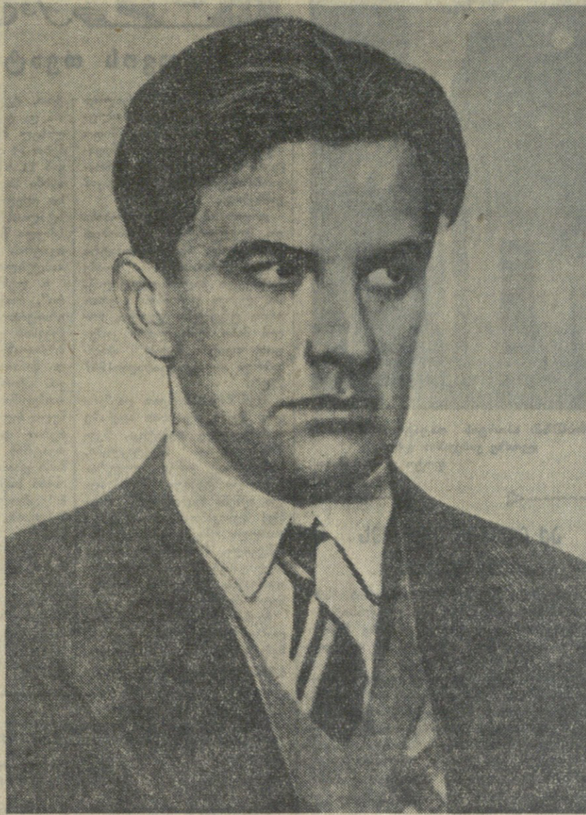
მ. მ. მარიაკოვსკი