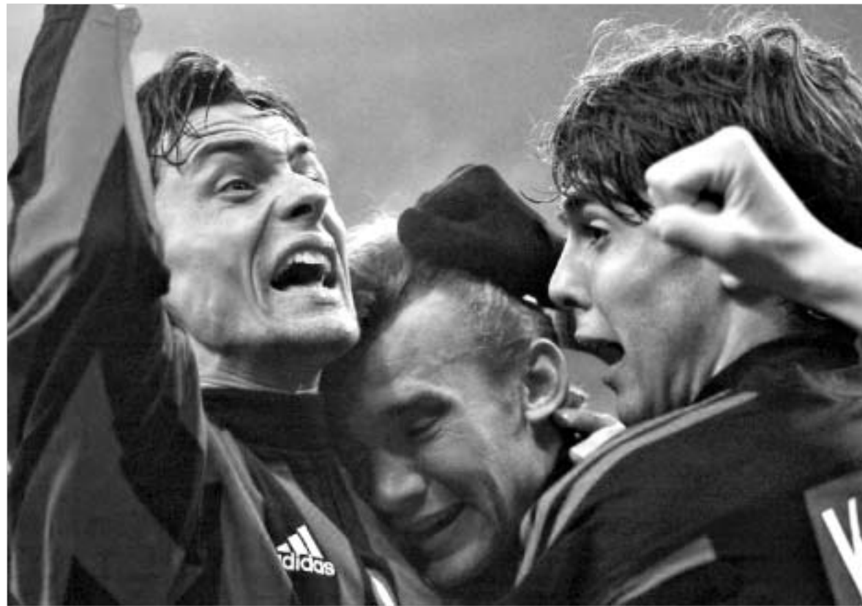
"მილანი" თითქმის უკვე ნახევარფინალშია.

პირველი ტაიმის დამატებითი წუთი მიდგოდა, როდესაც "მილანელთა" ჯაფა დაფასდა. კაჟუს მიერ ჩამორბეულ ბურთს ასევე ბრაზილიელმა კაკამ შეკრდით მიიღო და დაახლოებით 12 მეტრის დი-