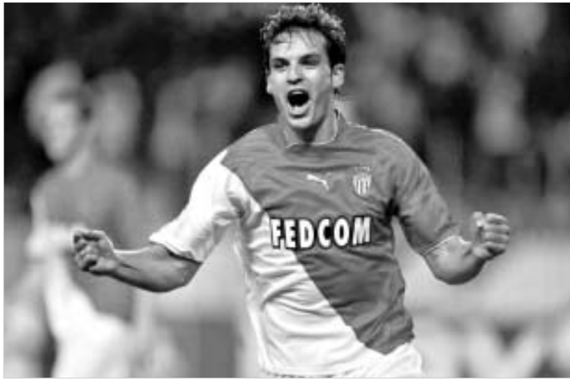
მორინგესი ზერნაბუზე ზრუნდება.

ჩემპიონთა ლიგის მეოთხედფინალური ეტაპი დღეს გრძელდება. მოუხედავად იმისა, რომ ორივე მატჩი უაღრესად საინტერესოა, "ჩელსი"- "არსენალის" მატჩი მაინც განსაკუთრებულ ინტერესს იწვევს. ალბათ, იმიტომ, რომ "მონაკოსთან" მატჩში ყველა "რეალს" მიიჩნევს ფავორიტად და იმიტომაც, რომ "ჩელსისა" და "არსენალის" მატჩის სახით ჩემპიონთა ლიგაში ლონდონური დერბის მომსწრენი გახვდებიან.