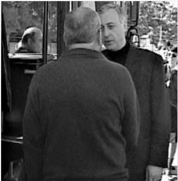
დავით გამყრელიძე ყველაზე მეტად უნდება საარჩევნო პროგრამაზე საუბარი.

კახეთში საპარლამენტო არჩევნებით გამოწვეული ციებ-ცხელება გადაწყვეტ ფაზაში შედის. გუშინ რეგიონის მოსახლეობას "მეიარაჰვენი ოპოზიციის" ლიდერები დავით გამყრელიძე, ზურაბ ტყემელაძე, ფიქრია ჩიხრაძე და გოგი თოფაძე შეხვდნენ. თუმცა ეს ვიზაჟი, 2 ნოემბრის საპარლამენტო არჩევნების წინაშე მასშტაბებით ვერ გაუტოლდებოდა. ამის მიზეზად კი მათ შესახებერთა მისული მოსახლეობა ვარდების რევილუციას ასახელებდა. მოუხედავად ყველაფრისა, მოსახლეობა მეიარაჰვენი ოპოზიციას თბილად მიეგება. პარტიის ლიდერები კი ამ მანის ხელიდან არ უშვებდნენ და ახალი თავიერობის საღამომდე სიტყვებს არ იშურებდნენ. მათი ძირითადი კრიტიკის მიზეზი კი პენსიების სამი ლარიანი მომატება გახლდათ. თოფაძე მიიჩნევს, რომ პენსიებზე დამატებული ფული ის თანხაა, რომელიც თავის დროზე პენსიონერებს ეკუთვნოდათ: "არ გვერობო, რომ ჩვენს ხელისუფლებას ხალხი ადარდებდა. 3 ლარი, რომელიც დამატდა, თქვენი გაყინული და დაკონსერვებული პენსიებია," - განუმარტავდა სოფლის გლეხობას გოგი თოფაძე. პარტიის პროგრამის შესახებ საუბარი, ძირითადად, დავით გამყრელიძეს უწევდა. იგი ქვეყნის განვითარების ერთ-ერთ მთავარ პრიორიტეტად, მრეწველობის და ბიზნესის განვითარებას მიიჩნევს, თუმცა გამყრელიძეს ეჭვი ეპარება, რომ იმ სადავსახადე კანონები, რომელიცაც ჩვენი ხელისუფლება მოქმედებს, ვერც მრეწველობა განვითარდება და ვერც ბიზნესი. "ჩვენი პარტიის მიზანია ის არის, რომ, პარლამენტში მუდგის მკვირვებაში, საგადასახადე კანონები დაიხვეწება და ქვეყნის ეკონომიკაც გამოსწორდება," - ამბობს გამყრელიძე. მეიარაჰვენი ოპოზიციის ლიდერები გუშინ საგარეო ვადა, გურჯაანის და თელავის მოსახლეობას შეხვდნენ.