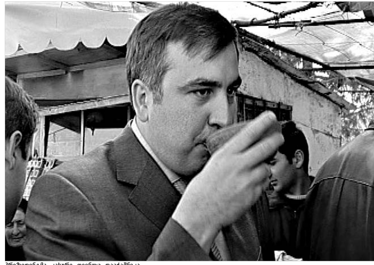
პრეზიდენტმა კახური ღვინოც დააჭაშნიკა.