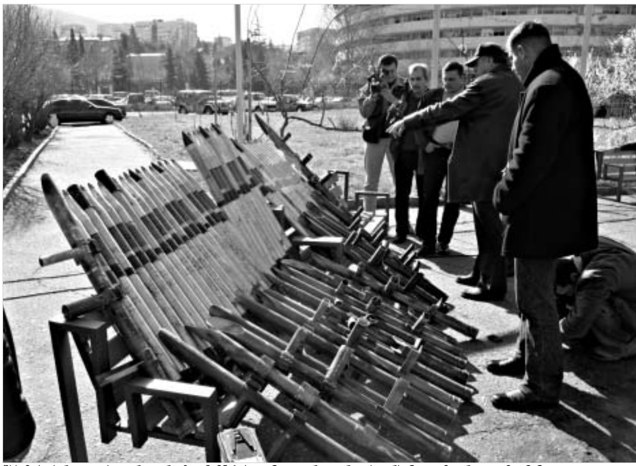
შსს-მ საქართველოს ტერიტორიაზე ჩვენების დანატოვარი იარაღის არსებული მდგომარეობა აღმოაჩინა.

შს მინისტრის განცხადებით, იარაღის ამოღება საქართველოს უსაფრთხოების განმტკიცების თვალსაზრისით პოზიტიური ნაბიჯია, რადგან "არავინ იცის, სად და ვის წინააღმდეგ გამოიყენებდნენ ამ იარაღს" .