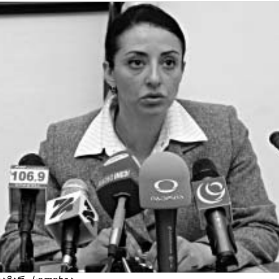
ინფრასტრუქტურისა და განვითარების მინისტრმა თამარ სულუზიამ გუშინ პრესასთან პირველი ოფიციალური შეხვედრა მოაწყო. გუშინდელი შეხვედრა მან უწყებაში დაწყებული პირველი რევიორება და რამდენიმე ახალი პროექტის გაცინობას დაუთმო.

მას შემდეგ, რაც ურბანიზაციისა და მშენებლობის სამინისტრო ტრანსპორტისა და კომუნიკაციების სამინისტროს შეუერთდა, 50-მდე თანამშრომელს სამსახურის დატოვება მოუხდა. თამარ სულუზიამ მიიჩნევს, რომ სამინისტროების გაერთიანება სამტატო განრიგის ცვლილებას თავისთავად მოითხოვს. "ჩვენი ძნელი იყო თანამშრომლების გათავისუფლება, თუმცა სხვა ვა არ გვერდა," - თქვა მან.