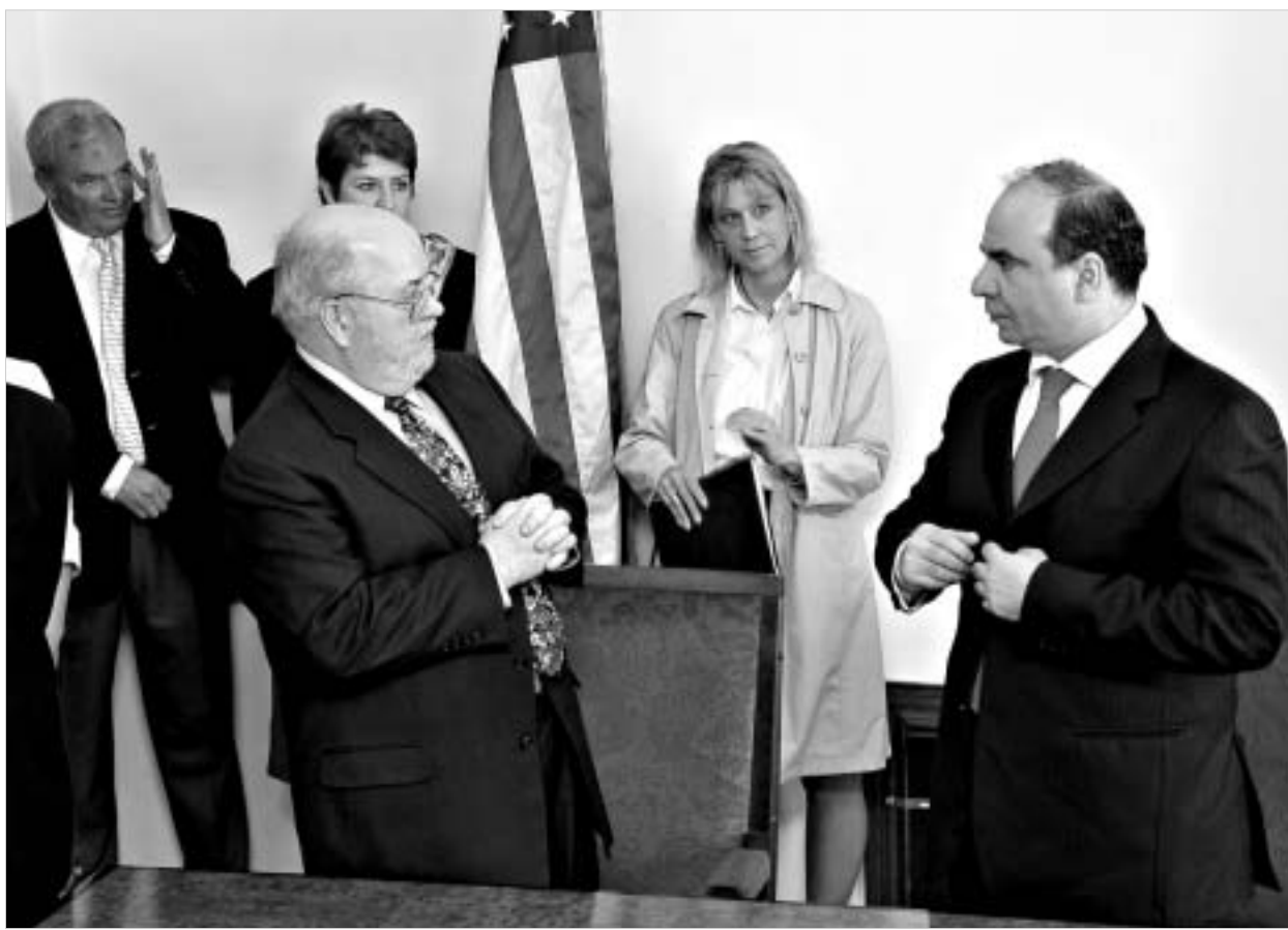
შეთანხმებაზე ხელმოწერის ცერემონიალი.

23 მარტს ხელმოწერილი შეთანხმებით გათვალისწინებული ასიგნება, რომლის საერთო მოცულობა ორნახევარ მილიონ დოლარს შეადგენს, შინაგან საქმეთა სამინისტროსა და პროკურატურაში რამდენიმე მიმართულებით, კერძოდ სასამართლო ექსპერტიზის ლაბორატორიისა და პოლიციის აკადემიის პროექტის განვითარებაზე დაიხარჯება. თანხის ზუსტად ნახევარი მოხმარდება იურიდიულ საკითხებში მუდმივი მრჩევლის პროგრამას. ამ მრჩეველმა, თუმცა მრჩეველთა ჯგუფმა, რომელთა ვი-