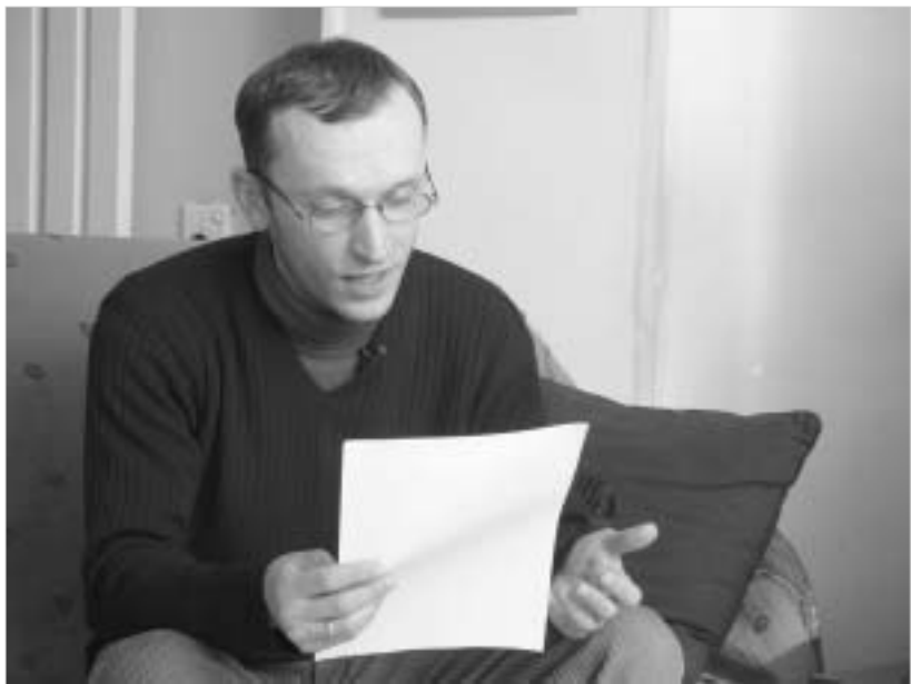
წერილები პირადი ბიბლიოთეკიდან