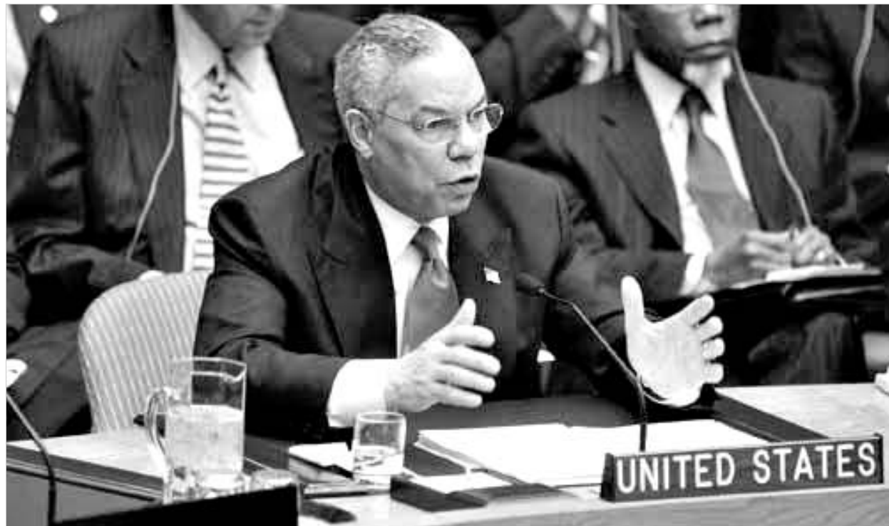
კოლინ პაუელმა შეცდომა აღიარა.