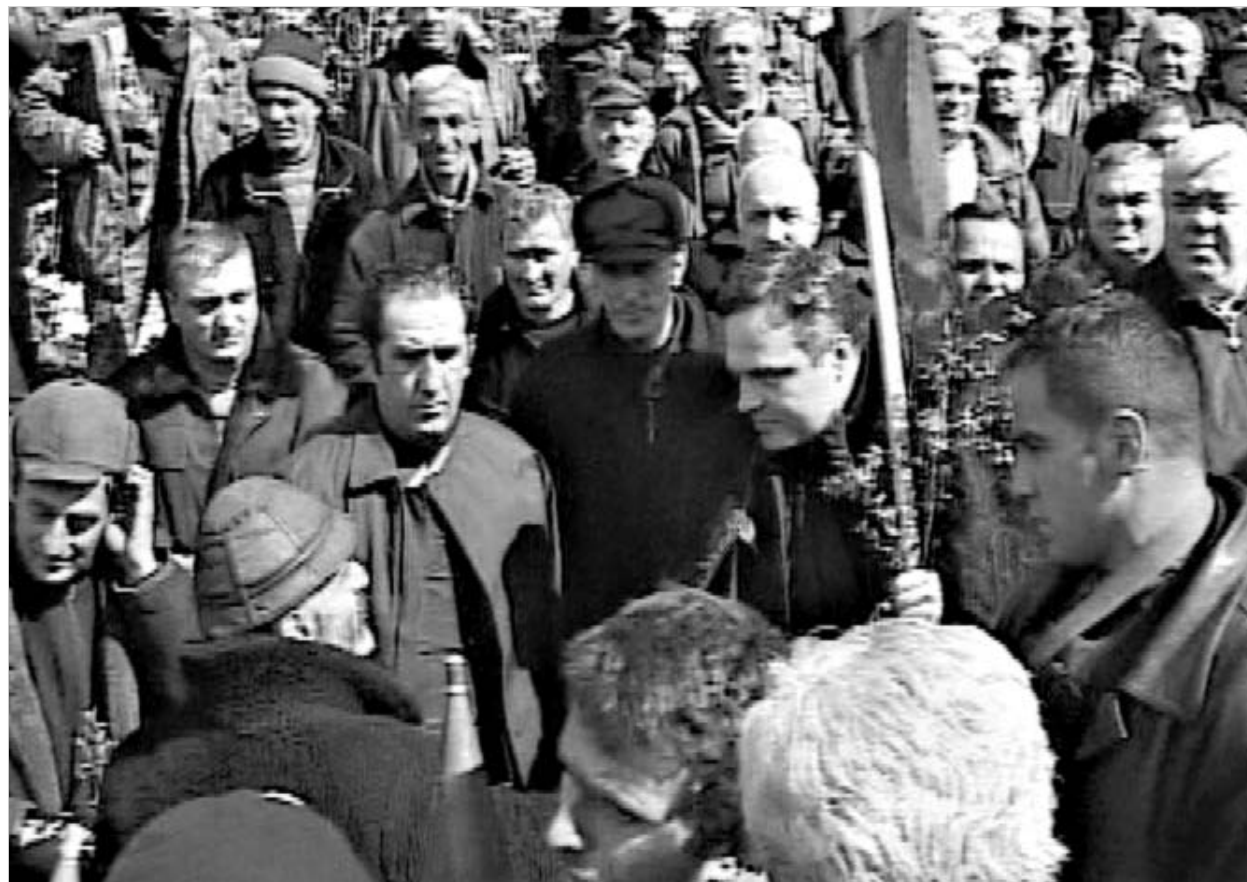
დიდი შერიგება ბზობის დღესასწაულზე