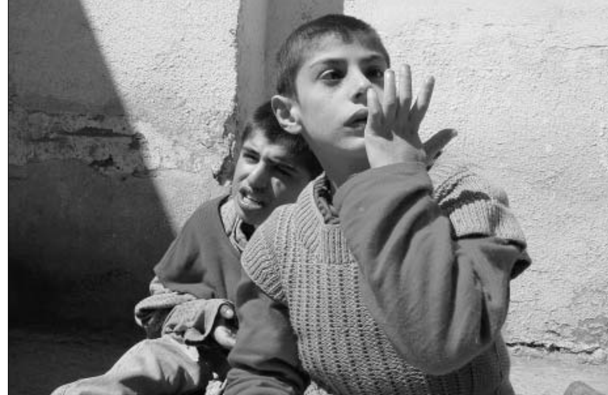
კასპის ბავშვთა სახლის ბინადრები.