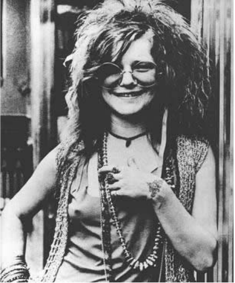
ქალი როკები: ჯინის კოპლინის დარად ვერავინ მღეროდა. 1970 წელს ის ნარკომანიის გამო გარდაიცვალა.

ერთხელაც, 1954 წლის 5 ივლისს, ელვისმა შესვენების დროს ძველი ბლუზი, That's All Right, Mama დაამღერა. ფილიპსი უმალვე მიხვდა, რასთან ჰქონდა საქმე. ჩანანერი მრავალ რადიოარხზე გაიშმა, მაგრამ მსმენელი დარწმუნ-