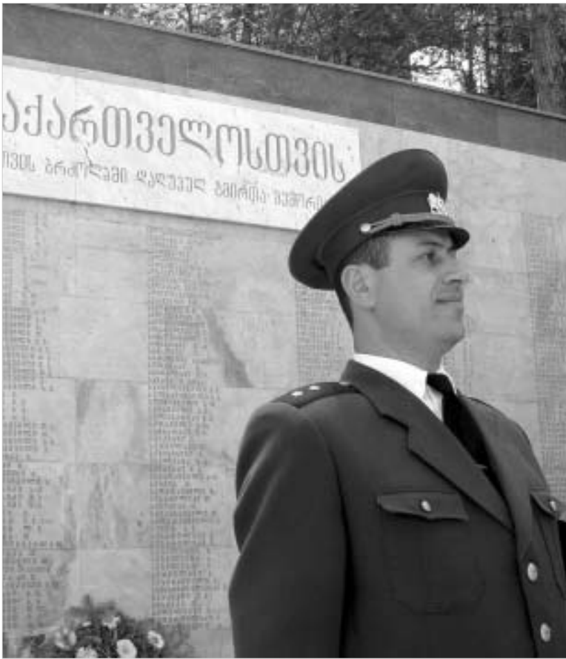
საპატიო ყარაული დადუკულთა მემორიალიდან