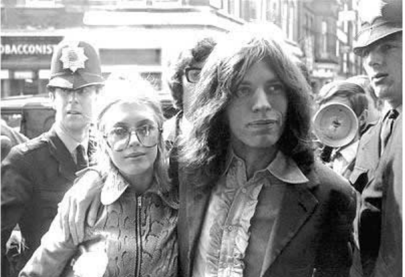
როლინგ სთუნზი მუდამ სკანდალებში ეხვეოდა. მიკ ჯაგერი და მისი მეგობარი მერიკენ ფითსფელი ლონდონის სასამართლოში მიგმართებიან იმის ასახსნელად, თუ რატომ ინახავდნენ კანაბისის მარაგს (1968)

ჯინსები და პიკანტური ქვედაბოლოები, პომადა და ცხენის კუდივით შეკრული თმა - 50 წლის წინათ ამერიკაში დაწყებული უჩვეულო რევოლუციის სიმბოლოები სწორედ ასე გამოიყურებოდნენ. ზნეობის სადარაჯოზე მდგომარეობაში როკ ენ როლს მუსიკად ქცეულ სიგიჟეს და არასრულწლოვნთა სახიფათო ეროტიკულ ცდუნებას უწოდებდნენ. ზნეობის სადარაჯოზე მდგომართვის ეს ამბავი ამაყად იყო. როკ ენ როლმა კი მოზრდილთა შეუზღუდავი დიქტატის დაძლევა შეძლო. როკ ენ როლმა ისიც კი შეძლო, რასაც ვერავინ და ვერაფერი ახერხებდა: რკინის ფარდის მიღმა გასვლა.