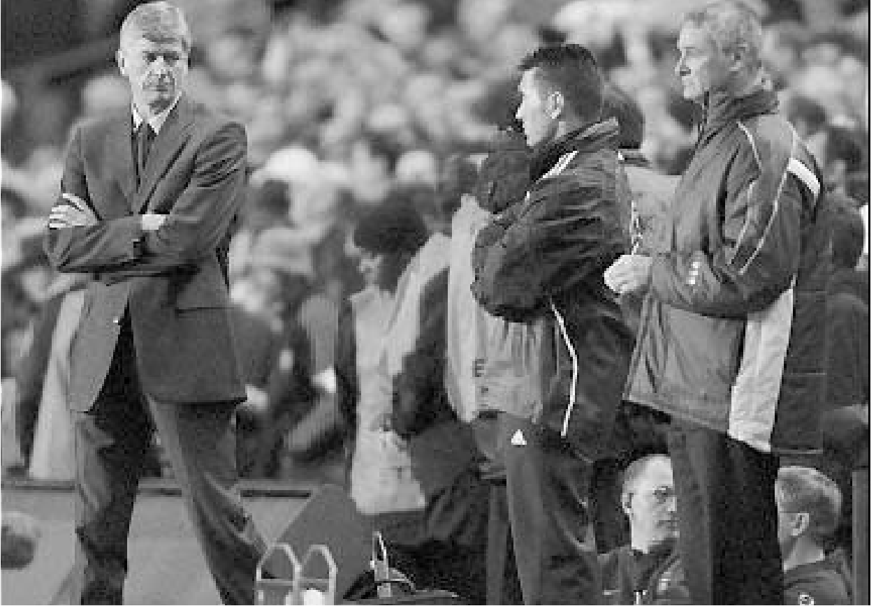
კლადილი რანიერი ჩემპიონთა ლიგის მოგებაზე ალაპარაკდა

კლადილი რანიერიმ უკვე მთელიცა გაიმეპიონება არსენალ ვენჯერს: არსენალი მტკიცე და ძლიერი გუნდია. მათ შესანიშნავად ითამაშეს და დამისაზრდეს პრემიერლიგის მოგება. შესანიშნავი ნამუშევარია, - შეაკო მეტოქე იტალიელმა. ჩელსის არაგინ მართავ სააღდგომო საჩუქარი. მიდლსბრომ არაფერი დაუთმო ჩემპიონთა ლიგის ნახევარფინალს მტკიცე და ამ სეზონში ორი ტიტულის მოგების იმედი საბოლოოდ დაუკარგა. რანიერი მაინცდამაინც არ ნერვიულდება ამის გამო. ჩემპიონთა ლიგაში ისეთი არაჩვეულებრივი სიტუაცია შექმნილი ყველა ფავორიტის გამოყრდნის შემდეგ, რომ ჩელსის, ნესით და რიჯით,