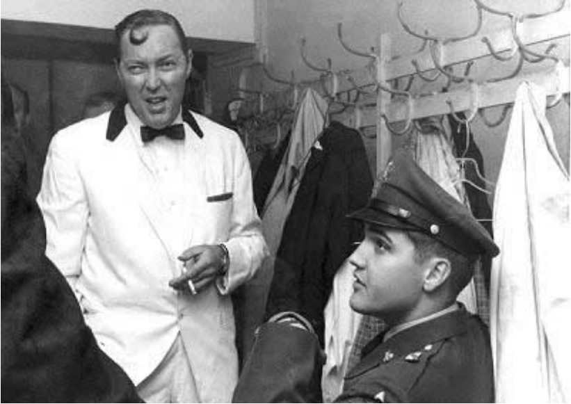
ისტორიული შეხვედრა: სამხედრო სამსახურში მყოფი ელვის პრესლი ფრანკფურტში კონცერტის გასამართად ჩასულ ბილ ჰელის შეხვედა

რაც არ უნდა ილაპარაკონ, რომ ოთხმოციანი წლების შემდეგ როკ ენ როლი მოკვდა, ყოველთვის იარსებებს ხალხი, რომელიც დიდებული სიმღერებს დაწერს და როკ ენ როლს სიამოვნებით მოუსმენს. ნახევრასუკუნოვანი ისტორიის მქონე როკ ენ როლი ცოცხალია, უბრალოდ, სამოცნიან და სამოცდაათიან წლებში ის საპროტესტო მოძრაობასთან იყო დაკავშირებული და ამიტომ განსაკუთრებით ამაყად ყელვრდა, ახლა კი სოციალური ცვლილებების მაუწყებლის როლი დაკარგა, ესაა და ეს.