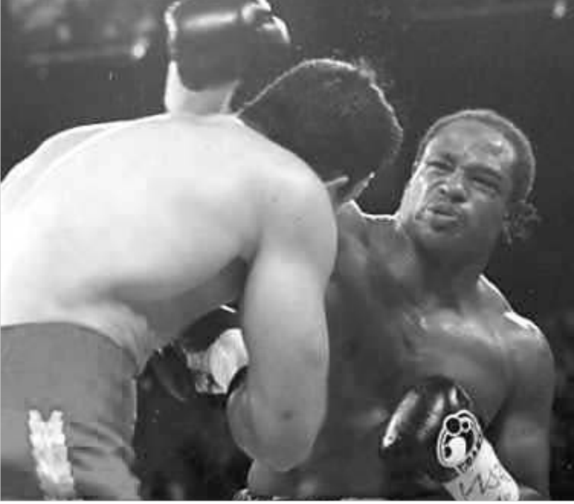
კლიჩკომ ბრიუსტერის მუშტივ იცემა და ნაგებავს