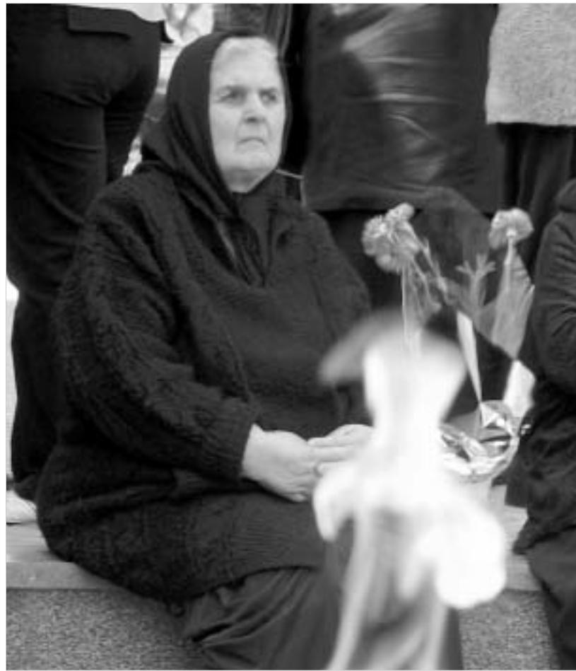
"ჩემი შვილი მხოლოდ თავის ოჯახს მოუკვდა..."

საფლავთა კურთხევის დღეს დადუკულთა დედეებმა, რომელთაც განგებამ შვილების საფლავებზე კი არ აღირსა, გმირთა მოედანზე აღმართულ ობელისკთან მიიტანეს ყვავილები, ნოთელი ვერცხები და საადღვომო "პასკები". "ჩვენი შვილები არ დაფასეს"; "სახელმწი-