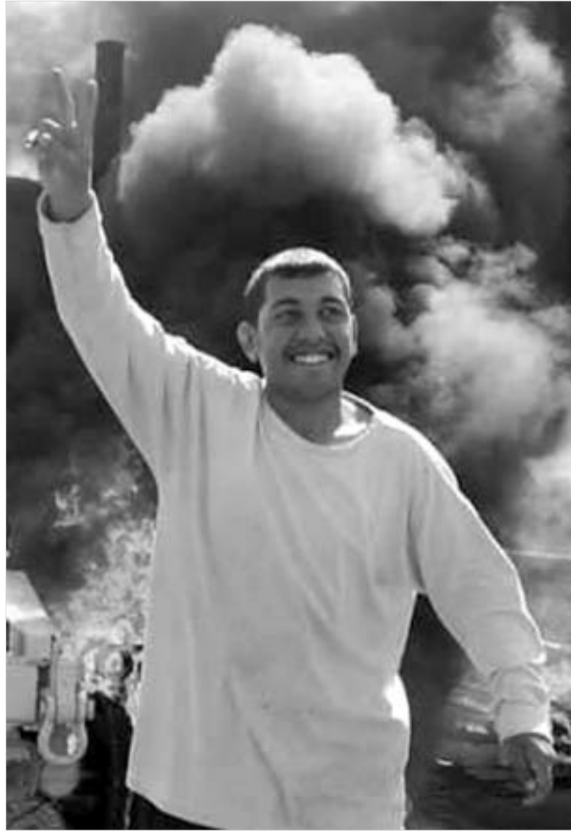
ერაყში წინააღმდეგობა იზრდება.

უფრო და უფრო აშკარად ჩნდება იმის ნიშნები, რომ შიიტები და სუნიტები ერთად გამოვლენ ამერიკელთა წინააღმდეგ. მათ შორის თანამშრომლობის ზრდასთან ერთად, იზრდება საფრთხე, რომ ბუში ერაყში ასე ადვილად წესდეს ვერ დააწყარებს. მდგომარეობა ერთი წლის წინანდელ ახლად დაპყრობილ ერაყსა და დღე-