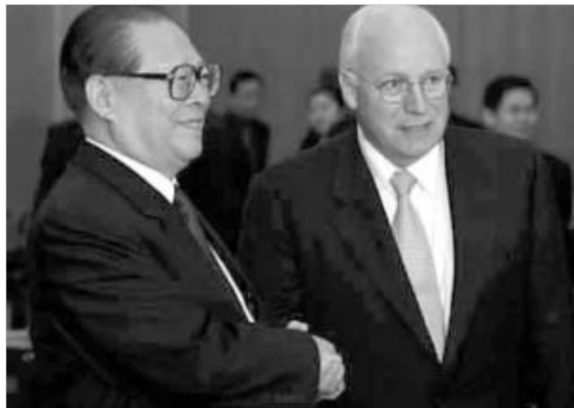
ვიცე-პრეზიდენტი ჩინი და ჩინეთის სამხედრო უწყების ხელმძღვანელი ძიან ძემინი

თითქმისდა რა პრობლემა უნდა იყოს უზარმაზარი ჩინეთისათვის ერთი ცილა კუნძული, თავის 23 მილიონიანი მოსახლეობით (თავად ჩინეთის მოსახლეობის რიცხვმა უკვე