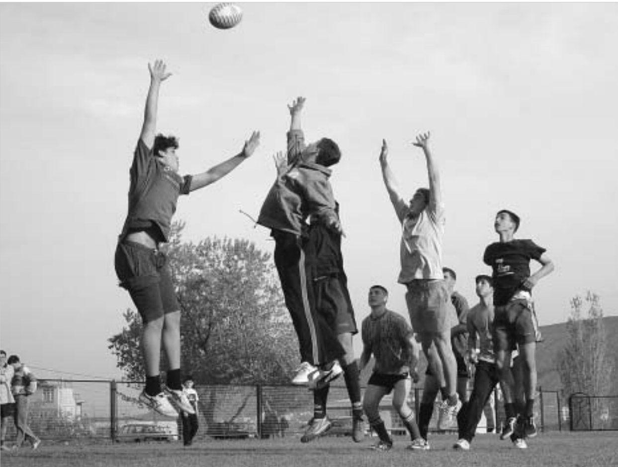
"ჭიქები" საფრანგეთში დღეს წვიდნენ