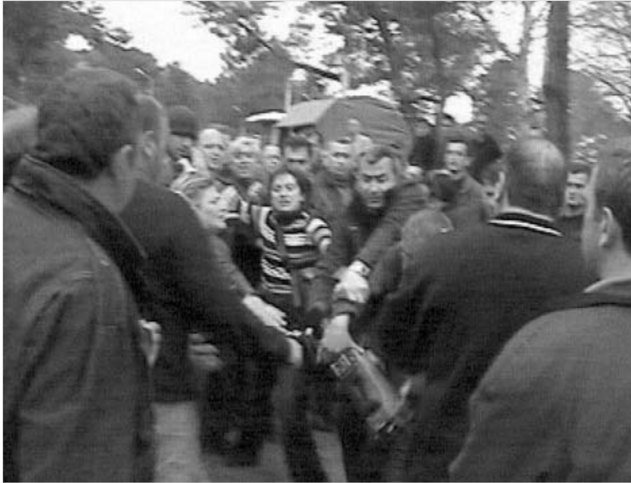
„რუსთავი-2“-ის ჟურნალისტსა და ოპერატორს ჩოლოქზე ფიზიკურად უსწორდებიან.

გუშინ აჭარაში განვითარებულმა მოვლენებმა ცხადყო, რომ დაპირისპირება თბილისსა და ბათუმს შორის უკიდურეს ზღვრამდე მისული და არც ერთი მხარე დათმობებზე წასვლას არ აპირებს. ჩოლოქთან კვლავ შეიარაღებული ადამიანები დგანან. აჭარის ადმინისტრაციული საზღვარი ჩაკეტილია და ყველა თბილისელი მალაჩინოსისთვის ავტონომიის ტერიტორიაზე შევლა შეუძლებელი ხდება. ადმინისტრაციულ საზღვარზე კი, საქართველოს ხუთჯეროვანი დროშის ნაცვლად, „აღორძინების“ დროშა ფრიალებს.