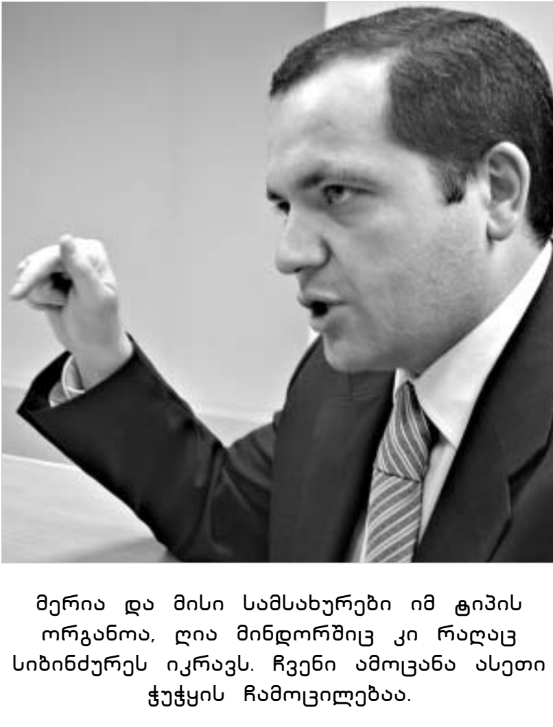
მერია და მისი სამსახურები იმ ტიპის ორგანოა, ღია მინდროშიც კი რალაც სიბინძურეს იკრავს. ჩვენი ამოცანა ასეთი ჭეჭყის ჩამოცილებაა.