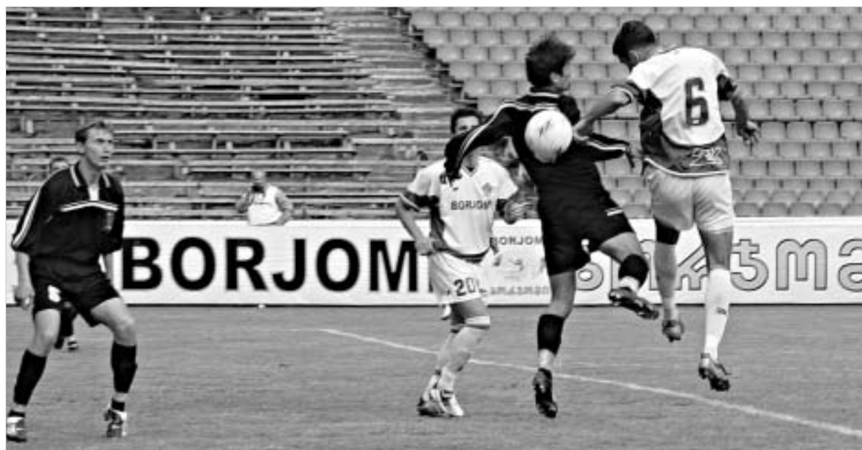
“დილა” მოტივირებული იყო. მაგრამ “დინამო” მიიწვევრ დაამარცხა.