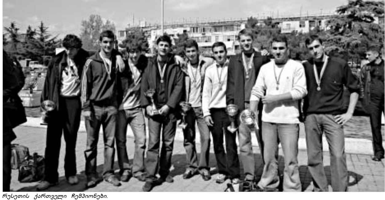
რუსეთის ქართველი ჩემპიონები.

როგორც ამბავია, ეკონომიკურმა გეგმამ საკუთარ აუზში წყალი დაგიშროს. მერე სხვა ქვეყნის ჩემპიონატს შეეხიზნო, იქ კი მასპინძლები არ გააახარო. ამის გამო, ალბათ, ის მასპინძლები თავხედურად გვეცხიან. ალბათ კი არა... ამის გამო ერთხანს ბობოქრობდნენ კიდევ: ევ ქართველები აქედან მოგვამოვით, ჩვენს ბიჭებს გასაქანს არ აძლევდნენ. მწვრთნელები კი ფედერაციის მოხელეებმა არაერთხელ დაამუხათეს: ტლიანმა ქართველებმა როგორ უნდა ვაჯობოთ, აუზიც კი არ აბადიათ. ერთადერთი ნათელ წერტილად თითო ჩამოსათვლელი მატჩები აქეთ და ისიც ჩვენი გულმონწყალებითო. მერე და მერე პირში წყალი ჩაიგუბეს, აწონდაწონეს, დაფიქრდნენ და მიხედნენ, რომ ქართველ ჭაბუკ წყალბურთელებთან ჭიდილ მათთვისაც კი დიდი ბაკვეთილია და ისევ გაისმა: “Милости просим!” ქართველი ჭაბუკებისთვის კვლავ გაიღო რუსული აკვატორია, მაგრამ რა? ახგვარი ნაბიჯი ისევ ძვირად დაუჯდათ ჩრდილოელ მეზობლებს. რუსებმა ისევ წინაშეში თავში ხელი - ისევ გავაჯობესო. მათ გუნება-განწყობაზე უგმოქმედება მოახდინა საქართველოს ჭაბუკ წყალბურთელებს ნაკრებმა, რომელიც გუმინ რუსეთის ჩემპიონის ტიტულს დაეცივარნენ. ფინალური დაპირისპირება, მართლაც, ფინალის საკადრისი გამოდგა, ოღონდ არა სანახაობრივად. ეს უფრო ომს შავდა. მსაჯეები არ გვეყვალბოდნენ. თუმცა, რუსთა ასევე არაეპირად მოსკოველი ქართველო-