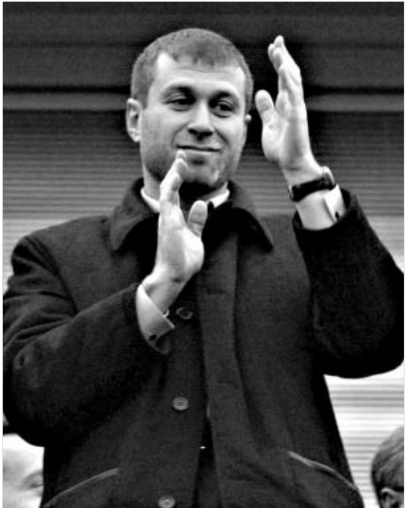
აზრამოვიჩის მახვილი რანიერის თავზეა აღმართული.

კამერუნის ფეხბურთის ფედერაციის პრეზიდენტი მოჰამედ ია ორმბარის ამაოდ ეცადა, როგორმე დაკავშირებოდა ფიფას რომელიმე წარმომადგენელს. იმ დღეს შეეცარიათ რაღაც ლოკალური დელეგაციები იყო და ციურისში განთავსებულ ფიფას შტაბში-ნაში ტელეფონს არავინ პასუხობდა. არავინ იცის, რა იქნება შემდეგ. მართ-