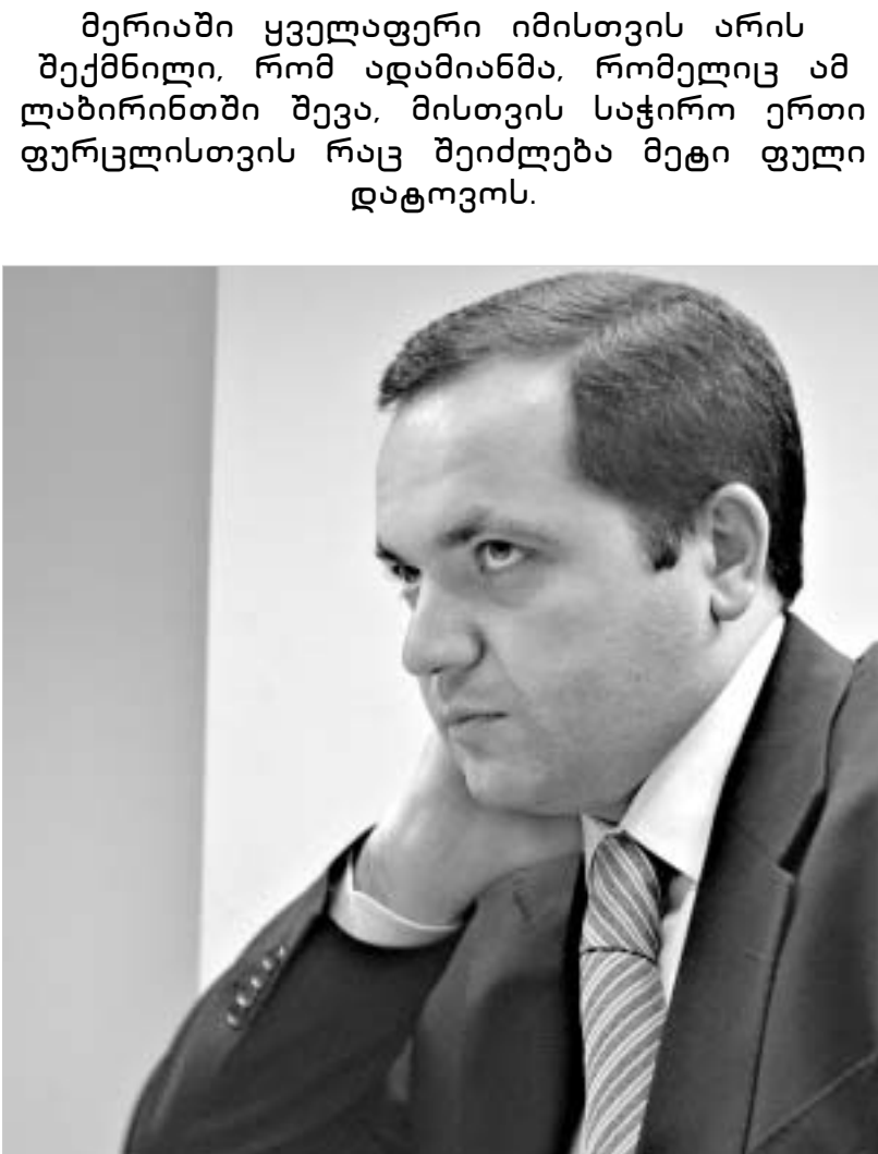
ღრმად ვარ დარწმუნებული, რომ 6 თვის მერე პროკურატურაში დაკითხვებზე სიარული არ მომიწვეს.

- ეგ ჩვენც გავიკეთე. პრეზიდენტმა 6 თვეში იმის გამოსწორება მოგთხოვე.