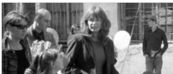
ეს ბავშვები სანდრას არ მოსცილებიან.

გუშინ საქართველოს პირველი ლედი სანდრა რულოესი და განათლების და მეცნიერების მინისტრი ოლქსანდრე ლომაია თბილისის პირველ დამხარაჲ სკოლაში ეწვივნენ. ისინი დაესწრნენ მუსულდელი შესწავლობების მქონე ბავშვთა და მოზარდთა სარეაბილიტაციო ცენტრს "ილა სტუდენტ" და ინტეგრირებული სპორტული მოედნის საუბრობას.