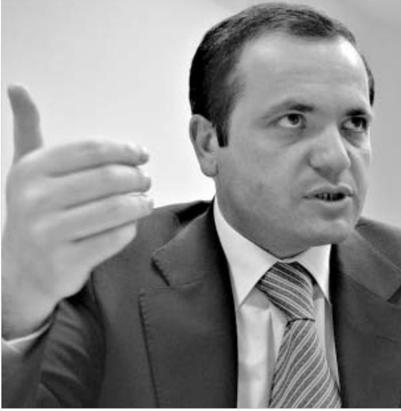
არ მინდა, ჩემი დედაქალაქი ზარმაცე ქალაქების რიცხვში იყოს. ქალაქი დილის 6-7 საათზე თუხუხს უნდა იწყებდეს.

ათ, რაც ათწლეულების განმავლობაში ფუჭდებოდა, რატომ არ გაიქცეოთ მისი კაბინეტიდან?