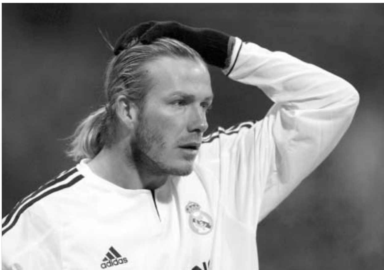
ბექშემს „სანტიაგო ბერნაბეუზე“ გული გაუხეთქეს

ფეხბურთი. ტრაგიკულად დასრულდა „ინტერისა“ და „ლაციოს“ მატჩი, რომელიც გასულ კვირას გაიმართა მილანის სტადიონ „სან სიროზე“. მსაჯის ფინალური სასტენის შემდეგ, სტადიონის მესამე იარუსიდან გადმოსხარა კონკურენტული კრის სატონი აღიარეს, მეორე და მესამე ადგილებზე ასევე „სელტიკელებმა“ პენრი ლარსონმა და სტილიან პეტროვმა დაიკავეს. „გლაზგო რინჯერის“ გერმანელი მეკარე შტეფან კლოსი საპატიო მეოთხე ადგილზე გავიდა.