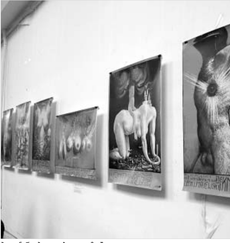
პოლონური პლაკატები აკადემიაში

ის თანმხლებ ყველაზე ლაკონურ, მახვილონივრულ, ინტელექტუალურ და ესთეტიკურ თანამგზავრად მიაჩნია... ნამუშევრები, რომელთა დათვალიერების შანსი აკადემიის დარბაზში გაქვთ, პოლონური პლაკატის შეძლებისდაგვარად ყველა დიდ სახელს მოიცავს. პოლონური პლაკატის სკოლის დამფუძნებელიდან - ჰენრიკ ტომასოვიციდან მის მონაფეხებამდე და მიმდევრებამდე. წარმოდგენილი პლაკატების უმრავლესობა თეატრის, ოპერისა და კინოს კონკრეტულ ნიმუშებზე შექმნილია: მარლოუს „ედვარდ მეორე“ თეატრის სცენაზე - ოლხან ისეთი, როგორსაც მას ტომასოვიცი ხვდავს; იან ლენიცას ფანტაზიაში „გატარებული“ ვაგნერის „პარსივლი“ (ლენიცამ შემოიღო ტერმინი პოლონური პლაკატის სკოლა); ვარშავაში სოუზენ სონტაგის მიხედვით დადგმული პიესა Death Kit და მისი ვიესლავ როსინასელი ვარიანტი; ვალდემარ სვიერუსის ბილი პოლიდეი (სხვათა შორის, ჯაზის და ზოგადად მუსიკის მოყვარულებმა ეს სახელი და გვარი აუცილებლად მოიძიეთ ინტერნეტში. სვიერუსი ჯაზის დიდოსტატების მთელი სერია აქვს დიუკ ელინგტონიდან მაილს დევისის ჩათვლით, მასთან სმირად შეხედებით „ბილბლასც“); ვისლავ ვალკუსი და მისი შექსპირი - „მეფე ლირი“, „ოლიუს კეისარი“, „რომიო და ჯულიეტა“, მეტად შთაბეჭედავი პლაკატი შექსპირის სონეტების რეციტაციისთვის. ვალკუსისევე „ვიუთერი“, „იდილი“ და „კალიგულა“.