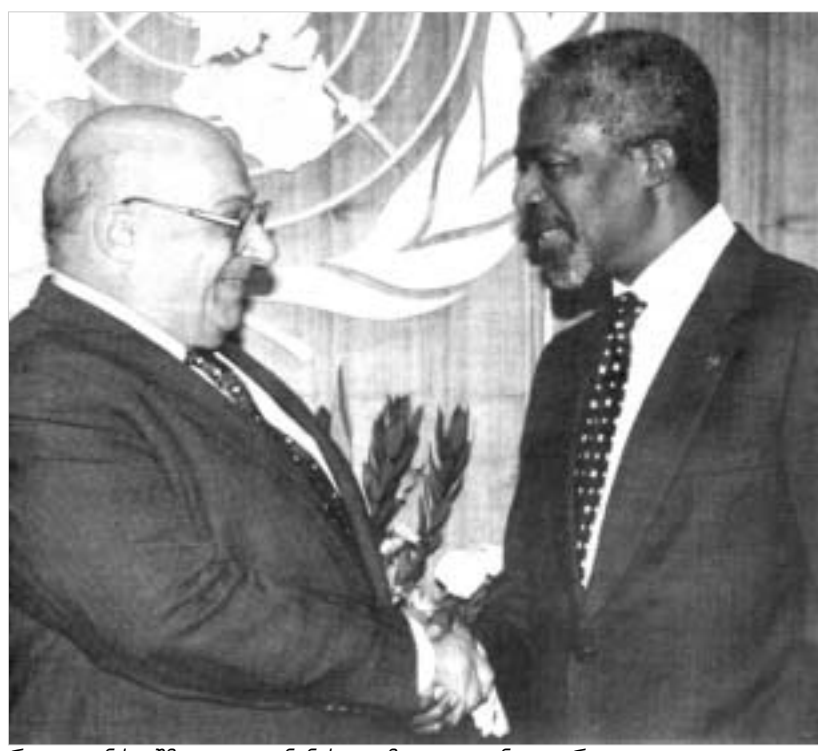
რაუფ დენქთაში კოფი ანანის გეგმა თავიდანვე უარყო.

ტესობა თავიანთი მეთაურის სანი-ნაოლმდგომი პოზიციაზე დგას. თურქული მოსახლეობის წინასწარვე ცნობილი განწყობიდან გამომდინარე, ბევრი უკვე რაუფ დენქთაშის გადადგომის აუცილებლობაზე საუბრობდა. თუმცა, თავად დენქთაში რეფერენდუმის საერთო შედეგების მის სასარგებლოდ დასრულებაზე ამხვილებს ყურადღებას და აცხადებს: "მე ვფიქროვ, რომ ჩემი გადადგომისათვის მიზეზი არ არსებობს, რადგანაც ჩემი მთავარი მიზანი მიღწეულია: ანანის გეგმა ჩაგრადა... ჩვენ გადავარჩინეთ ჩვენი რესპუბლიკა." თურქი ლიდერის სიტყვებით, ახლა საერთაშორისო თანამეგობრობამ თავისი დაპირებები საქმით უნდა დამტკიცოს და თურქული ანკლავის საერთაშორისო იზოლაციიდან გამოსვლას ხელი უნდა შეუწყოს. რეფერენდუმის შედეგები პროგნოზირებადი იყო, თუმცა მან მთელ მსოფლიოში გააქარწყლა ტრადიციული წარმოდგენა იმის შესახებ, რომ თურქი კვიპროსელები კუნძულის გაერთიანების წინააღმდეგნი არიან. ამერიკელებსა და ევროპელებს ახლა ნამდვილად მოუწევთ დაფიქრება - ღირს თუ არა თურქულ ანკლავზე აქამდე არსე-