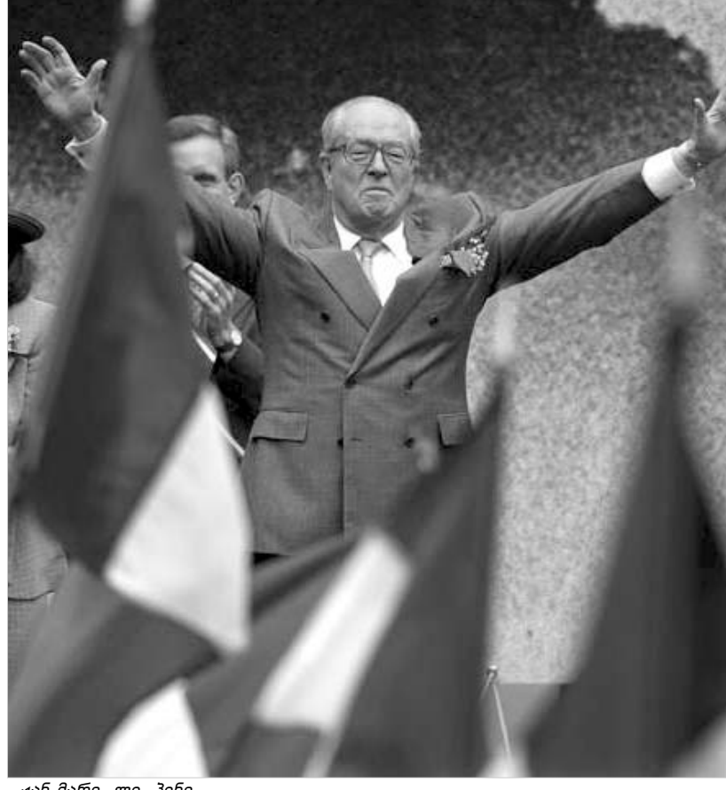
ჟან-მარი ლე პენი

აციო კანონმდებლობის გამკაცრებას უჭერენ მხარს. 2002 წელს მსოფლიო მოკრებილი იყო, რომ ლე პენმა საფრანგეთის საპრეზიდენტო არჩევნებში მეორე ადგილი დაიკავა. ალსანიშნავია, რომ ლე პენისა და მისი ბრიტანელი თანამოაზრეების შეხვედრის ადგილი საიდუმლოა. ამ საიდუმლო შეხვედრას "წლის პატრიოტული სადილი უწოდეს". ბრიტანეთის შინაგან საქმეთა მინისტრმა დევიდ ბლანკეტმა განაცხადა, რომ "თუ ლე პენი ზიზღის გააღვივებს, თუ საზოგადოებრივ წესრიგს დაარღვევს, მაშინ პოლიცია შესაბამის ზომებს მიიღებს." "პენის ირონიაა, რომ მემარჯვენე ფაშისტურმა პარტიამ მხარდასაჭერად უცხოელი მოიწვია, მაგრამ ბრიტანეთის ნაციონალური პარტიისათვის წინააღმდეგობები დამახასიათებელია," - დასძინა მან. პროკავშირები და ანტიფაშისტური ჯგუფები ბრიტანეთში საპროტესტო აქციების მოწყობას აპირებენ. მათი მტკიცებით, ლე პენის ჩამოსვლა სხვადასხვა რასის წარმომადგენლებს შორის დაძაბულობას გაზრდის და ყველას საფრთხეს შეუქმნის.