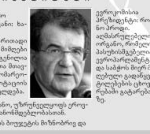
Sources: Europa, European Union, EuroParl Pictures: Associated Press © GRAPHIC NEWS

ევროკავშირის საბჭო გენერალური მდივანი: ხაიკარ სოლანა. ევროკავშირის ძირითადი გადაწყვეტილებების მიმღები ორგანო, წარმოადგენს ევრო-სახელმწიფოთა მთავრობებს. თავმჯდომარეობა ექვსთვიანი როტაციის პრინციპით ზრუნავს. ევროკომისია პრეზიდენტი: რომანო პროდი. აღმასრულებელი ორგანო, რომელიც პასუხისმგებელია ევროპარლამენტისა და საბჭოს მიერ მიღებული გადაწყვეტილებების ცხოვრებაში გატარებაზე.