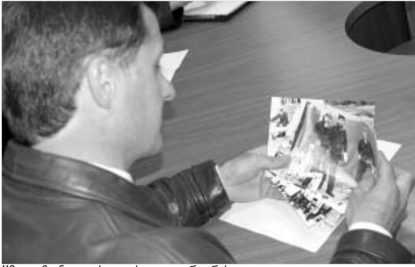
110 ადამიანი დღეს ცოცხალი აღარ არის.

საქართველოს შრომის, ჯანმრთელობისა და სოციალური დაცვის მინისტრის გიგა წერეთლის ბრძანებით, გუშინ, 26 აპრილს, ჩერნობილის ავარიის მე-18 წლისთავთან დაკავშირებით, ჩერნობილის ატომური ელექტროსადგურის ავარიის ლიკვიდაციამო მონაწილეობა და მათი შვილებსთვის, ქვეყნის მასშტაბით, უფასო სამედიცინო კონსულტაციები ჩატარდა. 110 ადამიანი 2000-დან, ვინც 1986 წელს ჩერნობილში საქართველოდან გაგზავნეს, დღეს ცოცხალი აღარ არის, დანარჩენი, როგორც თავად "ჩერნობილელები" ამბობენ, სტაბილური ინვალიდია. ავარიის ლიკვიდატორთა 400-ზე მეტი ბავშვი, რომელიც ავთუქების შემდეგ დაიბადა, მუდმივ სამედიცინო მეთვალყურეობას საჭიროებს. გიგა წერეთლის განცხადებით, უფასო სამედიცინო კონსულტაციები ჩერნობილის ავა-