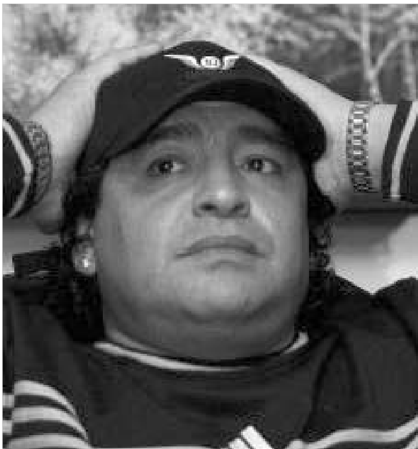
მარადონა „თავისუფლების კენძელზე“ აფარებს თავს

2000 წელს მარადონა ურუგვაიში იმყოფებოდა დასასვენებლად, როდესაც რენიმატოზი ამოჰყო თავი. ექიმებმა მას ჰიპერტონიური კრიზი დაუდგინეს. აღმოჩნდა, რომ