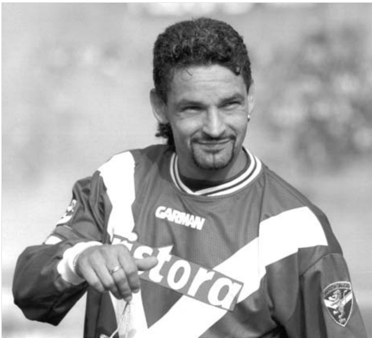
რობერტო ბაქო ბრუნდება

იტალიის ნაკრების მწვრთნელი ესპანეთის ნაკრებთან თამაშს აფასებს, როგორც მომავალი ევროპის ჩემპიონატისთვის მზადების ერთ-ერთ ეტაპს, ამიტომ სარეზერვო ფეხბურთელებსაც თავის გამოჩენის შანსს აძლევს.