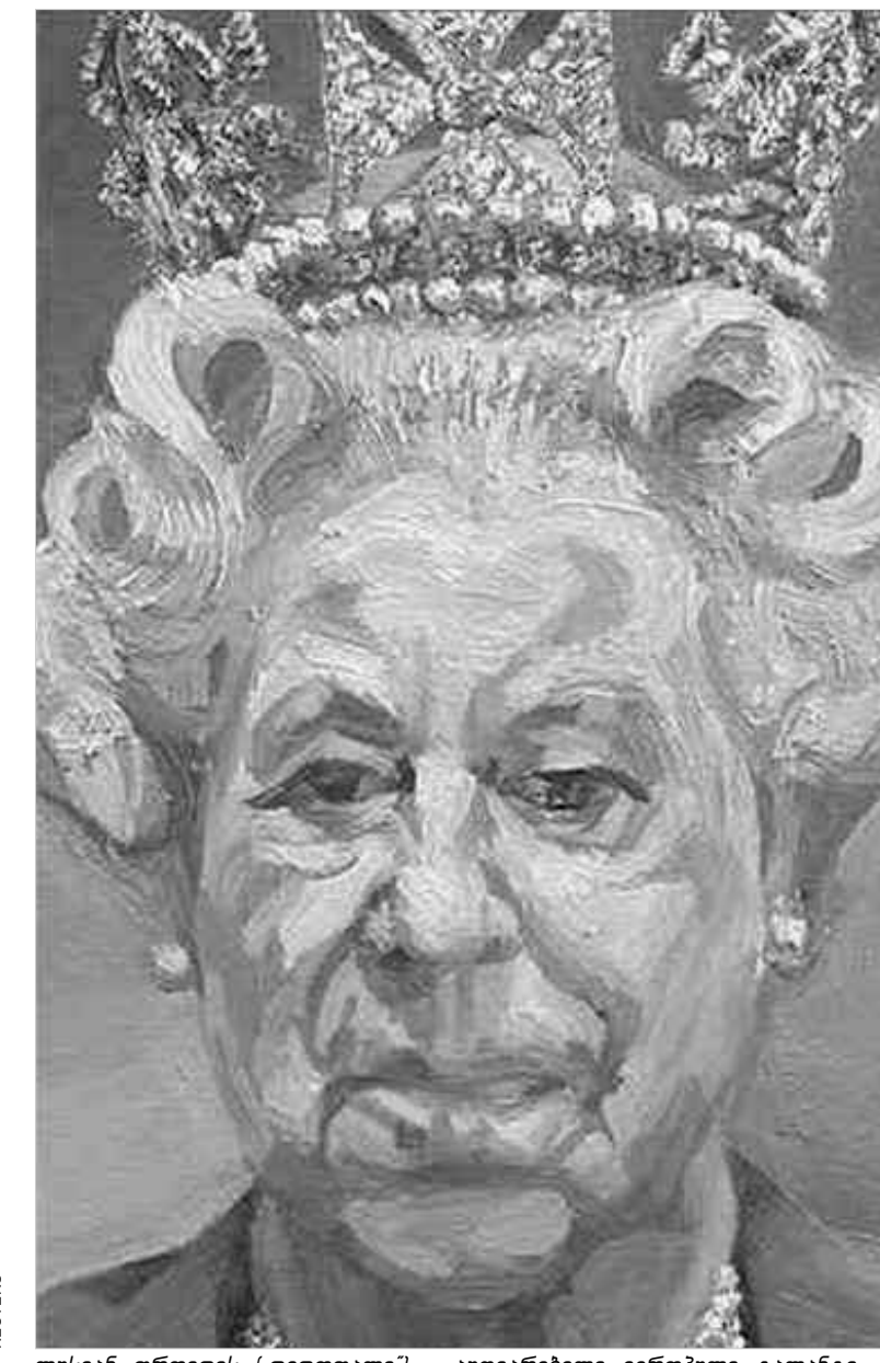
ლესიან ფრიდის (დედოფალი) - აღიარებული ევროპული ტალანტი

ალბათ, ისევე ცნობილი კოლექციონერის ჩარლზ საათჩის ფრანგული მარკეტინგის დახმარებითაა ის, რომ ბრიტანეთში სმენიათ მაინც ე.წ. Y.B.A-ის (ახალგაზრდა ბრიტანელი ხელოვნების) შესახებ. თუმცა, იგივე ბრიტანეთშიც დემიენ ჰარსტს - თავისი გაფანტული ეგზოტიკა და