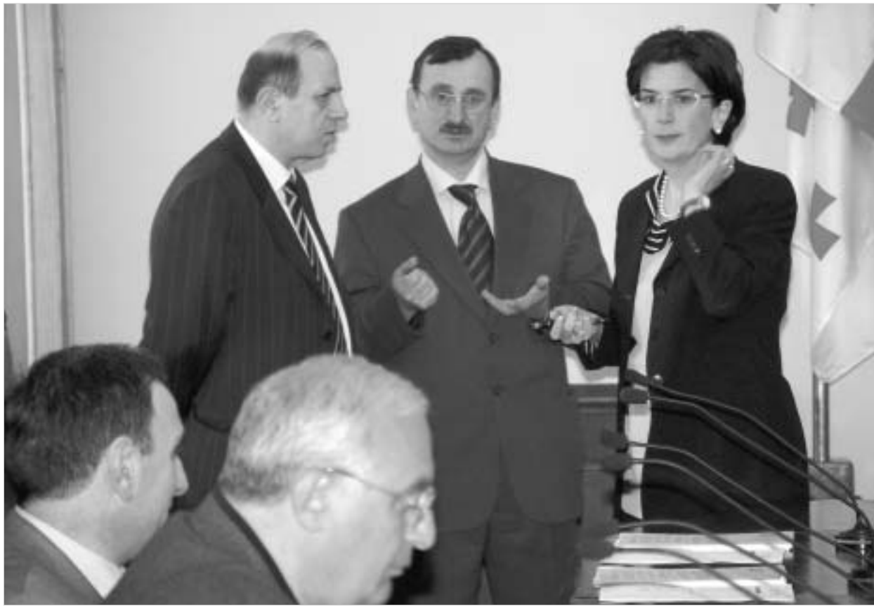
ბიუროს ახალი შემადგენლობა მუშაობას შეუდგა.