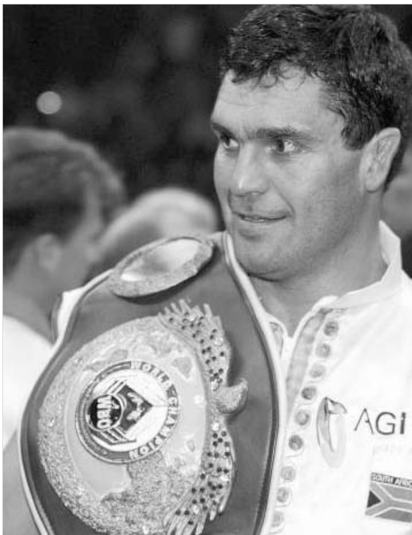
კორი სანდერსი: „ჩემი საქმე წასულია“

კორი სანდერსი, რომელიც შაბათს, WBC-ს ვერსიით მსოფლიო ჩემპიონის ტიტულისთვის ბრძოლაში ვიტალი კლიჩკოს წინააღმდეგ დამარცხდა, მიიჩნევს, რომ მისი საკრიგო კარიერა დასრულდა. „ვფიქრობ, ჩემი საქმე წასულია. მგონი კარიერის დასრულების აუცილებლობის წინაშე ვდგავარ. ჩემი მთავარი პრობლემა ჩემი ასაკია - მალე 39 წლის გახდები. კრივიდან დროულად უნდა წახვიდე და ვფიქრობ, რომ ჩემი დროც მოვიდა.“ - განაცხადა სანდერსმა, რომელმაც კლიჩკოს წინააღმდეგ ბრძოლაში ცხვირი გაიტყვა.