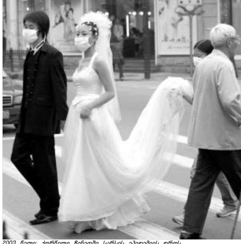
2003 წელი: ქორნილი ჩინეთში სარსის ეპიდემიის დროს.

რუსი პირველად გამოჩნდა. მაშინ ეპიდემიამ ათასობით ადამიანის სიცოცხლე შეინირა. მოგვიანებით, აზიიდან ეს ვირუსი მსოფლიოს სხვადასხვა ქვეყანაში გავრცელდა. ვირუსისგან თავის დასაცავად, ფაქტობრივად, მთელი აზია არჩინა-ლებით დადიოდა. ერთი წლის წინ, როდესაც ვირუსი პირველად გამოჩნდა, ჩინეთის ხელისუფლებამ დაავადების შესახებ ინფორმაციის დამალვა სცადა, რათა ტურიზმისა და ეკონომიკური აქტივობისათვის პრობლემები არ შეექმნა. თუმცა, ჩინელი ბიუროკრატებისთვის მოულოდნელად ეპიდემია ძალიან სწრაფად დაიწყო. ამის გამო ოფიციალურმა პეკინმა საკუთარი მოქალაქეებისა და საერთაშორისო თანამეგობრობის რისხვა დამსახურა. სარსის ეპიდემიის გამო, თანამდებობიდან გადადგა ჯანდაცვის ახლადანიშნული მინისტრი. როგორც ჩანს, ჩინეთის ხელისუფლებამ მწარე გაკვეთილი გაითვალისწინა - სარსის ერთეული შემთხვევების გამოჩენისთანავე განაგრძობს და ახლა პრევენციული ზომების მიღებას ცდილობს.