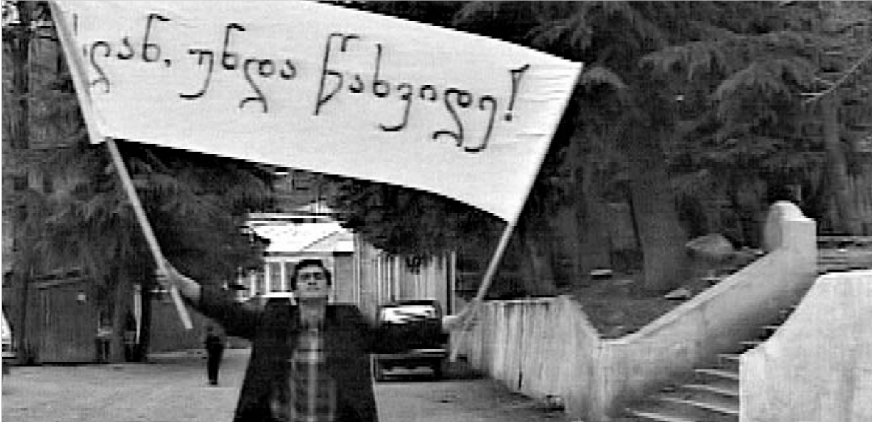
აქციის მონაწილე ხელმოწერის მომხრეები.