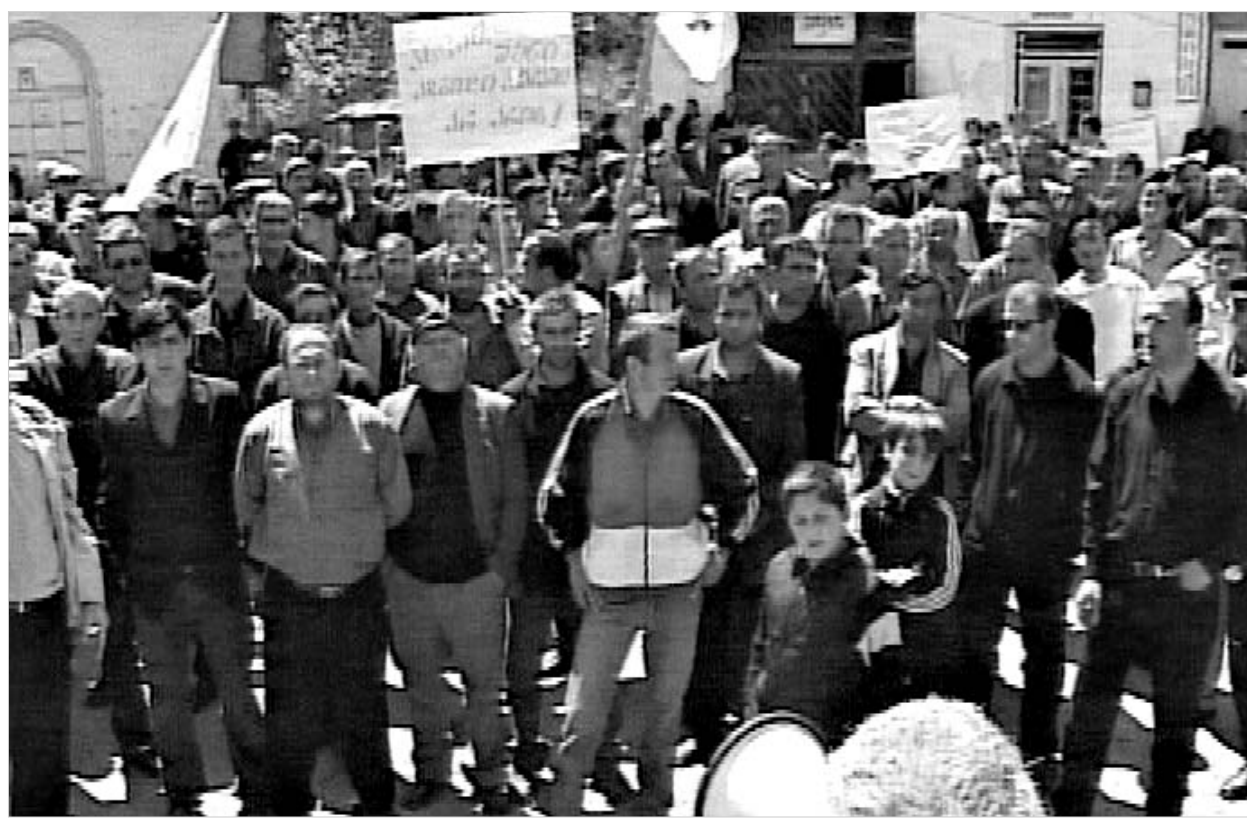
ხულოს აქციის მონაწილენი ბათუმში აპირებენ გადასვლებას.

დებათ, მაგრამ მათ შესანიშნავად ესმით პრობლემის მთავარი არსი. ამიტომაც, გუშინდელი და გუშინდელი აქციების მონაწილეთა მთავარი მოთხოვნები პოლიტიკური ხასიათისა იყო: “ძირს აბაშიძის ავტორიტარული რეჟიმი”, “მოვითხოვთ უკანონო შეიარაღებული ფორმირებების დაშლას”, “დროა, ასლან აბაშიძე გადადგეს”, - ამბობს დიასამიძე. მომიტინგეები ასევე მოითხოვენ მოსახლეობიდან იარაღის ამოღებას, ჩოლოქის საკონტროლო პუნქტსა და გოდერძის უელტეხილზე ბლოკოსტების გაუქმებას. დიასამიძის ინფორმაციით, მალაშვილის რაიონების საპროტესტო ღონისძიება შუახვევით დასრულდება. შემდეგ ეტაპზე, როგორც უკვე მოგახსენეთ, მოსახლეობაში დაინყება აქტიური დიალოგი ასლან აბაშიძის გადადგომის მოთხოვნით ხელმოწერების შესაგროვებლად. ერთ-ერთი მომავალი ღონისძიება ე. წ. დიასახლისების დიდი აქცია, უშუალოდ ზაფხულის სეზონს უკავშირდება.