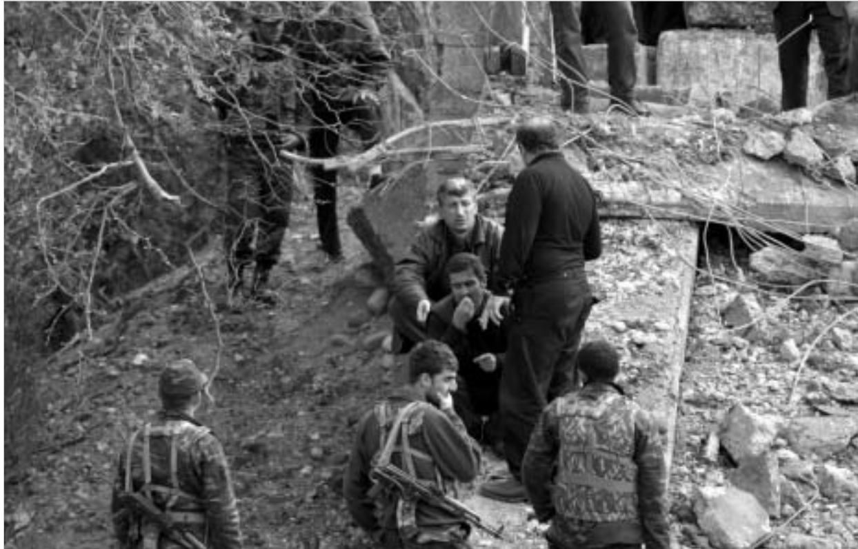
აფეთქებული ჩოლოქის ხიდი დღეს.